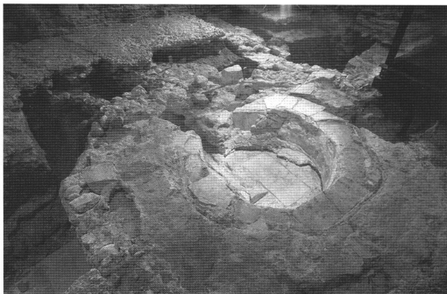
Fig. 2 Les cuves des baptistères successifs.

chantier et les principaux résultats archéologiques, alors que des écouteurs offrent la possibilité d'une visite commentée. Celle-ci est proposée en plusieurs langues par des historiens ou des archéologues suisse-allemand, italien, espagnol, anglais ou japonais qui expliquent le site de Genève en faisant référence à leurs propres expériences.