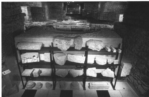
Fig. 6 La collection lapidaire dans le musée du site.

En conclusion, le site archéologique de la Cathédrale Saint-Pierre n'est pas seulement l'aménagement de quelques vieux murs mis à disposition du public. Il s'intègre dans une chaîne de monuments dont la visite a été facilitée par une réflexion permettant de mieux comprendre le passé de nos régions. Souvent, cela a été l'occasion de retrouver une histoire méconnue et de jouer un rôle dans l'enseignement et la recherche. On peut y ajouter encore une volonté de conservation d'un patrimoine très vulnérable. L'archéologie du bâti, qui relie les élévations et le sous-sol, permet aussi de réfléchir aux problèmes de la restauration des édifices médiévaux et de leur intégration dans l'urbanisme d'aujourd'hui. C'est sans doute l'un des apports de cet aménagement à Genève qu'il faudra également analyser sur une plus longue période encore puisque son inauguration date déjà de 1986.