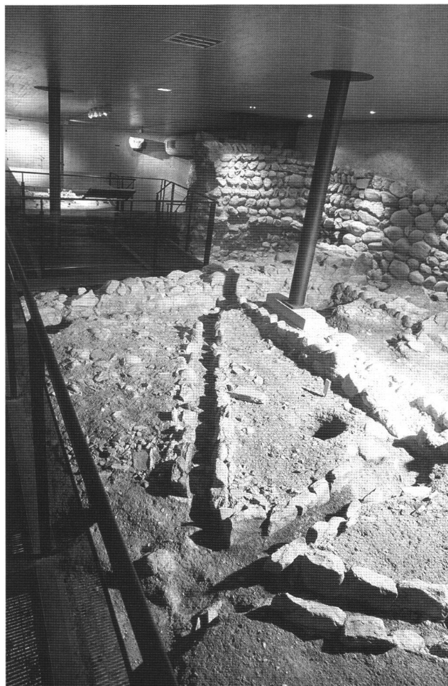
Fig. 3 Conduits rayonnants d'un système de chauffage.

transmettre et identifié les éléments les plus significatifs. Il était clair que notre démonstration devait porter sur les premiers temps chrétiens, particulièrement spectaculaires dans ce cas (fig. 2). Le choix de passerelles en structure métallique, caillebotis et plaques de verre sécurisé assurait non seulement une transparence à l'égard des structures anciennes mais permettait de les approcher au plus près (fig. 3). Le parti pris de lignes très pures pour toute la part contemporaine s'est révélé très judicieux dans la mesure où il rend aux vestiges toute leur force d'évocation (figs. 4 et 5).