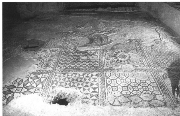
Fig. 5 Le sol en mosaïque de la salle de réception de l'évêque.

Un autre exemple particulièrement significatif de site aménagé vient d'être inauguré à côté de la Cathédrale de Barcelone. Ayant été associé au projet, nous avons pu prendre connaissance des possibilités actuelles de tels aménagements. La signalétique, fondée sur d'autres options, est constituée de petits panneaux métalliques où les monu-