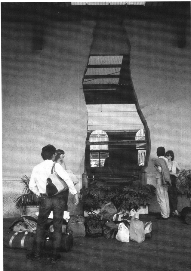
Abb. 1 Bologna, Hauptbahnhof, Denkmal des Attentats 1983.

Nicht die unsichtbare Anpassung also ist das Ideal der Denkmalpflege, sondern die angemessene, intellektuelle kreative Spur neben oder im Denkmal. Dabei darf durchaus auch der Begriff der Harmonie eine Rolle spielen, aber es ist nicht eine oberflächliche Harmonie des Versteckens und Verdrängens, sondern eine Harmonie der toleranten