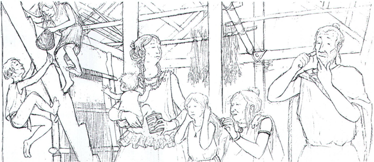
Abb. 6 Vorbereitungen zum Fest, von Dani Pelagatti, Atelier Bunter Hund, Zürich, 1994. Bild aus dem Bronzezeitquartett des Museums für Urgeschichte(n) Zug.

aufschneidet (Abb. 7). Doch sehr viel häufiger ist die Reaktion auf diese von den Museumsgestaltern Stéphane Jaquenoud und Ralph Kaiser und dem Figurenbildner Gerry Embleton perfekt umgesetzte Darstellung ausgesprochen positiv. Sie gibt der Zuger Ausstellung eine Frische, die sehr geschätzt wird. Die Zeiten für ein neues Bild, für einen neuen Blick auf die Ur-Geschichten gerade in Museen sind günstig. Im Kampf um Besuchersegmente haben mittlerweile die meisten Verantwortlichen begriffen, dass eine Ausstellung nicht Selbstzweck ist, sondern die gesamte Bevölkerung – in der die erwachsenen Helden eine klare Minorität bilden – ansprechen muss und soll. Von den Museumsfrauen (und -männern) braucht es hier mutige Entscheide und das Wagnis, manchmal anzuecken, von den Museumsverantwortlichen den Weitblick, diese neue Sicht in der Museumsgestaltung zu unterstützen. Vielleicht könnte die am Schweizerischen Landesmuseum in Zürich organisierte Tagung Anlass bieten, ein Forum zu schaffen, bei dem Museumsgestalterinnen und -gestalter in einem regelmässigen, ungezwungenen Austausch Fragen der praktischen Umsetzung und Vermittlung besprechen würden.