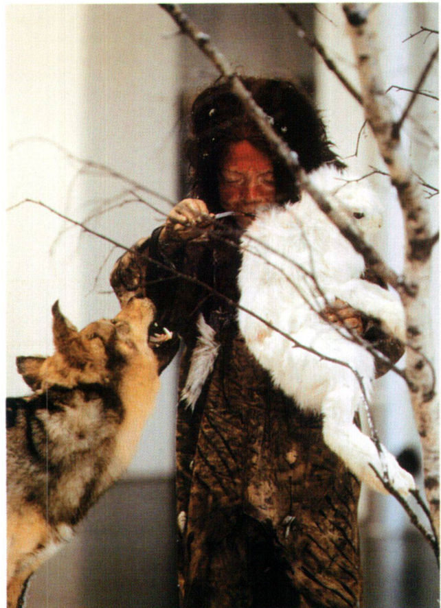
Abb. 7 Altsteinzeitliches Mädchen mit Hund, von Gerry Embleton, Prêles. Figur im Museum für Urgeschichte(n) Zug.

aufschneidet (Abb. 7). Doch sehr viel häufiger ist die Reaktion auf diese von den Museumsgestaltern Stéphane Jaquenoud und Ralph Kaiser und dem Figurenbildner Gerry Embleton perfekt umgesetzte Darstellung ausgesprochen positiv. Sie gibt der Zuger Ausstellung eine Frische, die sehr geschätzt wird. Die Zeiten für ein neues Bild, für einen neuen Blick auf die Ur-Geschichten gerade in Museen sind günstig. Im Kampf um Besuchersegmente haben mittlerweile die meisten Verantwortlichen begriffen, dass eine Ausstellung nicht Selbstzweck ist, sondern die gesamte Bevölkerung – in der die erwachsenen Helden eine klare Minorität bilden – ansprechen muss und soll. Von den Museumsfrauen (und -männern) braucht es hier mutige Entscheide und das Wagnis, manchmal anzuecken, von den Museumsverantwortlichen den Weitblick, diese neue Sicht in der Museumsgestaltung zu unterstützen. Vielleicht könnte die am Schweizerischen Landesmuseum in Zürich organisierte Tagung Anlass bieten, ein Forum zu schaffen, bei dem Museumsgestalterinnen und -gestalter in einem regelmässigen, ungezwungenen Austausch Fragen der praktischen Umsetzung und Vermittlung besprechen würden.