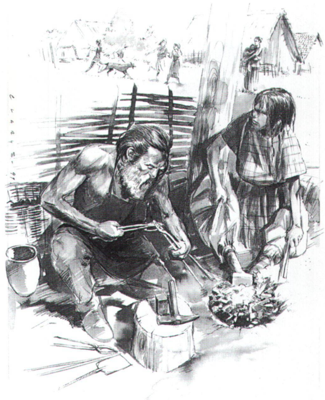
Abb. 4 Mädchen am Blasbalg in der Schmiede, von Benoît Clarys, 1999.

Erfahrung. Seit ich 1990 die Leitung des Museums für Urgeschichte in Zug übernommen habe, war ich bei der Schaffung von rund 60 Lebensbildern, Figuren oder Modellen als Auftraggeberin oder wissenschaftliche Begleiterin beteiligt. Dabei war meine Position noch relativ komfortabel, denn als Museumsfrau wird einem mehr Freiheit zugestanden als bei einer rein wissenschaftlichen Arbeit. Trotzdem überraschten mich immer wieder Rück-