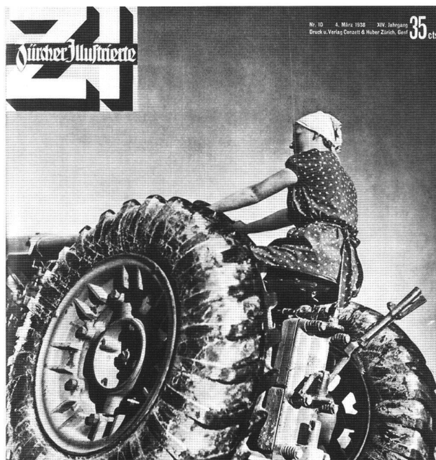
Abb. 4 Ohne Tracht auf dem Traktor, 1930er Jahre. Das Titelbild der «Zürcher Illustrierten» vom März 1938 kontrastiert mit dem damals propagierten Bild der Bäuerin in der Tracht. Rechtliche, ausbildungsmässige und ökonomische Diskriminierungen ermöglichten ihr kaum einen selbständigen Status.

hatten, Kredite und Subventionen. 8 Die lang gepflegte Ikonographie der Schweizer Bäuerin kaschierte nicht nur deren rechtlich abgesicherte Diskriminierung, sondern auch die Komplexität bäuerlicher Existenzweise und die strukturell bedingten Unterschiede in der Arbeitsteilung zwischen den Geschlechtern je nach Region und Betriebsart.