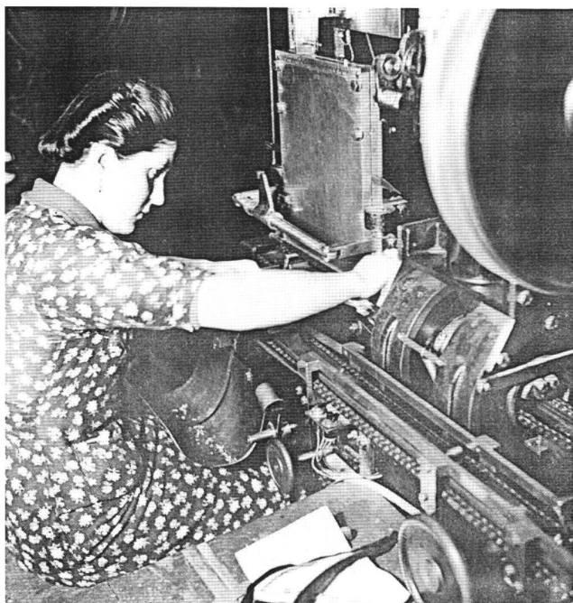
Abb. 3 Frau an der Maschine, von Hans Staub, 1930er Jahre. Entgegen dem tradierten und rechtlich sanktionierten Bild der Trennung von weiblicher und männlicher Sphäre arbeiteten Frauen seit Beginn der Industrialisierung an schweren Maschinen.

tige Mütter, geschützt von landesverteidigenden Männern andererseits (Abb. 6), zeigt sich der bis weit ins 20. Jahrhundert reichende dominante Diskurs. 9 In der Bezugssetzung der typischen Schweizer Produktionsgüter zu den eigentlichen bäuerlichen, industriellen und gewerblichen Produzentinnen und Produzenten (Abb. 3 bis 5) und deren spezifischen Lohn- und Erwerbsbedingungen, aber auch zu den Eigentums- und Vermögensverhältnissen würden nicht