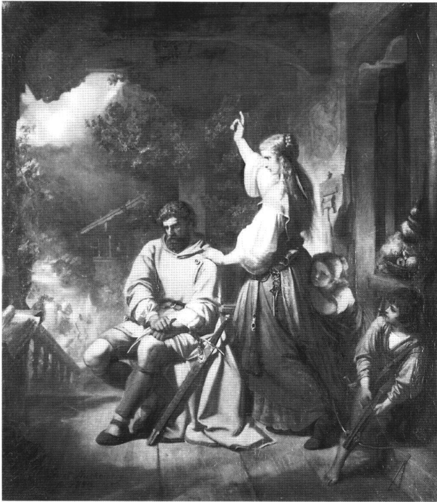
Abb. 2 Die Stauffacherin, von Ernst Stückelberger, 1856. Die Ängstlichkeit des Töchterchens und der Tatendrang des Sohnes hebt die eher ungewöhnliche Geschlechterkonstruktion – ein äusserst zaghafter Stauffacher und eine äusserst energische Stauffacherin – wieder auf.

lichen der Bereich des Privaten. Im alltäglichen Handeln jedoch verwischten sich die Ebenen, waren die Handlungsbereiche nicht immer so eindeutig zugeordnet, waren Frau und Mann nicht a priori oppositionelle Pole.