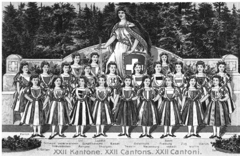
Abb. 1 Postkarte der Wende vom 19. zum 20. Jahrhundert. In der allegorischen Figur der Helvetia und ihrer Töchter spiegelt sich das Bild einer wehrhaften und föderalistischen Schweiz; in der Realität dagegen waren Frauen auch nach der Gründung des Bundesstaates von 1848 politisch und rechtlich diskriminiert.

Anlässlich des Festumzugs zur Eröffnung des Landesmuseums 1898 kritisierte der 1849 geborene Eugen Huber, Verfasser des Zivilgesetzbuches (ZGB) von 1912, in einer Satire mit dem Titel «Auch ein Festzug zur Einweihung des Landesmuseums» insbesondere die rechtliche Benachteiligung der Frauen. Huber war nicht nur der ersten Schweizer Ärztin, Marie Heim-Vögtlin, sondern auch Helene von Mülinen, einer der Gründerinnen des Bundes Schweizerischer Frauenvereine (BSF), freundschaftlich verbunden. 1 Trotzdem konnte keine Frau Einsitz nehmen in die nationalrätliche Expertenkommission für den Gesetzesentwurf, sondern die Frauen mussten ihre Anliegen durch den Juristen Max Gmür einbringen, was schon als Erfolg gewertet wurde. Das massgeblich von Huber geprägte neue ZGB vereinheitlichte zwar das Privatrecht und damit die zivilrechtliche Stellung der Frauen in der Schweiz, schrieb aber deren Unmündigkeit trotz einiger