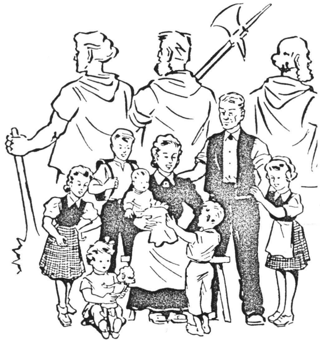
Abb. 6 Die Offensive des Lebens des rechtsbürgerlichen Gotthardbundes von 1941. Der Gotthardbund, Exponent einer reaktionären Familienpolitik, sah in den Frauen vor allem ein Mittel seiner natalistischen Politik. Er konstruierte die Städterin als egoistische und staatsfeindliche Figur, die kinderreiche Familie dagegen als Grundstein einer wehrhaften Schweiz.

19. und die Eugenikprogramme des 20. Jahrhunderts, die Armeevorschriften und die Kriegsvorsorge, die Filme der geistigen Landesverteidigung – die legendäre «Gilberte de Courgenay» ebenso wie die Filmwochenschau.