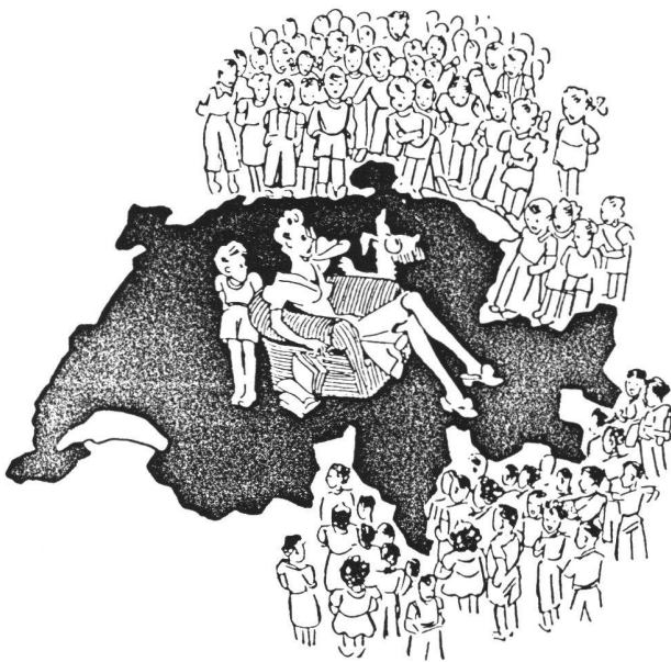
Die bequeme und kinderarme Schweiz wird erdrückt von lebensfrohen und lebensstarken Nachbarvölkern

liches Beziehungsgeflecht, das weit weniger öffentliche Beachtung fand als das männliche und das ikonografisch kaum zum Ausdruck kommt. Sie erfordert in viel stärkerem Masse die Erschliessung privater Quellen. Vor allem private Briefkorrespondenzen ermöglichen die Rekonstruktion lebensweltlicher Beziehungsgeflechte und die Rekonstruktion der nachbarschaftlichen und verwandtschaftlichen, auf Reziprozität beruhenden Verpflichtun-