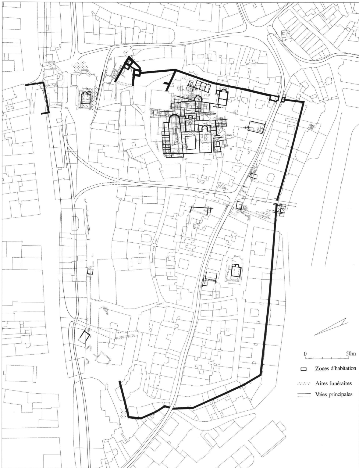
Fig. 2 Plan de l'enceinte réduite de Genève au VI e siècle.