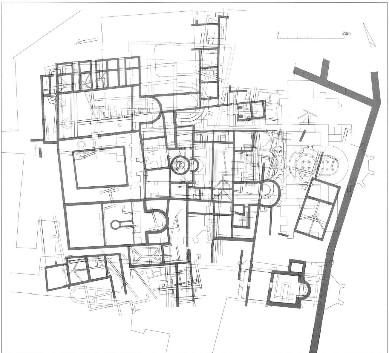
Fig. 3 Plan schématique du groupe épiscopal au V e siècle (Genève).

D'autres villes du Bas Empire laissent deviner une organisation centrée sur différents noyaux, chacun avec une fonction spécifique. Si dans certains cas on observe une continuité assez claire, d'autres exemples font apparaître des réorganisations. Kaiseraugst présente une urbanisation très intéressante avec une église épiscopale, des thermes, les horrea et peut-être les principia . Le centre religieux a su s'intégrer à l'urbanisme antérieur, tout en suscitant le déve-