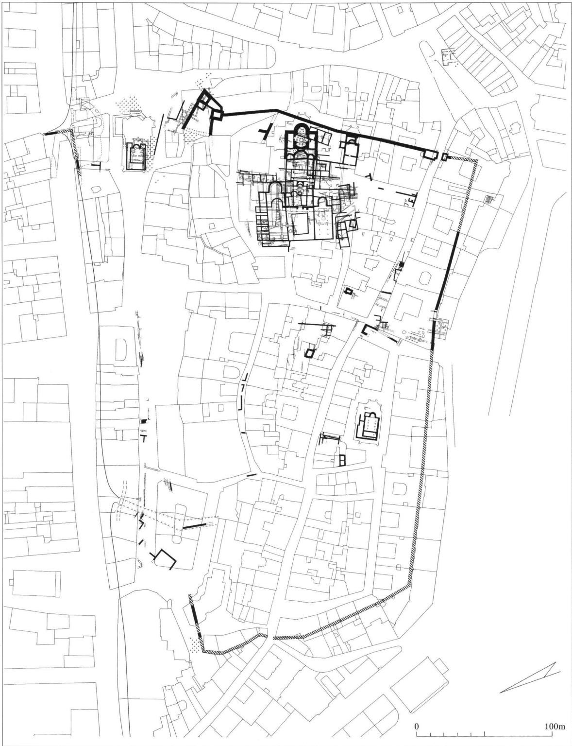
Fig. 5 Plan de l'enceinte réduite durant la fin du 1 er millénaire (Genève).