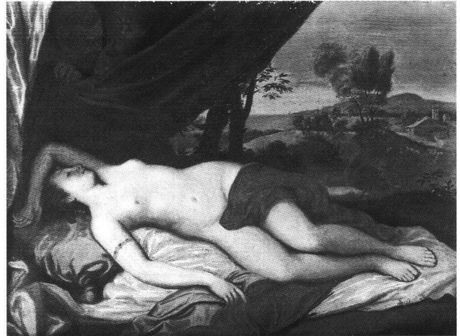
Fig. 7 Pastel par Jean-Etienne Liotard d'après «Titien.» Vénus. Amsterdam, Rijksmuseum.

Un tableau. Estimé L. 360 dans le catalogue inconnu de 1756 (Alric Devos). Vendu à Paris en 1788 avec six autres tableaux par Liotard fils à l'insu de sa famille pour le vil prix de L. 1200.