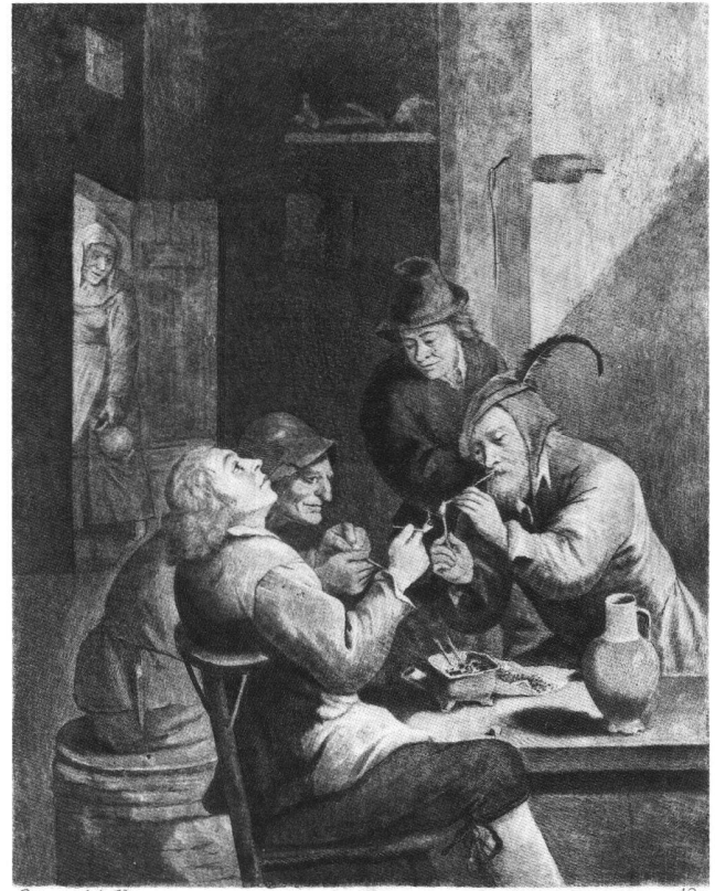
Fig. 3 Gravure par Jean-Etienne Liotard d'après C. le Vayer. Fumeurs flamands. Collection privée.

Les œuvres suivantes de Liotard se chiffrent à environ 120, dont 23 dessins, dix miniatures, sept émaux. Environ 28 sont à présent connues avec certitude; leur localisation actuelle est ajoutée en parenthèses, avec références aux catalogues de Loche-Roethlisberger et de Herdt. 62 Une description trop sommaire de certaines autres œuvres en empêche l'identification. Le catalogue raisonné