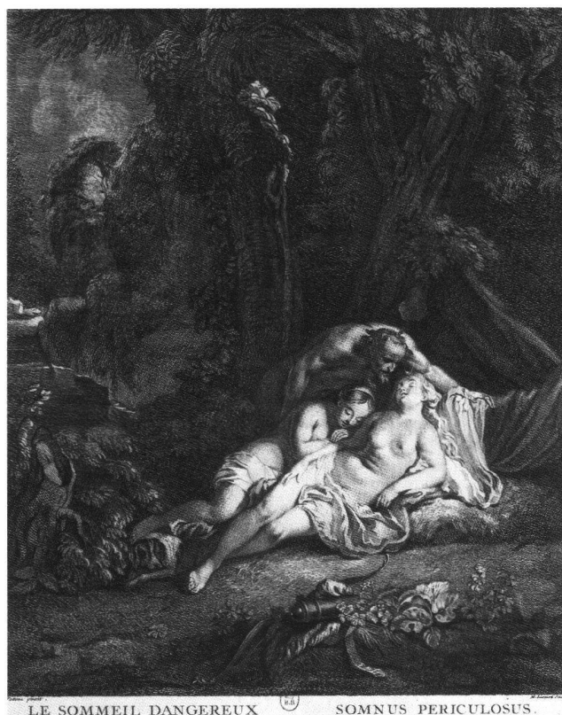
Fig. 9 Gravure par Jean-Michel Liotard d'après Watteau. Le sommeil dangereux. Collection privée.

* (fig. 9) Diane endormie, une nymphe dort à côté d'elle, un satyre regarde, un des plus beaux du maître. Jean-Michel Liotard grave le tableau en 1730 sous le titre Le Sommeil dangereux (24 × 18 p.) pour le Recueil Jullienne ; le tableau passe en 1730 ou 1731 de Jullienne à Jean-Michel. Jean-Etienne le lui achète avant 1756. Estimé L. 3000 dans le catalogue inconnu de 1756. 1771, 57 (20 × 16½ p.). 1773, 17 (éd. angl: 120 gns.). 1774b, 49 (Two Venusses sleeping with satyrs), pour 12 gs. à Deleroux, mais en effet invendu: 1777, Tronchin, p. 3. 1785, 15 (20 × 15½ p.). Vendu à Paris en 1788 par Liotard fils à l'insu de sa famille pour un vil prix (L. 10320 avec les deux van Huysum et un Autoportrait de Rembrandt). Inconnu depuis. 78