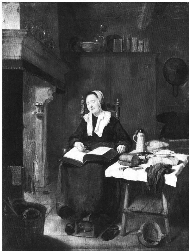
Fig. 2 Quirin van Brekelenkamp. Femme dans un intérieur hollandais. Londres, National Gallery.

* (fig. 2) Une vieille qui s'endort en lisant, son dîner à côté