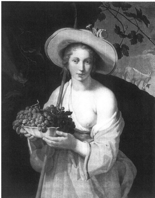
Fig. 1 Abraham Bloemaert. Bergère. Karlsruhe, Staatliche Kunsthalle.

L'heure de la grand messe. Et le pendant. 1789/91, 42, 43, chacun L. 4.