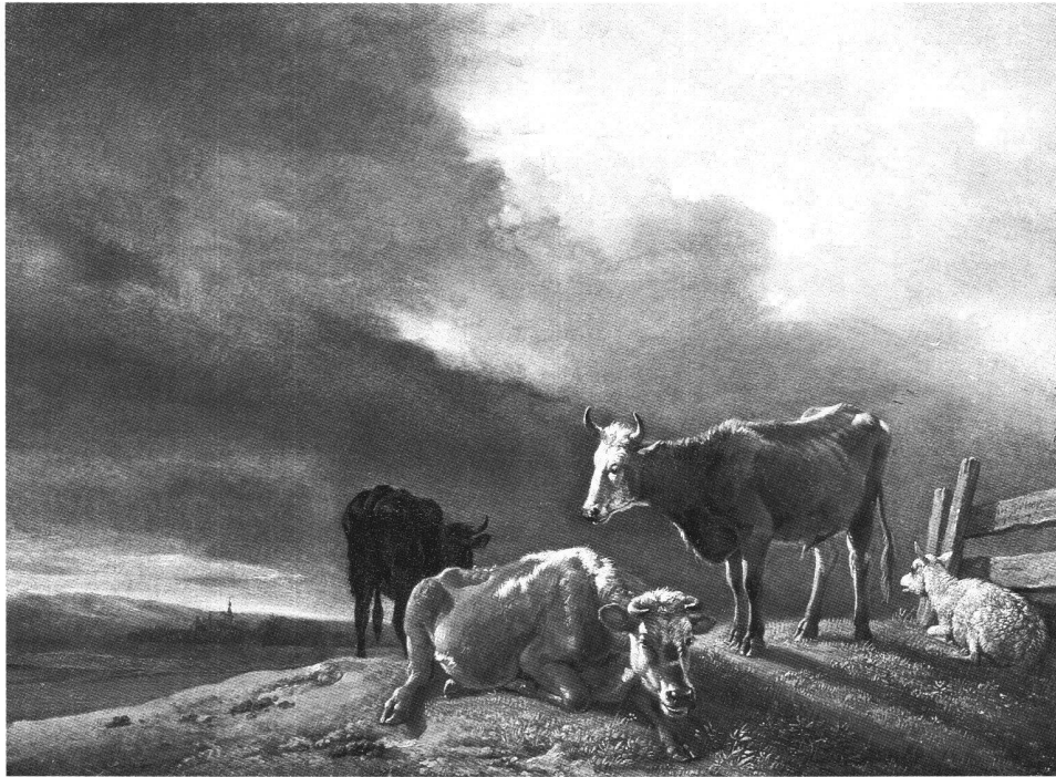
Fig. 4 Paulus Potter. Paysage avec animaux. Amsterdam, Galerie Salomon Lilian.

RUBENS, élève Très beau cheval ou âne rayé qu'un turc tient par la bride, excellent. 15×18 p. 1761C, 29 (L. 50). SAFTLEVEN, Herman Deux petits paysages. Bois, 7×9 p. 1761C, 21 (L. 160). 1771, 65, 66, 6×8 p. 1773, 34, 35. 1774a, 72. 1777, Tronchin, p. 3 (une moisson, une rivière avec bateaux et gros arbre. 1650). SANTERRE, Jean-Baptiste, 1651–1717 Dame riant, menace de la main droite, de l'autre s'appuie sur