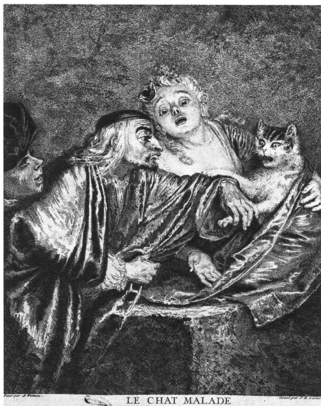
Fig. 8 Gravure par Jean-Etienne Liotard d'après Watteau. Le chat malade. Collection privée.

«Tous les dessins de Wateau» cités dans une lettre de Liotard