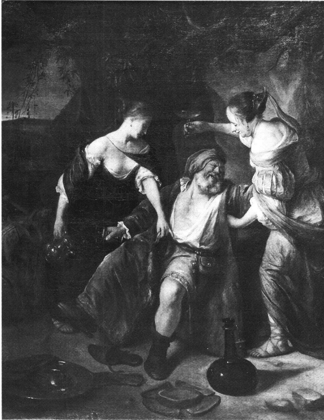
Fig. 6 Jan Steen. Loth et ses filles. Konstanz, Städtische Wessenberg-Galerie.

Van de Velde: Velde. Van Dyck: Dyck. Van Goyen: Goyen. Van Haarlem: Cornelis. Van Huysum: Huysum. Van Vliet: Vliet. Vayer: Le Vayer. Vega: Bega.