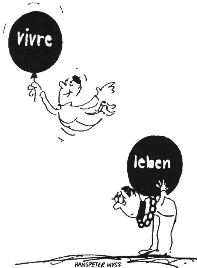
Fig. 3 Médias et associations de la société civile peuvent favoriser, chacun à sa manière, une connaissance de «l'autre» allant au-delà des clichés. Dessin de Hanspeter Wyss.

presse écrite étant de plus en plus tributaire d'impératifs purement économiques, cela signifie aussi du journalisme de sensation et une attention particulière portée aux forces centrifuges du pays. La rengaine du «Röstigraben» aux lendemains de votations fédérales n'en constitue que l'exemple plus notoire (à noter que le terme est désormais entré dans les mœurs même lorsque le clivage linguistique