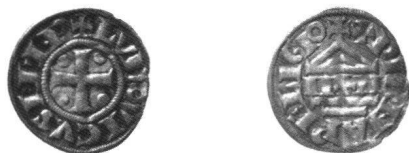
Abb. 2 Grafschaft Savoyen, Münzstätte St-Maurice, Denier (1. Hälfte 14. Jh.).

In der Westschweiz blieb man hingegen bei der traditionellen Form des Denars. Die Münzherren behielten hier die Münzbilder der Karolingerzeit teilweise sehr lange bei («types immobilisés»). Die Denare von St-Maurice tradierten noch im 14. Jahrhundert ein Münzbild von Ludwig dem Frommen weiter (Abb. 2). 10 Im Gegensatz zur weiten Verbreitung der Zürcher Pfennige waren die in der Westschweiz dominierenden Prägungen aus Lausanne und Genf eher von lokaler Bedeutung und blieben auf das Genferseebecken beschränkt. 11