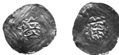
Abb. 1 Bistum Basel, Bischof Beringer (1057–1072), Dünnpfennig, gefunden in der Kirche Walkringen BE.

In der Karolingerzeit zirkulierte im ganzen fränkischen Reich mit wenigen Ausnahmen eine einzige Münzsorte. Der Denar oder Pfennig wurde zwar von verschiedenen Münzstätten herausgegeben, war aber in Gewicht und Feingehalt (Silbergehalt) überall gleich. Nach dem Zerfall des Karolingerreiches ging diese Einheit verloren, und es bildeten sich ab dem 9./10. Jahrhundert regionale Eigenheiten heraus. Im Gebiet der heutigen Deutschschweiz wurden die Pfennige immer grösser im Durchmesser, gleichzeitig aber immer dünner, bis sich das Münzbild der beiden Seiten gegenseitig durchdrang und teilweise auslöschte. Solche Dünnpfennige wurden vom 10. bis zum 12. Jahrhundert von Basel, Zürich, St. Gallen und Chur ausgegeben (Abb. 1). Eine ähnliche Entwicklung durchliefen gleichzeitig, teilweise auch etwas später, die Münzen in einigen Gebieten Deutschlands. 7