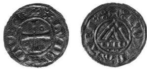
Abb. 4 Grafschaft Neuenburg, Ludwig, zweiseitiger Denier, um 1350.

Eine interessante Rolle spielten im 14. und 15. Jahrhundert die beiden nahe an der Währungsgrenze gelegenen Münzstätten Freiburg und Neuenburg. Während die älteste Neuenburger Münze des Grafen Ludwig eine zweiseitige Prägung nach Lausanner Vorbild darstellte (Abb. 4), wechselte die Münzstätte kurze Zeit später zur einseitigen Münzprägung nach Berner und Solothurner Vorbild (Abb. 5). Am grossen Münzbund von Basel von 1387 nahm neben Bern und Solothurn auch Neuenburg teil, woraus die damalige münzpolitische Orientierung der Stadt nach Osten klar ersichtlich wird. 16