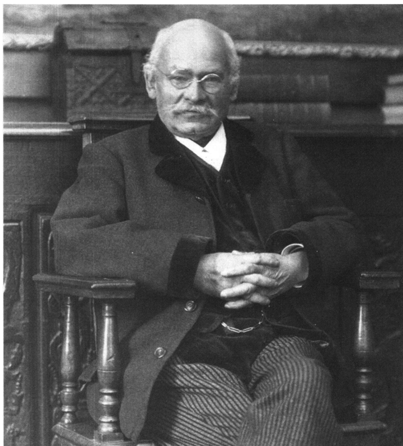
Fig. 2 Portrait d'Alexis Forel au musée à Morges, 1920.

Pendant de nombreuses années et jusqu'à la parution de ce catalogue, un certain mystère a entouré l'origine et le nombre exact d'estampes constituant sa collection, et cela,