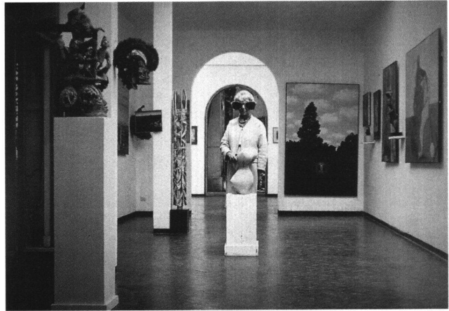
Abb. 2 Abbildung im Katalog der Sammlung Peggy Guggenheim in Venedig mit der Sammlerin, um 1960.

ser Weise haben wir damit das andere Ende der Entwicklung erreicht, an deren Anfang der eingangs geschilderte Katalog der Sammlung Johnson stand: In seiner extremsten Form wird jetzt der Sammlungskatalog nicht mehr der Fin-