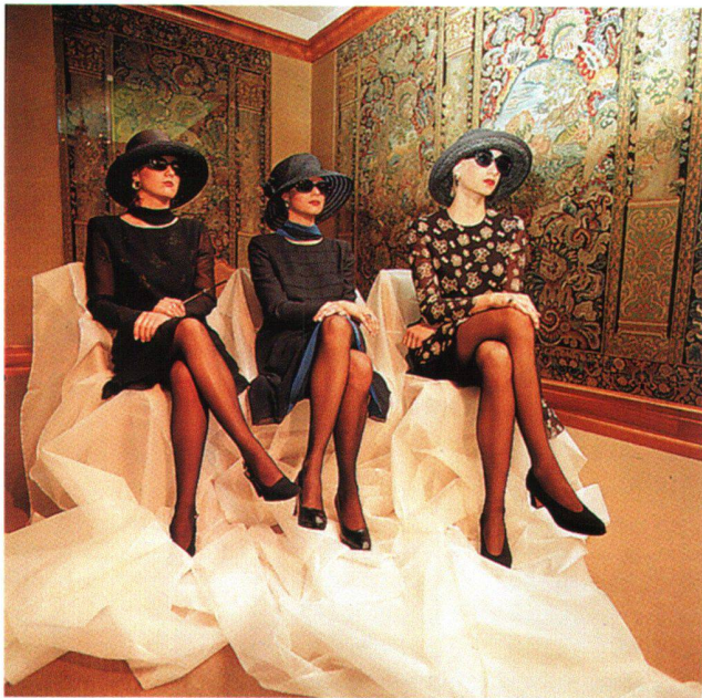
Abb. 4 Event «Parcours de la Mode», Modeschau von Grieder im Rahmen der Sonderausstellung «Modedesign Schweiz 1972–1997», Sonderausstellung Frühjahr/Sommer 1997.

Für das Neue Landesmuseum wird ein zentraler Punkt der Besucherbindung die optimale Ausschöpfung des vorhandenen materiellen und immateriellen Potentials sein. «Dementsprechend stellt jeder Punkt, an dem der Besucher in Kontakt mit dem Museum tritt («Besucherkontaktpunkt»), eine wichtige, nicht repetierbare Möglichkeit für ein Haus dar, sich beim Besucher als «exzellenter Dienstleister» zu präsentieren.» 7 Erreicht werden kann dieses Ziel mit einer geeigneten Verortung von Gastronomie und Shop, mit einer entsprechenden Schulung des Personals, mit Förderung des Dienstleistungsbewusstseins und mit einer verstärkten Wahrnehmung des Besuchers als Kunden.