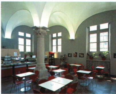
Abb. 1 Cafeteria. Aufnahme 2003.

Dank seiner Architektur und den vielfältigen Nutzungsmöglichkeiten des Hofes – Mittagspause, Raum und Platz für Kinder, Kulisse für Erinnerungsfotos – ist das Landesmuseum schon von seiner äusseren Erscheinung her für