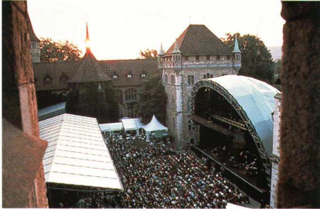
Abb. 6 «Live at Sunset», jährliche Sommerkonzerte im Hof. Aufnahme 1999.

Hier kann an die oben gestellte Frage nach der zu verfolgenden Strategie bei Auswahl und Durchführung von