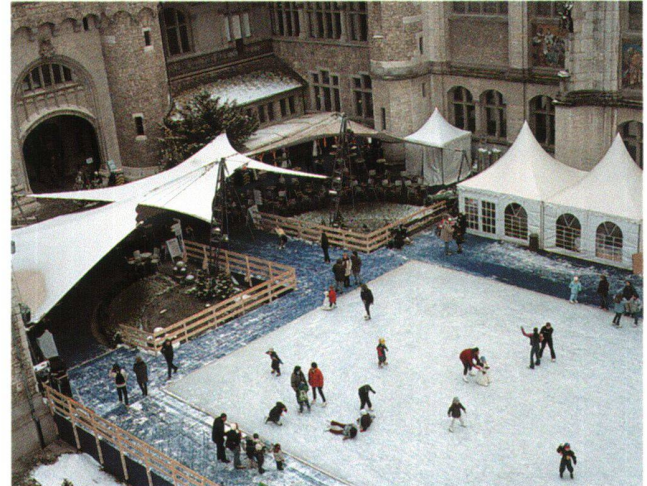
Abb. 7 «Live on Ice», Eisbahn und winterliches Gastronomieangebot im Hof. Aufnahme 2002.

dene – Gewinnziel als ein relevantes Abgrenzungskriterium gegenüber anderen Organisationen erklärt. 10 So ist doch im Landesmuseum in und mit den Teilbereichen Gastronomie, Vermietungen und Museumsshop das Streben nach zusätzlichen Einnahmen vorhanden, um den Eigenfinanzierungsgrad der Institution zu steigern. In wirtschaftlich angespannten Zeiten deckt sich das Tischlein nicht mehr (nur) von allein, sondern das Museum tut gut daran, Eigenmittel zu erwirtschaften. 11