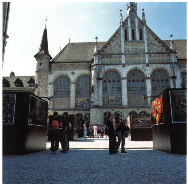
Abb. 5 Der Hof kann auch für Sonderausstellung genutzt werden, wie etwa im Sommer 2001 die Fotoausstellung von Yann Arthus-Bertrand «Die Erde von oben». Im Hintergrund die Ruhmeshalle.

Zur Zeit ist die Nachfrage nach Veranstaltungsmöglichkeiten, Raumvermietungen und Hofnutzungen (Abb. 5) um ein Mehrfaches höher als mit den vorhandenen räumli-