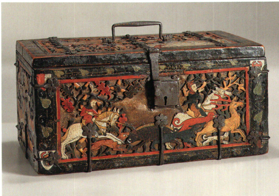
Fig. 14 Caissette sculptée, vers 1320, avec scènes courtoises et chevaleresques. Bois de noyer. Zurich, Musée national suisse, IN 6957.4.

dans l'accord de 1903, elle place, par ordre décroissant, des pièces d'orfèvrerie (fig. 7) chiffrées à 97 800 francs, des vitraux (fig. 8) à 66 500 francs, des armes (fig. 9) à 22 800 francs, des gobelins, broderies à 19 800 francs, des caissettes à 19 000 francs, du mobilier (fig. 10) à 15 400 francs, des tableaux à 3 200 francs, des portraits à 2 500 francs, des