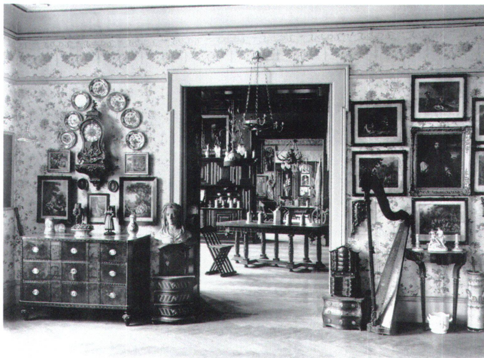
Fig. 5 Intérieur de la propriété d'Heinrich Angst à Regensburg, photographe anonyme, vers 1918. Zurich, Musée national suisse, LM 89783.2.

société helvétique dans son ensemble. Elles documentent en fait essentiellement les us et coutumes de couches dirigeantes et parfois de paysans cossus. Le musée reste en revanche totalement silencieux sur les petites gens, l'industrialisation ou la ville dans ses aspects urbanistiques et sociaux. De même, les conflits qui divisèrent la Suisse – Réforme, Guerre des paysans, Sonderbund – ne sont pas mentionnés. Le musée possède bien une importante collec-