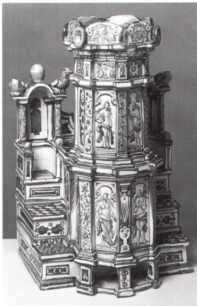
Fig. 13 Modèle d'un poêle, Winterthour 1642. Fayence peinte. Zurich, Musée national suisse, HA 3049.

francs est en effet jugé fort modeste, comme en témoigne le préavis de la Commission du Musée national suisse adressé au Conseil fédéral en 1903: «M. le directeur Heinrich Angst étant universellement connu des amis des arts, comme l'un des plus fins connaisseurs et des meilleurs collectionneurs d'antiquités, il est hors de doute qu'une vente publique de