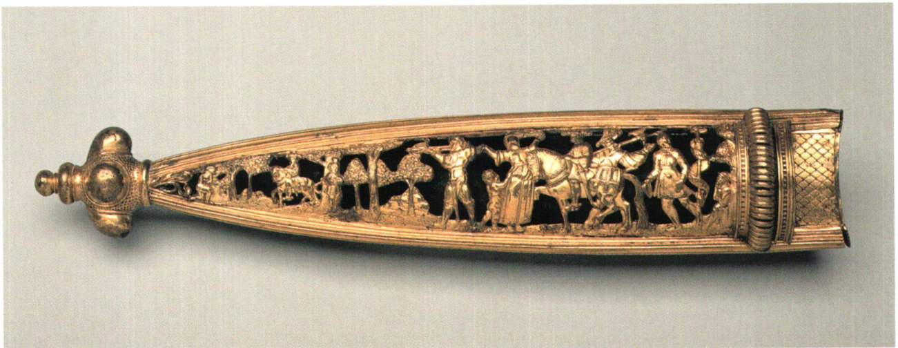
Fig. 9 Fourreau de dague suisse, daté 1567, avec scènes de l'histoire de Guillaume Tell. Laiton doré. Zurich, Musée national suisse, IN 6971.