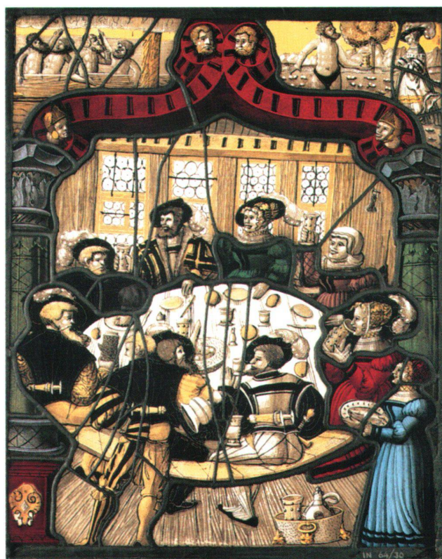
Fig. 4 Vitrail avec scène de table, par Ulrich Ban, Zurich vers 1540. Zurich, Musée national suisse, IN 6430.

tème politique et esprit des anciens Suisses. Si les intérieurs anciens jouissent d'une prééminence affirmée eu égard à la valeur artistique et historique qui leur est donnée, le poids qu'ils représentent dans les achats du musée découle également des besoins liés au programme d'exposition. De 1890 à 1898, la politique d'acquisition du Musée national suisse est en effet en grande partie orientée vers l'aménagement des salles d'exposition. Fait significatif, le programme