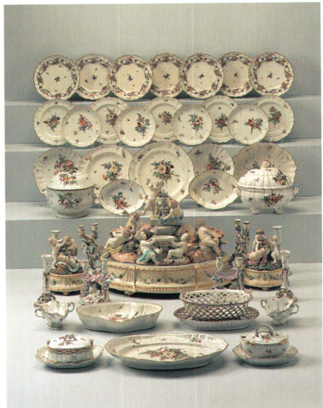
Fig. 12 Service de table d'Einsiedeln, Kilchberg-Schooren ZH 1775. Porcelaine peinte. Zurich, Musée national suisse, HA 91.