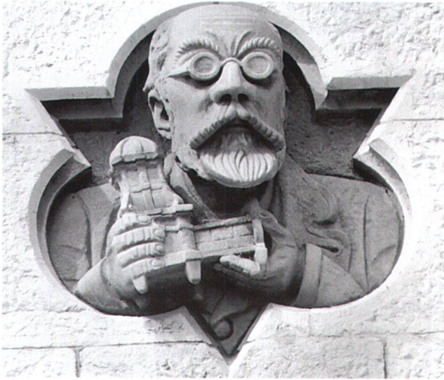
Fig. 15 Heinrich Angst, portrait en buste, par Richard Kissling, 1897/98. Sculpture sur la façade de la salle des armes du Musée national suisse, côté gare. Heinrich Angst tient dans ses mains un poêle en miniature qui rappelle sa passion pour la céramique et son activité de collectionneur. Zurich, Musée national suisse.

d'épées à 11 000 francs, une collection de carreaux de poêle du XV e au XVIII e siècles à 10 000 francs, une collection d'uniformes et de pièces de costumes à 6 207 francs, une collection de porcelaines de Zurich à 4 605 francs, des drapeaux à 2 300 francs, des modèles de carreaux de poêle à 2 000 francs, les 33 888 francs restants se divisant entre des groupes d'objets divers, tous taxés à moins de 2 000 francs. Ces chiffres montrent avec clarté la place centrale occupée par la céramique dans la vente de 1903. Sa valeur est fixée à près de 200 000 francs, soit grosso modo 1,9 million de nos francs actuels, sur un montant total de 500 000 francs. Si l'on se souvient qu'à la fin des années 1870 encore, la céramique ancienne était peu prisée en Suisse, on mesure le chemin qu'a parcouru Heinrich Angst (fig. 15) pour en rehausser le statut. Loin d'être fortuite, la transaction conclue en 1903 apparaît comme l'aboutissement d'une démarche volontaire visant à influencer sur la valeur de l'art ancien et à faire d'une collection particulière un instrument décisif de la politique muséale.