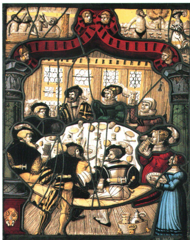
Fig. 4 Vitrail avec scène de table, par Ulrich Ban, Zurich vers 1540. Zurich, Musée national suisse, IN 6430.

tème politique et esprit des anciens Suisses. Si les intérieurs anciens jouissent d'une prééminence affirmée eu égard à la valeur artistique et historique qui leur est donnée, le poids qu'ils représentent dans les achats du musée découle également des besoins liés au programme d'exposition. De 1890 à 1898, la politique d'acquisition du Musée national suisse est en effet en grande partie orientée vers l'aménagement des salles d'exposition. Fait significatif, le programme