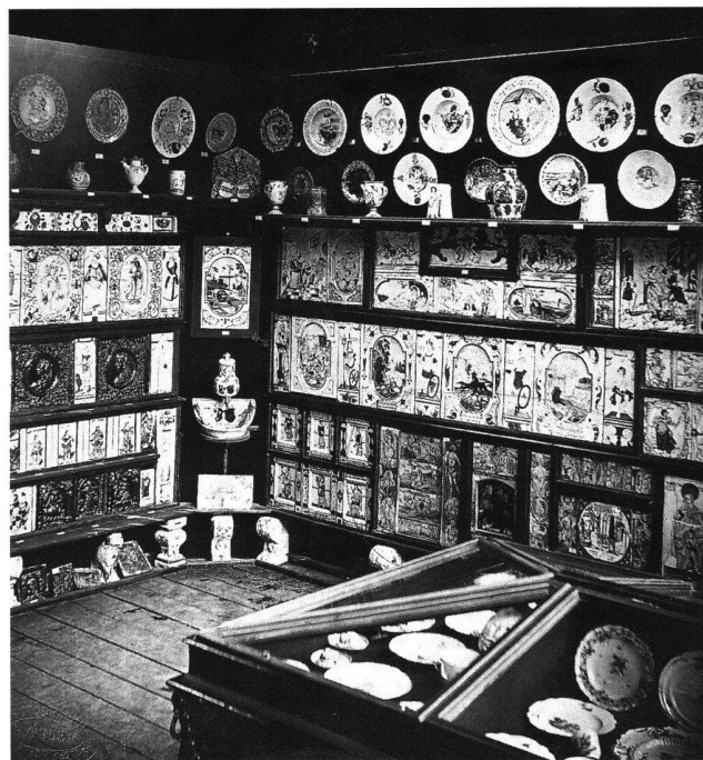
Fig. 2 Exposition nationale à Zurich, 1883. Section céramique du groupe «Art ancien». Zurich, Musée national suisse, LM 82278.

Un an plus tard, Heinrich Angst abandonne la carrière textile et s'engage aux côtés de Salomon Vögelin dans le combat pour la création du Musée national suisse. Le 24 février 1888, il publie dans la Neue Zürcher Zeitung un article intitulé «Zürich und das schweizerische Nationalmuseum», vibrant plaidoyer en faveur de la création d'un