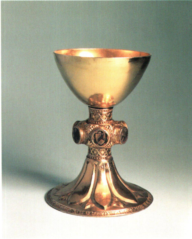
Fig. 7 Calice de Pfäfers, donation de Konrad von Wolfurt au couvent des Bénédictins de Pfäfers SG, 1364. Argent doré. Zurich, Musée national suisse, IN 7011.