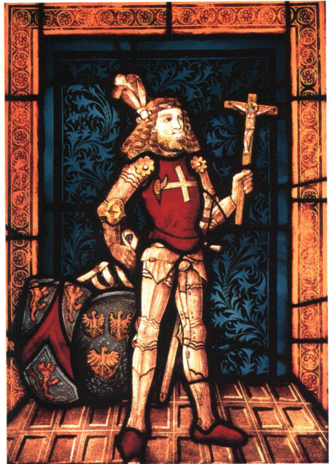
Fig. 8 Vitrail aux armoiries des familles de Chevron et Tavelli, fin du XV e siècle; provenant de l'église de Vercorin VS. Zurich, Musée national suisse, IN 6800.