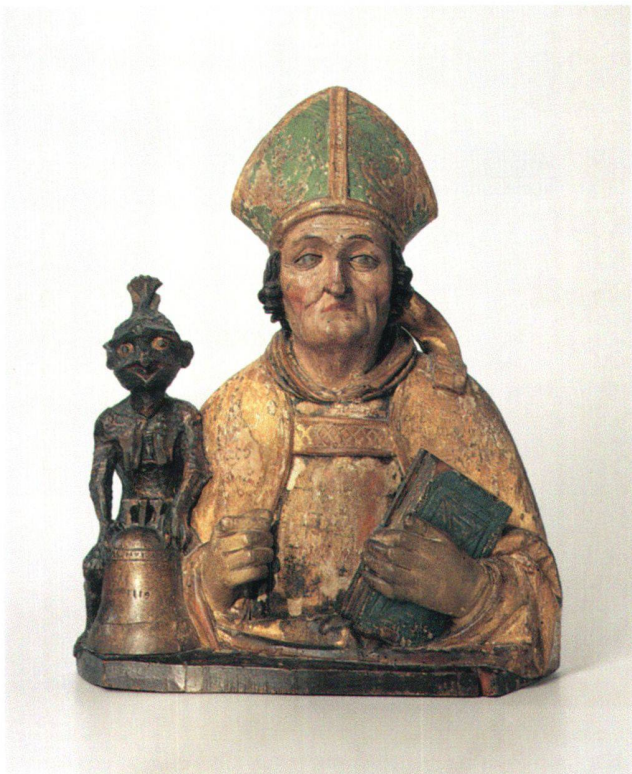
Fig. 11 Buste de St. Théodul, daté 1519, provenant probablement du Goms VS. Zurich, Musée national suisse, IN 7046.