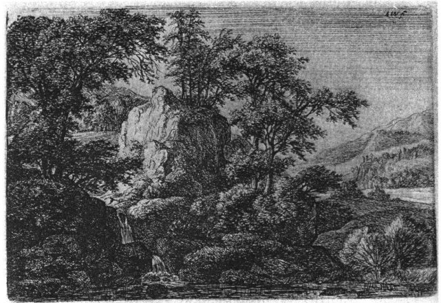
Abb. 10 Die Doppelkaskade, von Anthonie Waterloo (1609–1690). Radierung. Illustrated Bartsch , 2, 2, Nr. 71.

auch von Salomon Gessner empfohlenen und für seine Baumlanschaften berühmten Niederländers Anthonie Waterloo (1609–1690): So steckt zum Beispiel hinter Büchels «Flusslandschaft mit Wasserfall über Felstreppen links» (Abb. 9) Antoni Waterloo's Radierung «Die Doppel-Kaskade» (Abb. 10). 16 Wie alle seine Nachzeichnungen nach Waterloo ist dieses Blatt offensichtlich rasch entstanden und von Büchel weder signiert noch datiert. Die so feinteilige und reich differenzierte Landschaftsschilderung Waterloos ist ziemlich grob vereinfacht und auf das hauptsächliche Inventar reduziert: Baumgruppen, Felserhebung in der Mitte, Wasserfall und Hauptlinien des Hintergrunds.