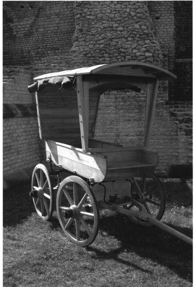
Abb. 4 Augster Reisewagen, Rekonstruktion.

ohne die Stellmacher. Allerdings war ein mit Metallteilen versehener Wagen stabiler und je nach Gestaltung repräsentativer. In Feddersen Wierde existierten im 2. Jahrhundert n. Chr. zwei Werkstätten für Speichen- und Scheibenräder in der Nähe einer Schmiede. In den vici des Rhein-Maas-Gebietes waren die Handwerkszweige neben-