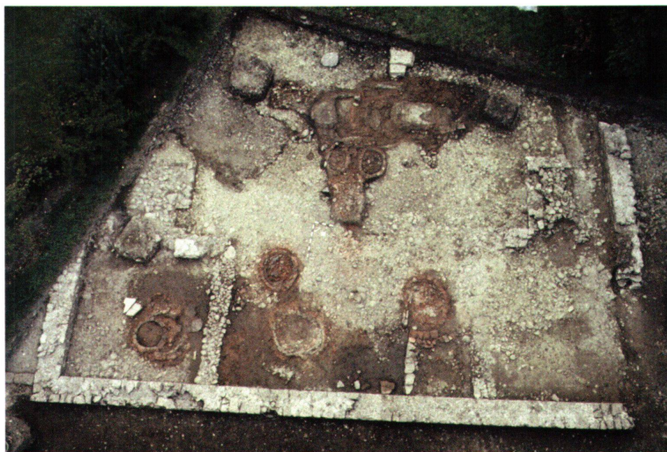
Abb. 1 Übersichtsfoto über Werkstatt 1 mit den verschiedenförmigen Überresten der Glasöfen.

1974 und 1978 kamen bei zwei Ausgrabungen am Rande der römischen Koloniestadt Augusta Raurica (heute Kaiser-augst/AG, Schweiz) römische Glaswerkstätten zum Vorschein. 1 In zwei Gebäuden, die links und rechts einer römischen Strasse lagen, konnte je eine Werkhalle mit Ofenstrukturen nachgewiesen werden. Aufgrund der zahlreichen Ofenüberreste mit teilweise anhaftenden Glasresten sowie der unzähligen Funde von Glashäfen kann die Glasverarbeitung in beiden Gebäuden als gesichert gelten. Die Lage der Glasateliers innerhalb der Siedlung zeichnet sich durch die Randlage innerhalb der so genannten Unterstadt und die Nähe zu den beiden Fliessgewässern Ergolz und Rhein aus. Die Wahl des Standortes dürfte auch wegen des postulierten nahegelegenen Hafens und der verkehrsgünstigen Situation in der Nähe von Überlandstrassen erfolgt sein, wodurch die Versorgung mit Brennstoffen und anderen Materialien gewährleistet war.