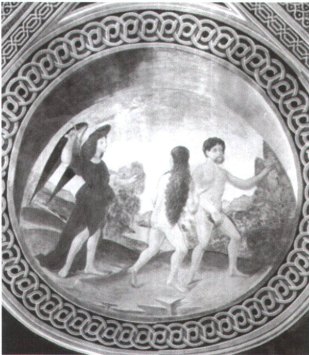
Fig. 2 Cacciata dal Paradiso, autore ignoto, 1500 circa. Affresco della volta della cappella maggiore, 6 x 3 m circa. Morcote, chiesa parrocchiale di Santa Maria del Sasso.