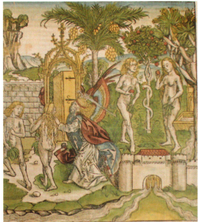
Fig. 3 Peccato originale, Cacciata dal Paradiso, di Michael Wohlgemut, datata 1493. Incisione tratta dalla Weltchronik 1493 di Hartmann Schedel (Blatt VII).

desco. La data di pubblicazione della Weltchronik vale come post quem per la decorazione della volta, che si può immaginare affrescata nel corso del primo quinquennio del Cinquecento, quando l'influsso di Leonardo da Vinci in ambito milanese era ormai consolidato. 6