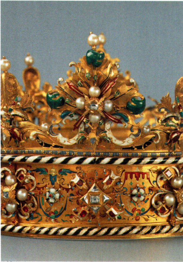
Abb. 10 «Polnische Krone», grosse Lilie und Kronreif.