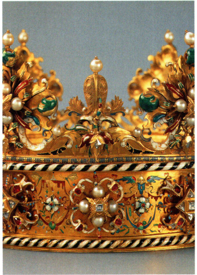
Abb. 12 «Polnische Krone», kleine Lilie und Kronreif.