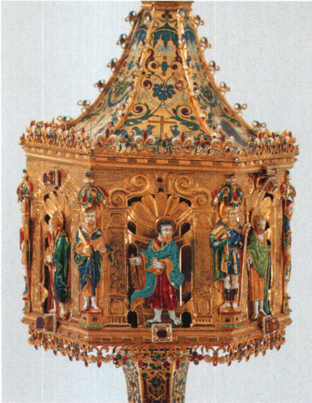
Abb. 27 Ziborium, Kupa. Simon flankiert von Bartholomäus und Thomas.

Die zweite Baldachinfigur stellt Bartholomäus dar (Abb. 26/27). Er hält in der Rechten das Messer, mit dem ihm bei seinem Martyrium die Haut abgezogen wurde,