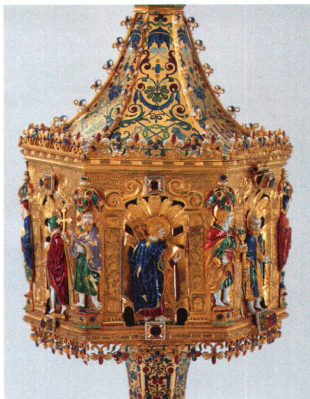
Abb. 30 Ziborium, Kupa. Jakobus d.J. flankiert von Philippus und Johannes Ev.

Die letzte Figur stellt den jugendlichen Johannes, den Evangelisten, dar (Abb. 30/25). Dieser wendet sich Petrus zu und hält in seiner Linken den Kelch, aus dem eine Schlange hervor züngelt. In der gesenkten Linken hält er ein Buch. Er rafft zwar damit den sonst rot emaillierten Mantel hoch, so dass fast nur das goldene Unterfutter zu sehen ist, doch bleibt seine rechte Seite formal im Umriss geschlossen, während seine offene linke Seite bewegt gestaltet ist. Er steht auf grünem Boden.