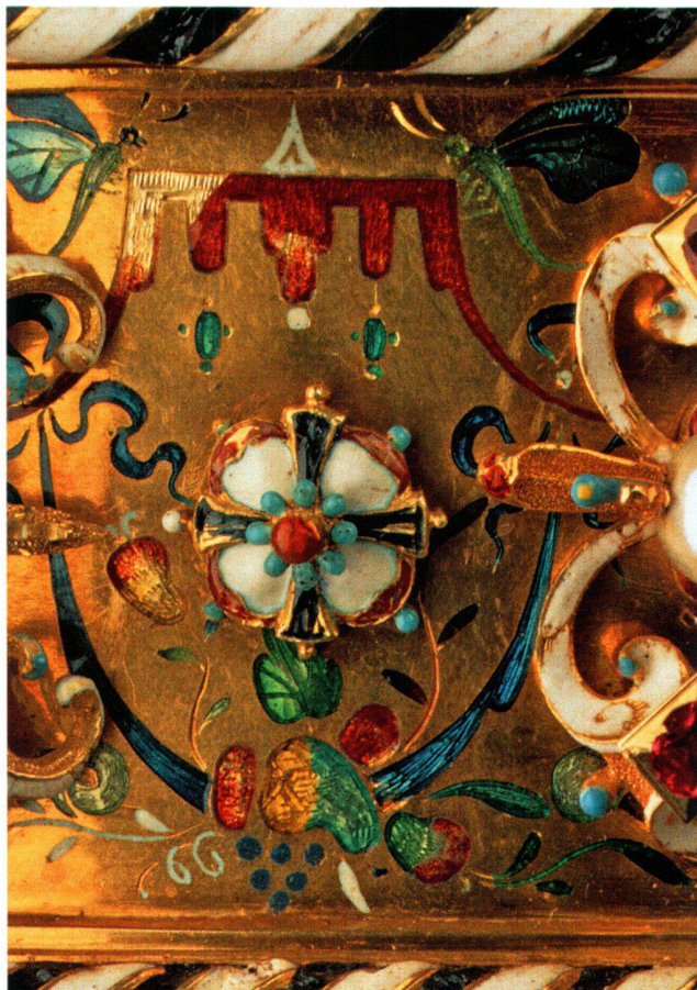
Abb. 14 «Polnische Krone», Rosette mit Deutschordenskreuz inmitten von Baldachin mit Libellen und Fruchtgehänge in Tiefschnittemail.

Die glatte Innenseite des Kronreifs ist undekoriert und trägt unten in zwei Zeilen die Inschrift mit der Jahrzahl 1596 (Abb. 8/9). Am oberen Rand ist der aufgesetzte Reif