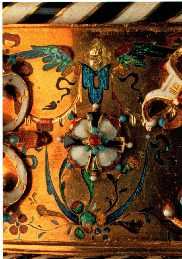
Abb. 15 «Polnische Krone», Rosette mit Deutschordenskreuz inmitten von geflügeltem Engelskopf und Fruchtgehänge in Tiefschnittemail.

Ende sich keulenförmig mit rotem Email aufwölbt und an deren Anfang bei den Perlen kleine Früchte liegen, nimmt die Richtung der obersten Schicht wieder auf. Zwischen den Schmuckappliken bilden vierpassförmige, rot geränderte und von einem schwarzen Kreuz geviertelte Knöpfe oder Rosetten ein weiteres kleines Zentrum, um das sich die Tiefschnittemails gruppieren. Unter diesen Knöpfen liegen Fruchtgehänge, darüber wechseln sich baldachinartige