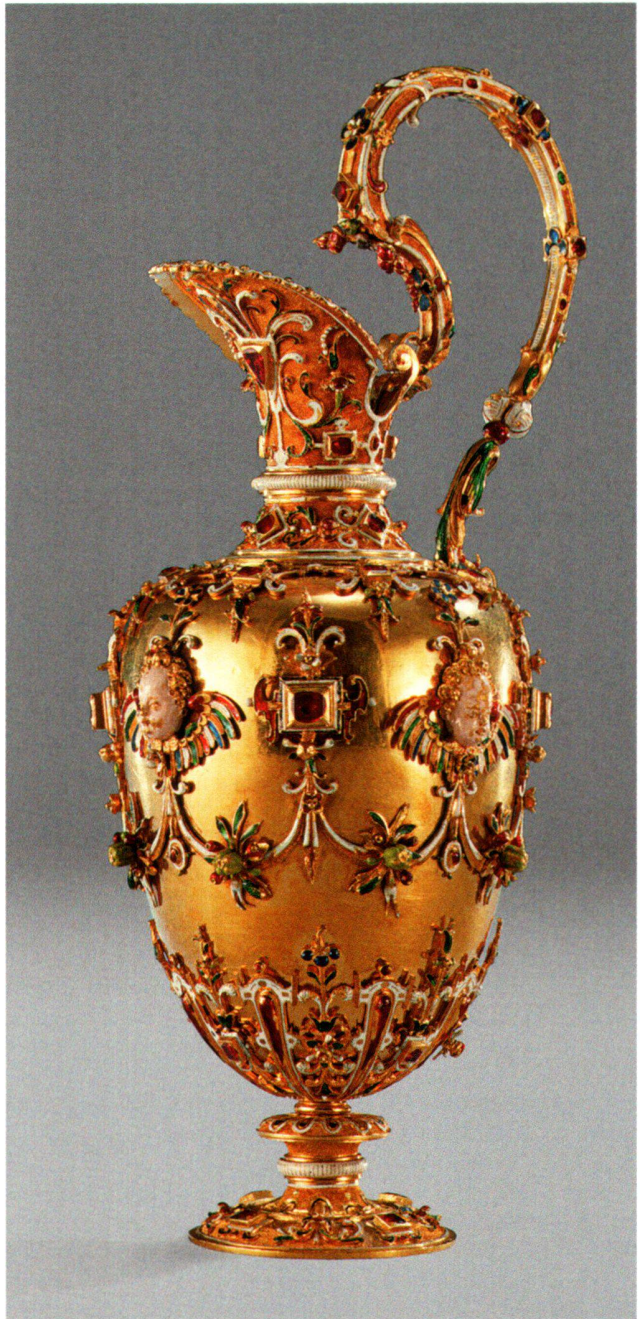
Abb. 18 Taufkännchen, Gold, Email, Rubine, Jan Vermeyen zugeschrieben, Prag Anfang 17. Jahrhundert. H. 15,5 cm. Wien, Kunsthistorisches Museum, Weltliche Schatzkammer.

ten mit der entsprechenden Blattfassung (Abb. 17). Weitere Charakteristika dieser Werkstatt, die an der Krone wie am Zepter sichtbar werden, sind die sich an den Enden kugelig einrollenden und die Emailfarben wechselnden Blätter, die sich spaltenden Volutenenden, Perlstäbe, die