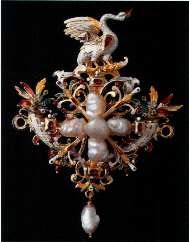
Abb. 19 Glied einer Orpheuskette, Werkstatt des Andreas Osenbruck, Prag, um 1615. Prag, Domschatz.

Glieder einer Kette, welche das Motiv von Orpheus und den Tieren zum Thema hatte. 28 Wie auf dem Kronreif wechseln auch bei der Monstranz zwei Typen einander ab. Sieben Stücke, auf denen Säugetiere liegen, sind ebenso gleich gestaltet, wie acht Stücke, auf denen verschiedene Vögel (einer verloren) auf Zweigen stehen (Abb. 19 und 20). Das Juwel mit der Darstellung von Orpheus ist gleich