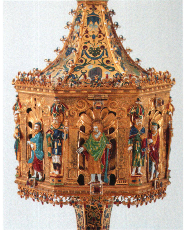
Abb. 28 Ziborium, Kupa. Judas Thaddäus flankiert von Thomas und Matthias.

Credo. Sein Attribut, das an seiner linken Schulter lehnt, ist der unten spitz zulaufende Wollbogen, der im Spätmittelalter meist die Walkerstange ersetzt. Die Figur trägt einen dunkelblauen Mantel und ein rotes Untergewand und steht auf grünem Boden.