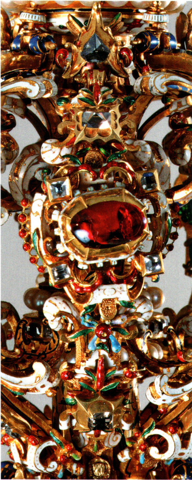
Abb. 17 Rubinspange der Zepterblume vom Zepter des Kaisers Matthias.