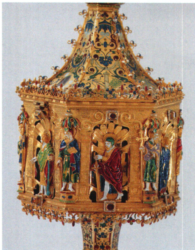
Abb. 29 Ziborium, Kupa. Matthäus flankiert von Matthias und Philippus.

Die vierte Eckfigur versucht eine Ponderation im Standmotiv, wobei ihre rechte Seite die offene mit dem Spielbein ist. Es handelt sich um Matthias, der sich mit der gesenkten Rechten auf das Beil stützt, mit dem er enthauptet wurde (Abb. 28/29). Mit der verdeckten Linken hält er ein Buch. Die Gestaltung der Draperie unterstützt die Ponderation, indem der dunkelblaue Mantel mit roten Überschlägen vorwiegend die linke Hälfte der Figur bedeckt und die rechte offen lässt. Matthias trägt eine rote Haube. Am