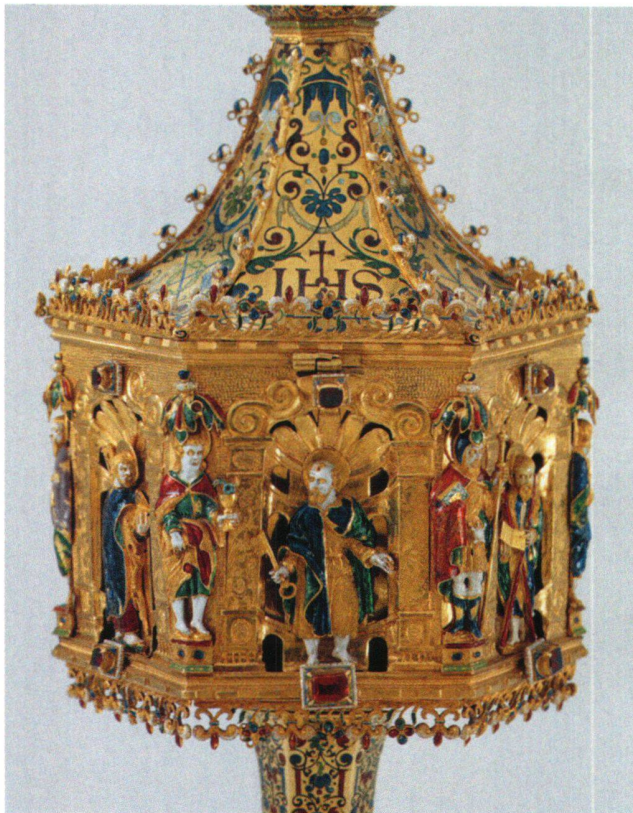
Abb. 25 Ziborium, Kuppa. Petrus flankiert von Johannes Ev. und Jakobus d. Ä.

Die nächste Nische beherbergt Judas Thaddäus (Abb. 28), der sich durch die Keule in seiner Linken zu erkennen gibt. Er steht in nur angedeuteter Ponderation fast frontal und wendet den Kopf nach links. Sein rechter Arm ist in