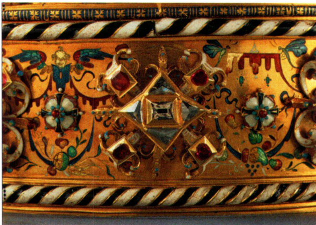
Abb. 11 «Polnische Krone», Kronreif mit Schmuckrosette unterhalb der grossen Lilie.