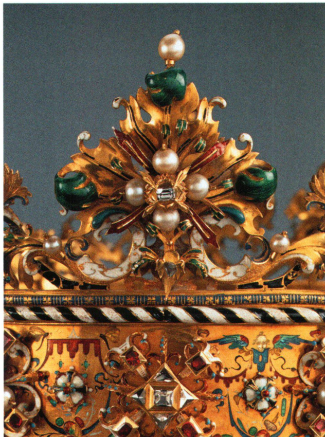
Abb. 6 «Polnische Krone», grosse Lilie.

dings der Dorn, mit dem man das Kreuz im Köcher auf der Rückseite der Stirnlilie befestigen konnte. Das Kreuz ist heute verloren.