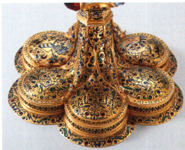
Abb. 24 Ziborium, Rückseite Fuss.

Die Oberseite des Fusses zieren sechs flache Buckel, die alle verschieden dekoriert sind. Um sie herum läuft wiederum ein gerippter Stab (Draht), der sich in elegantem Schwung hochzieht, sich in der Mitte des Schaftanlaufes berührt, um sich dann wieder zu den Ecken der Profilleiste hin zu öffnen. Dadurch erhalten die Buckel eine tropfenförmige Form, welche an die Nürnberger Prunkpokale der Dürerzeit erinnert. In den vorderen drei Buckeln liegen in Tiefstichemail gearbeitete Wappen, die hinteren Buckel sowie die Flächen des Schaftanlaufes zieren Ranken. Vor den Buckeln verläuft im flachen Rücksprung über der Zarge ein Inschriftenband um den ganzen Fuss herum. Der Text, in schöner Antiqua graviert, beim mittleren der drei mit Wappen besetzten Buckeln beginnend, lautet: «AVE DECVS ANGELICVM / JESV DVLCE TV CANTICVM / TV NECTAR OLYMPIACVM / IN ORE MEL MIRI-