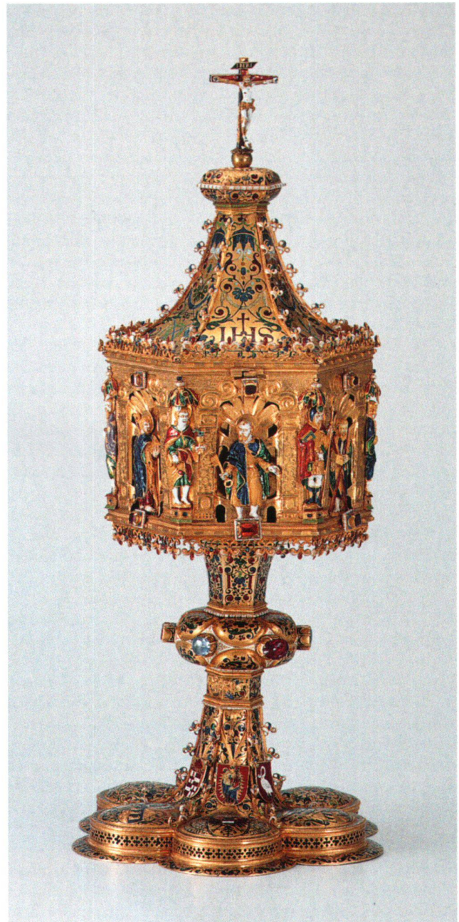
Abb. 22 Ziborium, Gold, Email, Edelsteine, Nikolaus Wickart, Zug 1592. Kloster Einsiedeln.

Den konvexen Standring des Fusses zieren Volutenranken, welche achsialsymmetrisch angeordnet sind und sich in jedem der sechs Pässe exakt wiederholen. Im Scheitelpunkt liegt jeweils ein geometrisches Motiv, bestehend aus einem Mönchchen mit waagrechtem Querbalken, dessen Enden sich abwinkeln. Dieses Motiv hält die Ranken wie eine Klammer zusammen. Eine gerippte Rundleiste leitet zur Zarge über und findet eine verdoppelte Entsprechung im Profil über der Zarge. In dieser bilden kleine balkenleichte