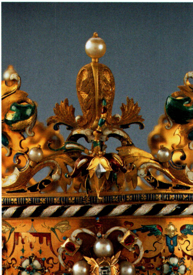
Abb. 7 «Polnische Krone», kleine Lilie.

wesentlich höheres Gewicht für die Krone, als diese mit ihren 1130 g im aktuellen Zustand aufweist. 19 In diesem Zusammenhang stellen sich zwei Fragen: Erstens, wo wurde diese Goldarbeit von beträchtlichem Umfang durchgeführt? Und zweitens: Ist die Verkleinerung des Umfangs an der erhaltenen Krone von Einsiedeln zu erkennen? Vor-