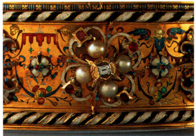
Abb. 13 «Polnische Krone», Kronreif mit Schmuckrosette unterhalb der kleinen Lilie.