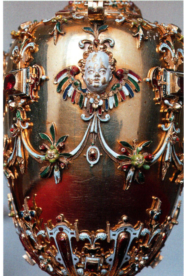
Abb. 21 Taufkännchen, Ausschnitt mit geflügeltem Engelskopf und Fruchtgehänge.

Durch die Umarbeitung wurde die Krone für ein menschliches Haupt unbrauchbar und in ihrer Funktion zu einer Votivkrone verwandelt. Als Votivkrone bedurfte sie nun keiner inneren Haube mehr, die bei anderen Kronen meist aus rotem Samt besteht, und deshalb fehlen auch Vorkehrungen für die Befestigung einer solchen Haube. Trotz dieser Funktionsänderung behielt die Krone aber ihre hohe politische Symbolik, wie im Folgenden dargelegt wird.