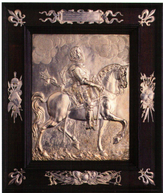
Abb. 1 Hochmeister Erzherzog Maximilian III., von Jan de Vos, Augsburg um 1600, nach Hubert Gerhard, Silberrelief getrieben, 16,5 × 13 cm, originaler Rahmen mit Waffentrophäen und Inschrift 25 × 21,5 cm. Wien, Schatzkammer und Museum des Deutschen Ordens.

Am Anfang dieser Periode stand eine Wallfahrt nach Einsiedeln im Jahr 1590, bei der Maximilian an die 300 Kronen Gold widmete, die vermutlich für das unten angeführte Ziborium verwendet wurden. Während der Statthalterschaft für den minderjährigen Erzherzog Ferdinand von Innerösterreich 1593–1595 führte er 1594 einen Feldzug