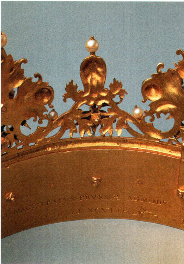
Abb. 8 «Polnische Krone», Innenseite des Kronreifs.