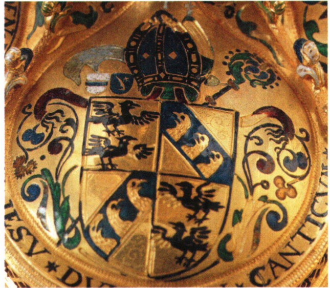
Abb. 31 Ziborium, Ausschnitt Fuss mit emailierter Ortsmarke Zug (weisser Schild mit blauem Balken) und Meistermarke Wickart (Sensenblatt und Stern auf blauem Grund) links über dem Wappenschild des Abtes Ulrich Wittwiler.

Edelsteine und Macherlohn dürften aus dem Klostergut bestritten worden sein. 67 Einsiedler Äbte treten, abgesehen von Heinrich von Brandis (Abt 1348–1357), im Gutthäterbuch nicht als Stifter auf, und eine Stiftung des Nuntius, Bischof Ottavio Paravicini, wäre wohl vermerkt worden.