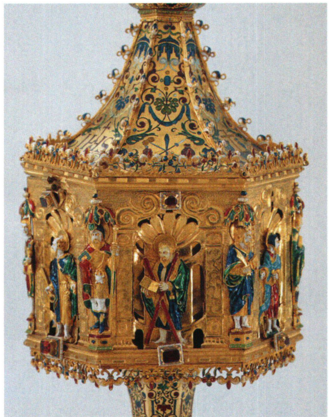
Abb. 26 Ziborium, Kuppa. Andreas flankiert von Jakobus d. Ä. und Bartholomäus.

Betrachter aus) und ist durch ein grosses rotes Andreaskreuz vor seinem Körper gekennzeichnet. Er hält dem Betrachter ein offenes Buch entgegen, auf dessen Text er mit dem Zeigefinger der Linken hinweist. In den Seiten steht mit feiner Punze geschrieben: «ET INI/ESVM/CHRIS», ein Zitat aus dem Credo des Messtextes. Andreas trägt einen grünen Mantel mit goldenen Überschlägen und ein dunkelblaues Untergewand.