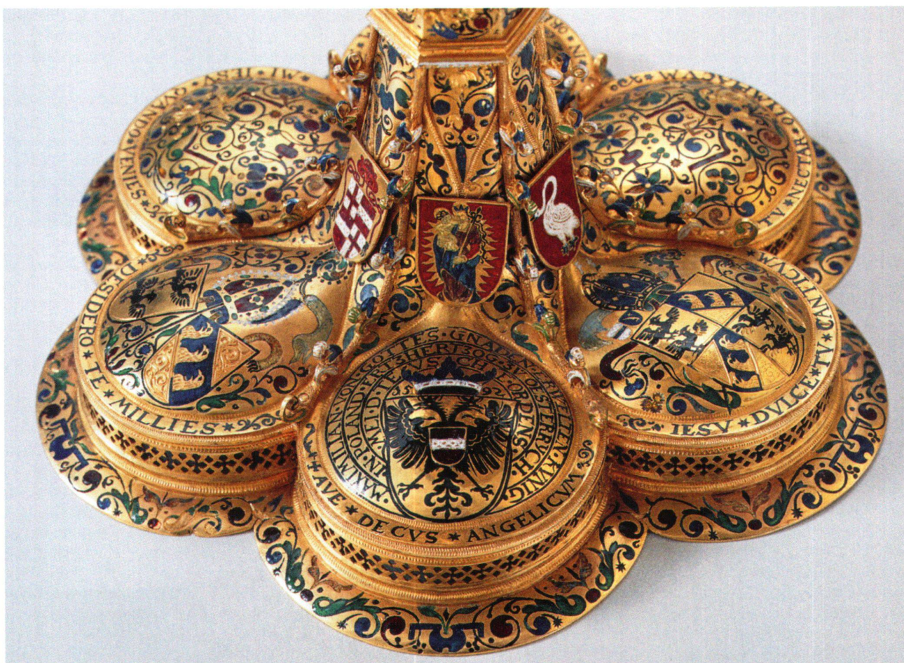
Abb. 23 Ziborium, Vorderseite Fuss mit Wappenschilden.

profil unter dem Nodus und an den Kanten des Deckels fein gepunztes Astwerk mit emaillierten Krabben (Abb. 23/24).