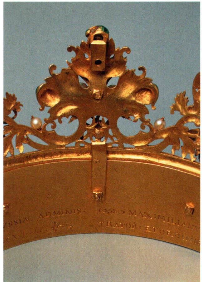
Abb. 9 «Polnische Krone», Innenseite des Kronreifs. An der Rückseite der Stirnlilie ist oben die Halterung für das Kreuz und unten der Steg sichtbar, mit dem Lilienkranz und Kronreif verbunden sind.

dass eine der Knospen weggebrochen und verloren ist und zwei beschädigt und auf der Rückseite mit Goldbändern geflickt beziehungsweise verstärkt sind. 21 Das Ornamentgeflecht ist so durchsichtig, dass die Schrauben für die Schmuckauflagen nur mit Hilfe einer rechteckigen Beilage auf der Innenseite der Krone befestigt werden können (Abb. 8). Die Stirnlilie erhielt nachträglich an der Spitze die Halterung für ein Stirnkreuz (Abb. 9). Auf der Vorderseite ist noch die Bohrung für die Schraube zu sehen, die das Kreuz im Köcher festmachen sollte. Das leider verloren gegangene Kreuz ist der Grund, weshalb diese Lilie keine Perle trägt.