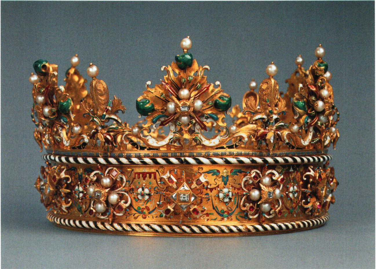
Abb. 2 «Polnische Krone». Kloster Einsiedeln.

Inscription an der Innenseite des Kronreifs (in zwei Zeilen): MAXIMILIANVS MAXIMILIANI II . IMPERATORIS FILIVS . ELECTVS IN REGEM POLONIAE . ARCHIDVX AVSTRIAE . DVX BVRGVNDIAE . STYRIAЕ . CARINTHIAE . CARNIOLAE . MAGNI MAGISTRATVS PRVSSIAE . ADMINIS=TRATOR . ET ORDINIS TEVTHONICI PER GERMANIAM . ET ITALIAМ MAGISTER . COMES HABESP: ET TYROLIS . RVDOLPHI II IMPER: FRATER . PER HVNGARIAM EXERCITVS GENERALIS . ANNO MDXCVI: