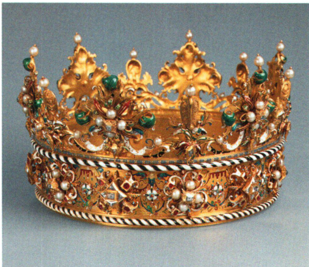
Abb. 5 «Polnische Krone». Kloster Einsiedeln.

Demnach wurde die Krone also umgearbeitet, und zurück kam nicht mehr die polnische Königskrone in ihrer ursprünglichen Form, sondern eine Krone für die Madonna von Einsiedeln mit Bezug auf den «König von Polen», denn für einen menschlichen Kopf ist ihr Umfang zu klein. Die Umgestaltung brachte eine Reduktion des Kronenumfan-