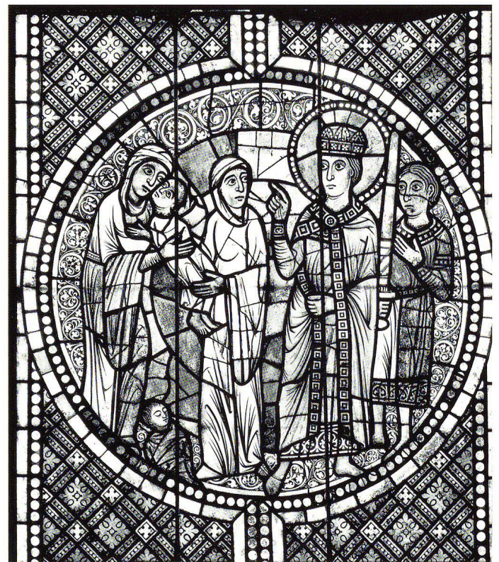
Abb. 6 Strassburger Münster, Nordquerschiff, östliches Lanzettfenster, Glasedaillon «Rückgabe des Kindes an seine Mutter durch Salomon», um 1180–1200. Die Gesichtszüge des Lüthold-Kopfes und des etwa zeitgleich angefertigten Kopfes des Salomon aus dem Glasfenster des Strassburger Münsters kommen sich sehr nahe – über die Kunstgattungen hinweg.

Fenster des Strassburger Münsters (um 1180–1200, Abb. 6) festzustellen 23 : Das Halbprofil, das lange, schmale, knochenlos wirkende Gesicht, der zu zwei Linien verkürzte Mund, die lange Nase, die als Kreis wiedergegebenen Nasenflügel, die weit aufgerissenen Augen, die schräg nach oben gerichteten Pupillen, das fast hervorquellende angeschnittene Auge finden sich in beiden Darstellungen. Bei den Strassburger spätromanischen Glasbildern wurde auf die Verwandtschaft mit der reich illuminierten Handschrift «Hortus deliciarum» der Herrad von Landsberg (verlorenes Original von 1176 bis circa 1196) hingewiesen. 24 Diese Handschrift dürfte auch in Basel bekannt