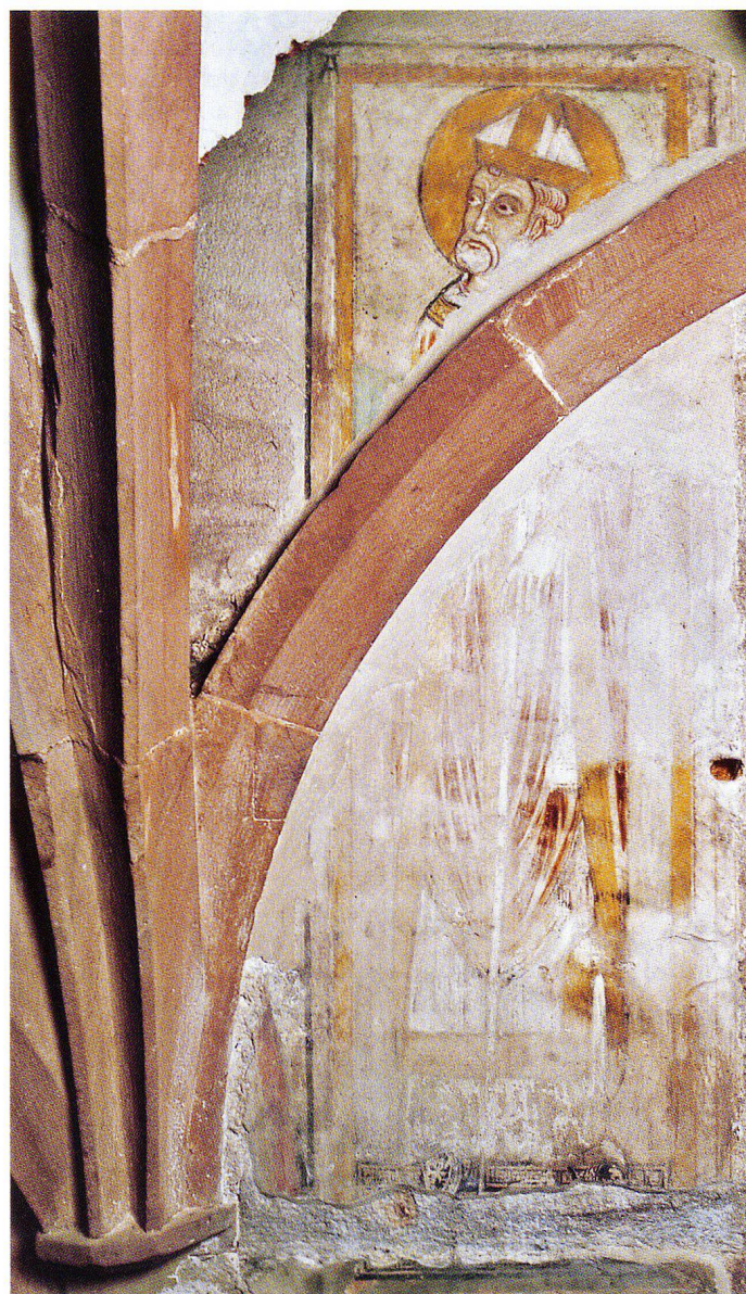
Abb. 3 Basler Münster, Ostkrypta, Bischof Adalbero II. In dessen Amtszeit wurde das frühromanische Münster errichtet. Zur Zeit der Freilegung des oberen Bildteils (1974) war der Figurenhintergrund noch blau.