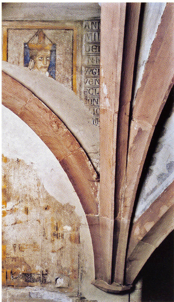
Abb. 2 Basler Münster, Ostkrypta, Bischof Lüthold von Aarburg. Er war der Stifter des Marienaltars in der Krypta. Dank der durchbrochenen Gewölbekappe und dem entnommenen Auffüllschutt sind seit 1974 die Kopfpartie des Bischofs und die anschließende Inschrift wieder sichtbar.

Die spätromanischen Wandbilder hingegen sind aufgrund ihres fragmentarischen Erhaltungszustandes weniger bekannt und stellen nebst den vorwiegend gotischen Wandmalereien des Münsters und weiteren entsprechenden Wandbildern in Basel eine Rarität dar. 1 Sie befinden sich im Umgang der Ostkrypta, genauer in der Mittelapsis und an deren seitlichen Stirnwänden (Abb. 1): Im unteren Teil der Apsiskonche sind nur noch wenige Fragmente der