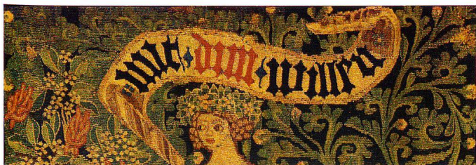
Abb. 4 «mit dim willen», ursprünglich seitenverkehrter Spruchbandtext auf einer Kissenplatte von 1440/50 (vgl. Anmerkung 6). Schweizerisches Nationalmuseum. (Abbildung seitenverkehrt)

Beim Versuch, den Text zu entziffern, ist von zweierlei auszugehen. Erstens: Es handelt sich um gotische Gitterschrift, wie sie seinerzeit auf gewirkten Bildern üblich war. Rundungen und Bögen werden dabei vermieden, womit sich ein gitterförmiges Schriftbild ergibt, bei dem die Unterschiede zwischen einzelnen Buchstaben oft minimal sind. Es ist häufig nicht einmal ohne Weiteres erkennbar, wie viele Buchstaben gemeint gewesen sind. Die Wörter im Text der Kissenplatte sind durch farbige Punkte voneinander getrennt, sodass wenigstens klar ist, wo das eine aufhört und das andere beginnt. Zum Vergleich zeigt Abbildung 4 die Buchstabenfolge mit dim willen auf einer