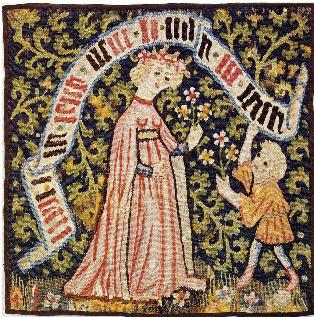
Abb. 1 Gewirkte Kissenplatte, Basel, um 1440/50, 55 × 54,5 cm. Museum für Kunst und Gewerbe Hamburg.

Eine gewirkte Kissenplatte, die vermutlich in der Mitte des 15. Jahrhunderts in Basel entstanden ist (Abb. 1), zeigt eine Frau und ein Kind, die einander zugewandt jeweils einen Blütenzweig in der Hand halten. Der schwarze Hintergrund ist mit hellfarbenen Akanthusranken durchzogen. Über den Figuren schwebt ein Spruchband, von dem Anna Rapp Buri und Monika Stucky-Schürer meinen: «Seine Schriftzeichen sind nicht entzifferbar; die abwech-