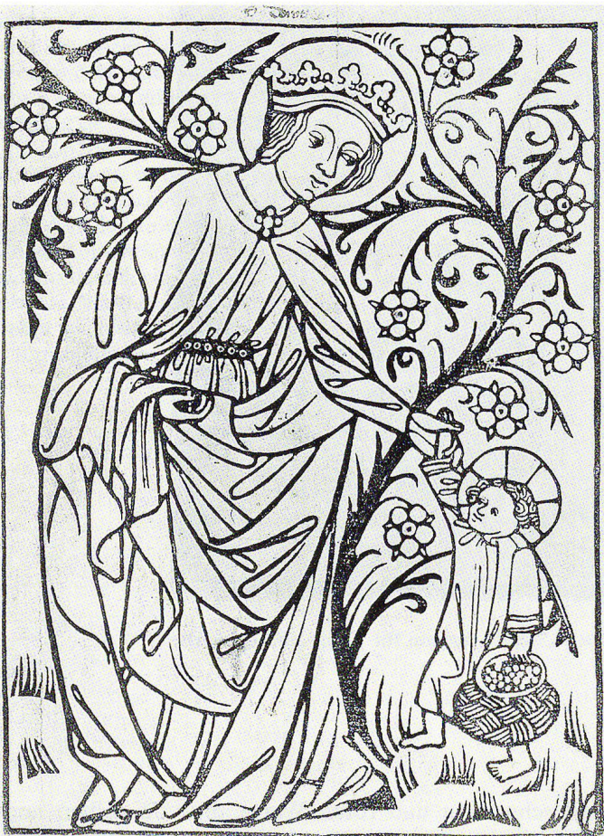
Abb. 2 Heilige Dorothea, Holzschnitt aus einer Handschrift aus St. Zeno bei Reichenhall von 1410, aus: Brockhaus Enzyklopädie, Bd. 8, Wiesbaden 1969, S. 642.