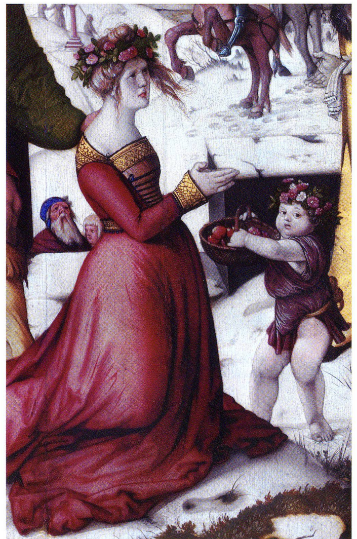
Abb. 3 Ausschnitt aus Hans Baldung Griens Enthauptung der heiligen Dorothea, 1516. Prag, Národní Galerie.