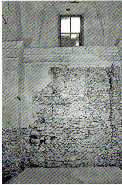
Fig. 6: Dettaglio interno dell'antico narcece con una delle spolie a motivo intrecciato.