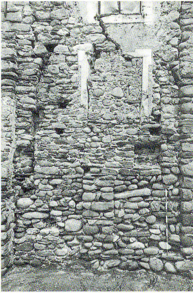
Fig. 5: Dettaglio esterno dell'antico narcece, con le aperture laterali.