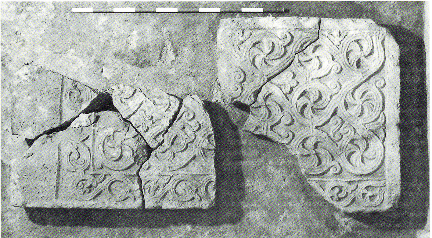
Fig. 8: Le lastre decorate al momento del ritrovamento.