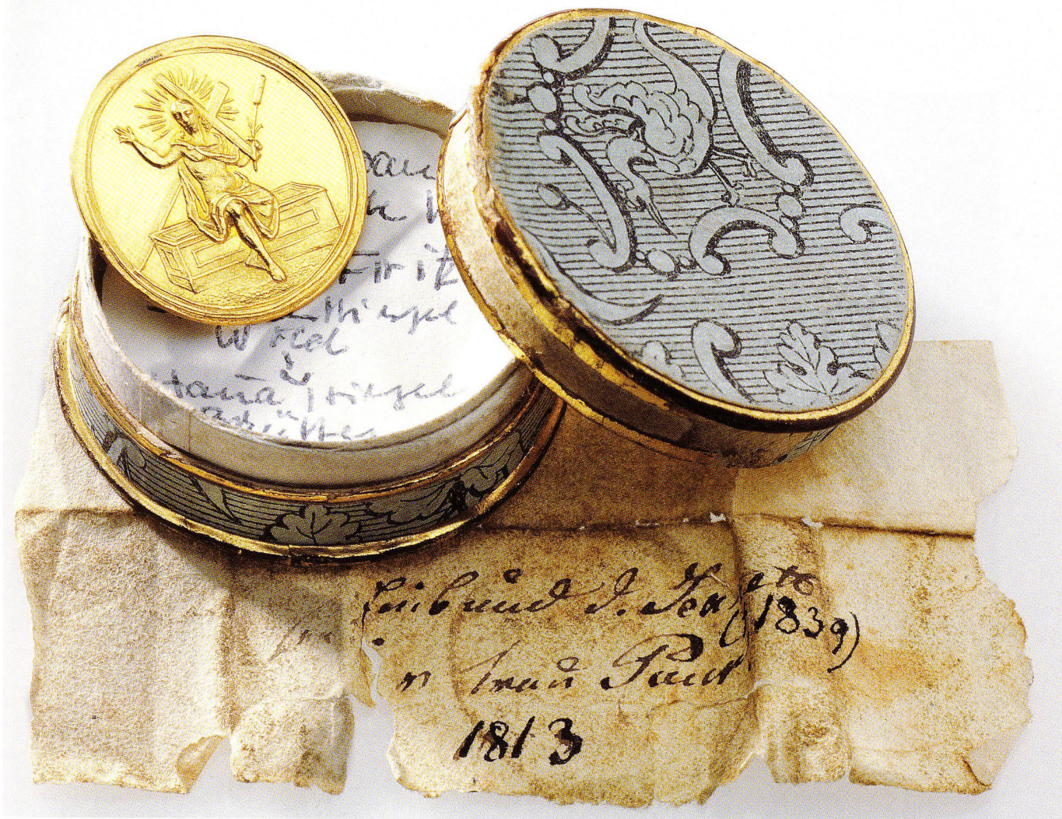
Abb.3 Taufpfennig. Vorderseite mit Jesus als Auferstandener. Deutschland (?), um 1800. Gold, Gewicht: 3,37 g, Durchmesser: 2,2 cm. Schweizerisches Nationalmuseum, M 15646.