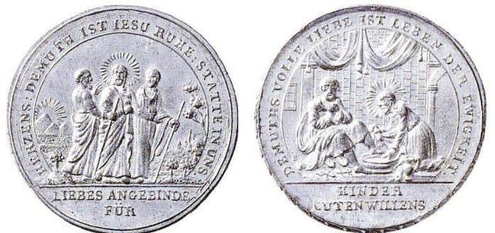
Abb. 7 und 8 Religiöse Zinnmedaille der «Kinder guten Willens» (Gichtelianer). Vorderseite und Rückseite. Deutschland (?), Ende 18./Anfang 19. Jahrhundert. Zinn, Gewicht: 22,41 g, Durchmesser: 3,9 cm. Schweizerisches Nationalmuseum, M 15144.