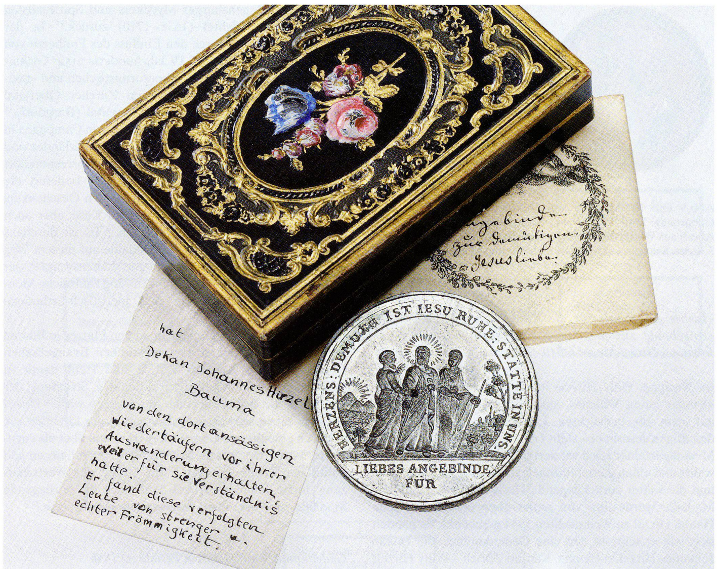
Abb. 6 Religiöse Zinnmedaille der «Kinder guten Willens» (Gichtelianer) mit Originalverpackung und Herkunftsangaben von Willy Hirzel. Deutschland (?), Ende 18./Anfang 19. Jahrhundert. Gewicht: 22,4 g , Durchmesser: 3,93 cm . Schweizerisches Nationalmuseum, M 15144.