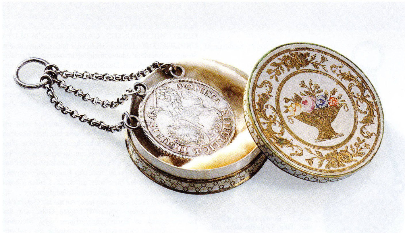
Abb. 1 «Ketteli-Taler» mit Zürcher Taler, 1758. Vorderseite mit Stadtwappen. Silber, Gewicht: 37,44 g, Durchmesser: 4,1 cm. Schweizerisches Nationalmuseum, M 15644.