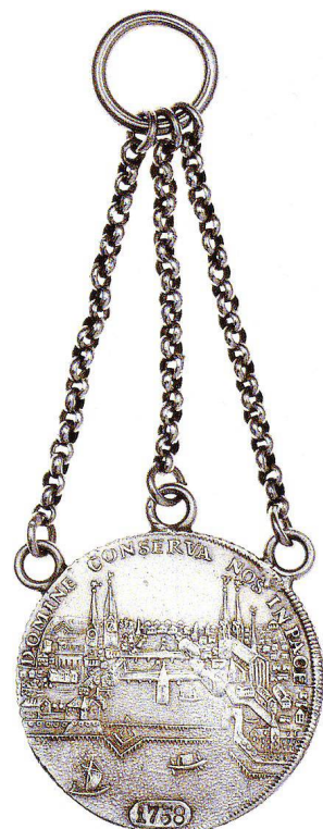
Abb. 2 «Ketteli-Taler» mit Zürcher Taler, 1758. Rückseite mit Stadtansicht. Silber, Gewicht: 37,44 g, Durchmesser: 4,1 cm. Schweizerisches Nationalmuseum, M 15644.