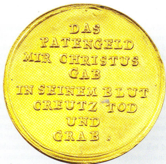
Abb.4 Taufpfennig. Rückseite mit Inschrift. Deutschland (?), um 1800. Gold, Gewicht: 3,37 g, Durchmesser: 2,2 cm. Schweizerisches Nationalmuseum, M 15646.