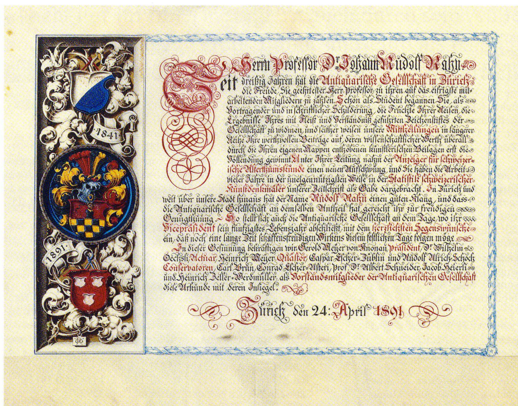
Abb.6 Ehrenurkunde für Johann Rudolf Rahn zu seinem 50. Geburtstag, 1891, Geschenk des Vorstandes der AGZ, Zentralbibliothek Zürich, FA Rahn 1470d.

Winterthur diskutiert. Da die Abbildungen den Vizepräsidenten nicht zu überzeugen vermochten, gab er zu Protokoll, «dass solches Gfätterlzeug durch eine wissenschaftliche Gesellschaft nicht subventioniert werden» dürfe. 40