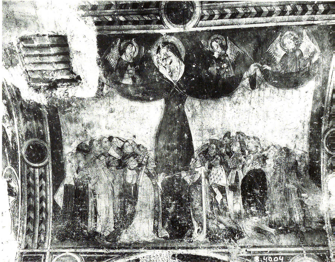
Fig.6 Temple de Saint-Gervais à Genève, Vierge de miséricorde peinte dans la chapelle Tous-les-Saints, avant la restauration de Gustave de Beaumont, photographiée avant 1904–1905.