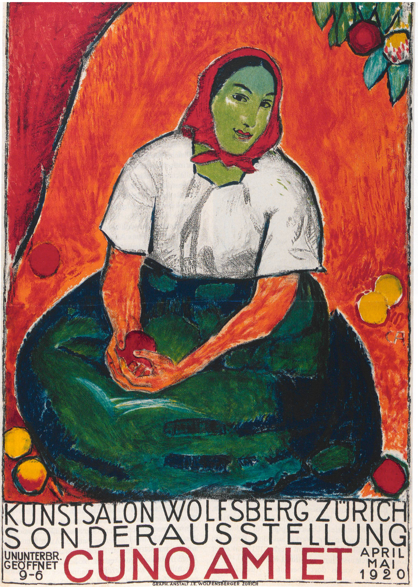
Abb. 2 Cuno Amiet. Plakat für die erste Einzelausstellung im Kunstsalon Wolfsberg, 1920.