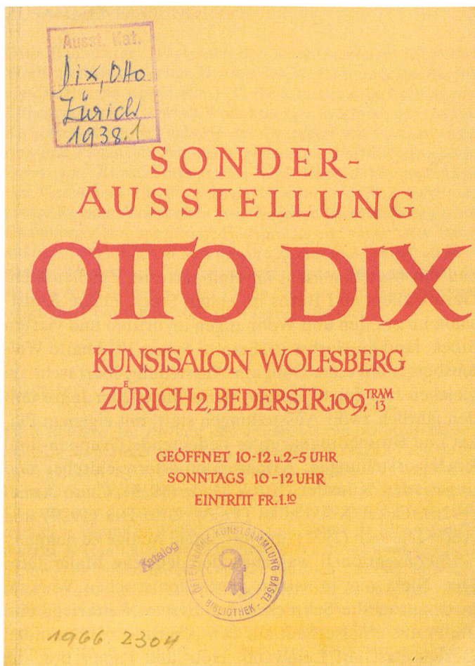
Abb. 2 Faltblatt zur Ausstellung 1938. Kunstmuseum Basel.