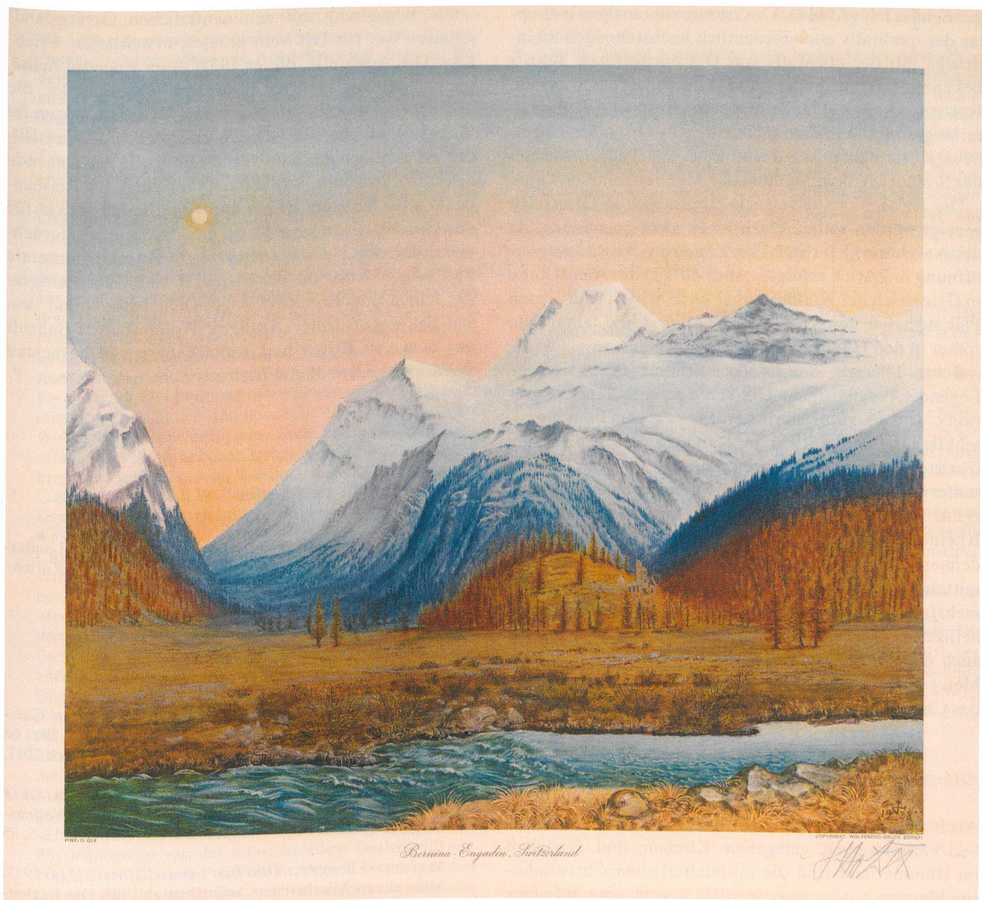
Abb. 5 Bernina. Engadin. Switzerland. Reproduktion eines Gemäldes von Otto Dix, 1938. Vom Künstler signierter Achtfarben- druck. Lithografie. Schweizerisches Nationalmuseum.

der Zeitung wartet mit einer drei Blätter beziehungsweise Beilagen umfassenden Vorschau auf die im folgenden Jahr stattfindende Schweizerische Landesausstellung (Landi) auf. Prominenter hätte die Dix-Ausstellung in der Schweiz nicht besprochen werden können. 16