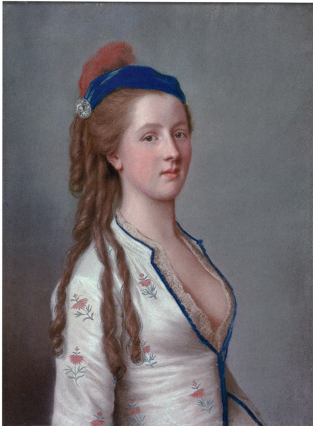
Fig.2 Lady Anne Somerset, de Liotard, 1755. Pastel sur parchemin, 61 × 47 cm. Collection privée.

non pas sur le vif mais d'après des modèles peints par lui-même ou par d'autres peintres. De même, le beau portrait Tucker (RL fig. 413, vendu chez Sotheby's à New York le 29 janvier 2014, lot 42) représente Edward Tucker, né en 1739, mort avant 1777, et non pas son oncle John Tucker, avec lequel il avait par erreur été confondu, et date par conséquent du second séjour londonien de Liotard, 1773–74 au lieu du premier séjour vingt ans plus tôt.