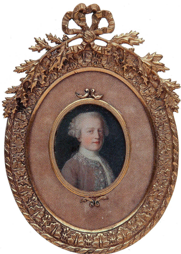
Fig. 13 Jeune homme, de Liotard. Milwaukee, Museum of Art.

pereur & toute la famille Impériale, est ici,» 34 ce qui confirme les liens du peintre avec la cour autrichienne. Quinze ans plus tard, Liotard créera à son tour pour Marie-Thérèse la célèbre série de dessins des enfants impériaux, désormais au nombre de onze (Genève, Musée d'art et d'histoire).