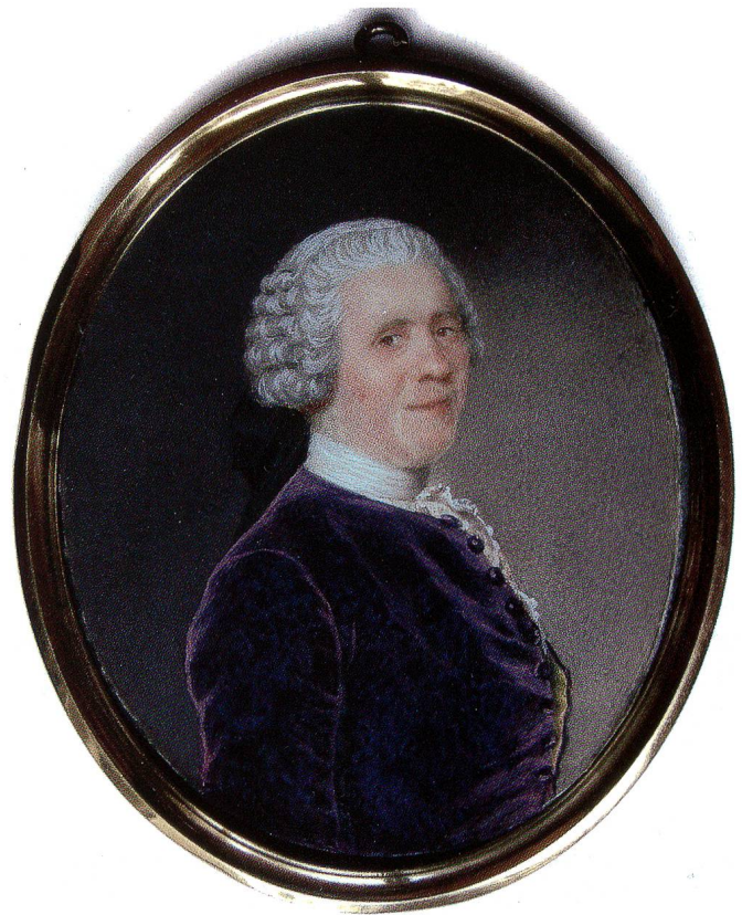
Fig. 12 Marivaux, de Liotard, 1752. Gouache sur ivoire. Collection privée.