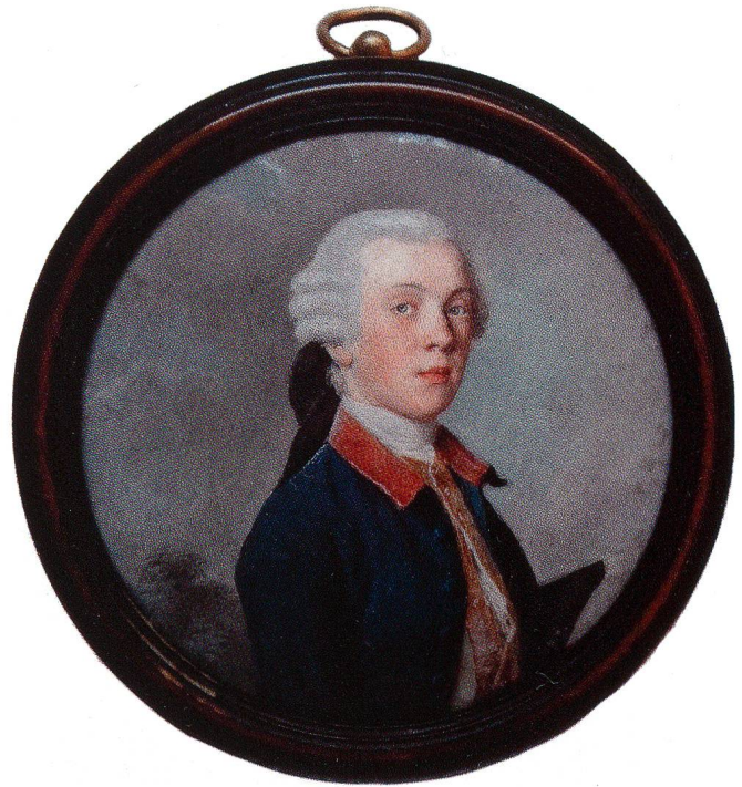
Fig. 11 Jeune homme, de Liotard. Gouache sur parchemin, 57 mm. Collection privée.

Une miniature d'un type unique (fig. 15) 33 représente sept enfants princiers placés en ligne selon leur âge, de toute évidence tous les enfants impériaux d'Autriche vivant à ce moment, de Marie-Anne (née en 1738) à gauche à Peter Léopold (né en 1747) à droite, les petits garçons étant selon la coutume habillés en jupe. Il en résulte la date de mi-1748 pour l'exécution sur place à Vienne. L'identité de Marie-Anne, et par conséquent du groupe entier, est confirmée par les tableaux de groupe du peintre de cour Martin van Meytens. L'attribution à Serre s'impose par l'exécution magistrale au pointillé, très proche de Liotard, comme dans l'autoportrait de Serre, de même que par les motifs du fond analogues à l'autoportrait, et par les teintes brunâtres du fond, caractéristiques de Serre. Une lettre de Fontenelle de Paris, 16 juillet 1750, rapporte que « M. Serre ... qui revient de Vienne, où il a peint en miniature l'Em-