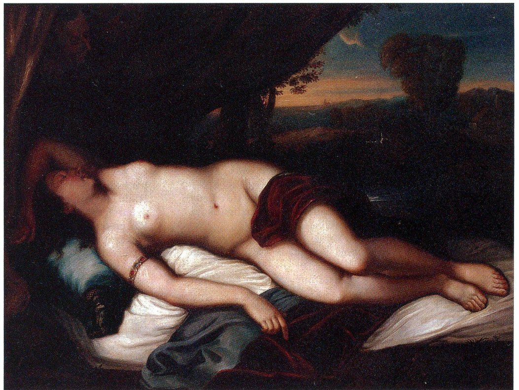
Fig. 16 Vénus, copie d'après Titien. Huile sur toile, 89 × 117 cm.