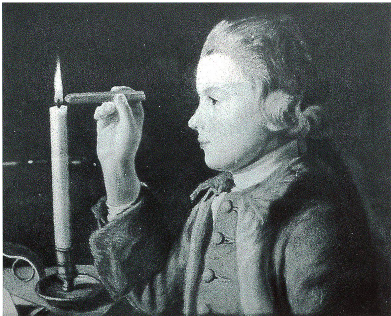
Fig. 3 Un enfant qui allume une bougie, attribué à Liotard, 1765/70. Pastel, 38 × 44 cm. Localisation inconnue.

La composition rappelle, en clé plus simple, l'huile plus grande La Beurrée - Jean-Etienne Liotard fils, peinte vers 1765/70. Dans le pastel, le garçon semble également être un portrait du fils du peintre vers la même date.