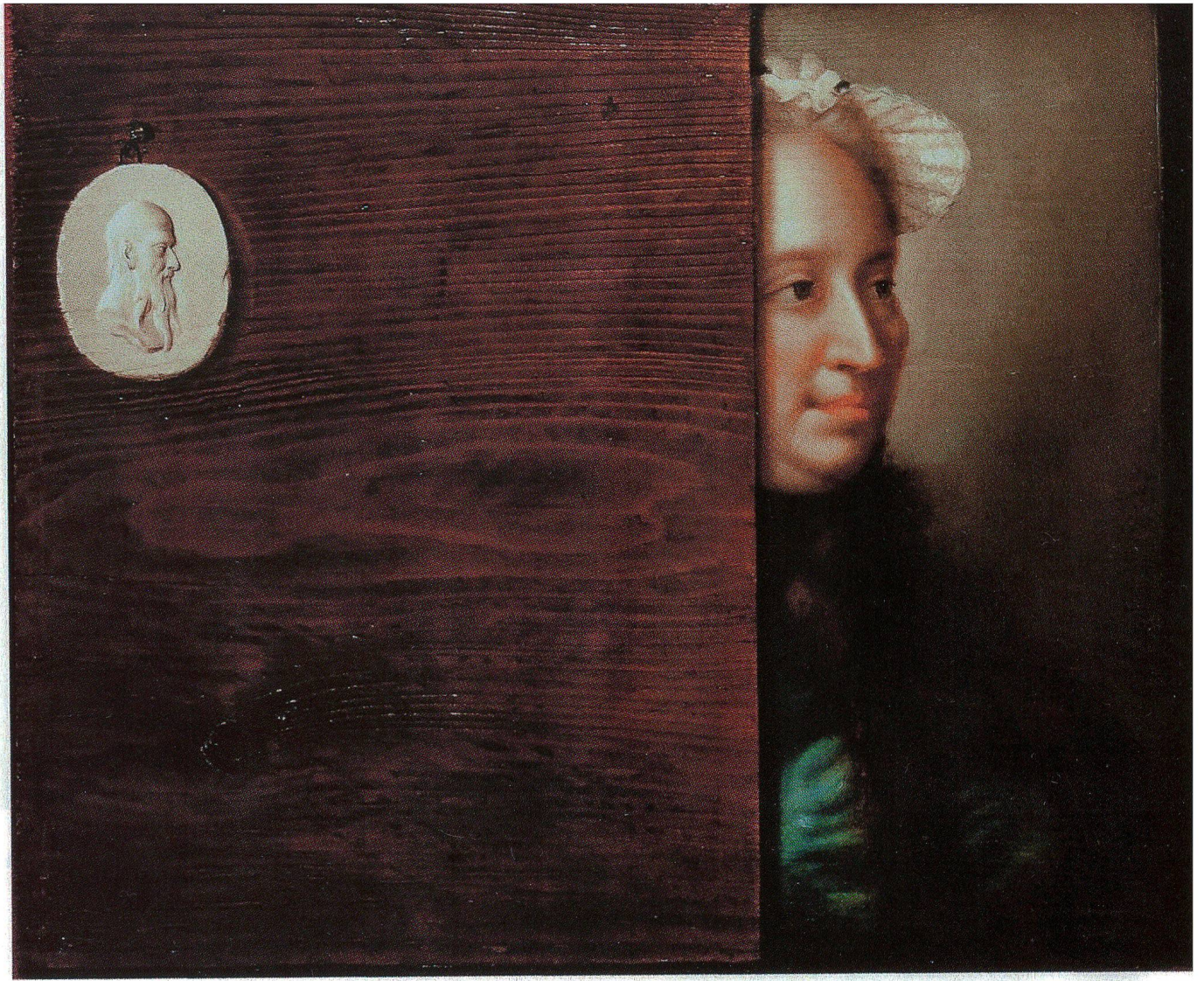
Fig. 7 Trompe-l'œil avec Marie-Thérèse d'Autriche, de Liotard. Huile sur panneau, 36.2 × 43.4 cm. Collection privée.

en vue des provenances se situe probablement pendant les séjours parisien et anglais vers 1750/55. La dame est vêtue d'un lourd kaftan foncé à bandes dorées de brocade doublée d'étoffe imprimée et d'une robe de soie rouge ou bleue selon les exemplaires, elle aussi bordée de bandes d'or. L'unique indication ancienne de provenance est celle de l'exemplaire en robe bleue du Fitzwilliam Museum (RL fig. 352), acquis – pas nécessairement à Constantinople – par le marquis de Granby, que Liotard peignit à Constantinople en 1740. La première mention de cette pièce, dans l'ouvrage sur Belvoir Castle de 1841, la nomme Laura Tarsi, dame grecque de Constantinople; qu'elle fût la maîtresse du jeune marquis en Turquie tient peut-être de la légende, surtout parce que le style ne soutient pas une datation lors du séjour turc. Un exemplaire identique, mais en robe rouge, passa en vente en 2009 (fig. 9). 23 De dessin et couleur identiques à cette dernière, une autre version, qui m'est aimable-