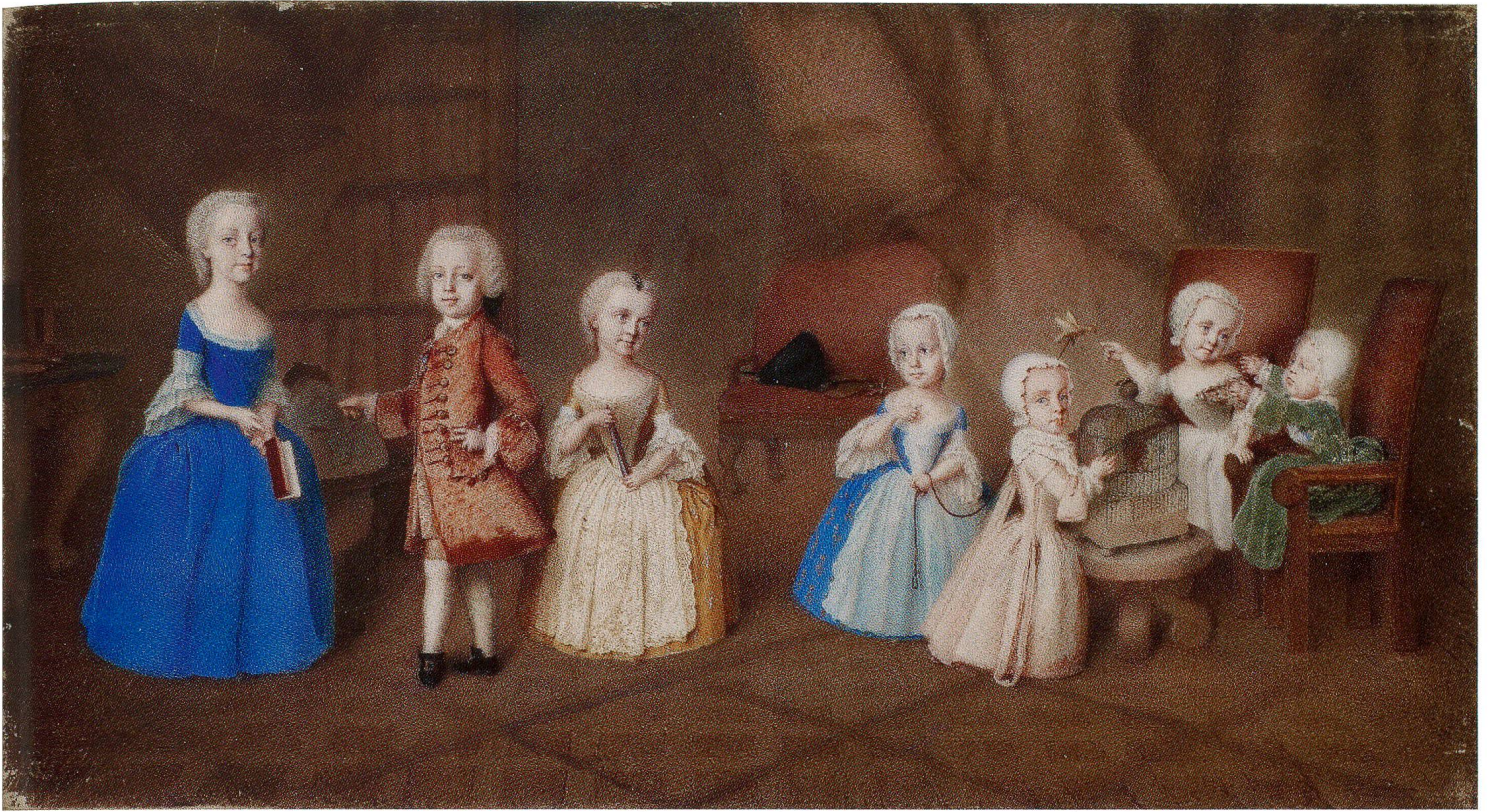
Fig. 15 Enfants impériaux autrichiens, de Jean-Adam Serre, 1748. Gouache sur vélin, 126 × 35 mm. Collection privée.