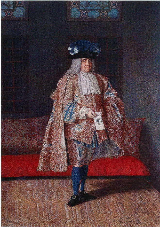
Fig. 8 Comte Ulfeld, de Liotard. Gouache sur parchemin, 316 × 230 mm. Louvre Abou Dhabi.

miniatures suivantes, dont il a découvert et identifié les deux premières. L'une est le Jeune homme en veste bleue (fig. 11) 26 portant une perruque grise, le col de la veste rouge, le gilet beige et or, un tricorne sous son bras gauche. Le cadre est d'ivoire teinté foncé. La date se situe vers 1745–1750. L'addition la plus attendue est celle de Marivaux (fig. 12) 27 en veste violette, miniature inconnue jusqu'à présent, mais documentée par la correspondance de Horace Walpole, qui fut passionné par les écrits de Marivaux et de Crébillon. Il la commanda à Paris en juillet 1752 au prix de seize guinées. L'écrivain français, dont Liotard est dit avoir été un intime, 28 était alors âgé de 64 ans et désormais retiré. Le peintre livra la miniature à Walpole en personne en mars 1753 à Londres. Commentaire de Walpole: «L'image donne une idée très différente de celle qu'on conçoit de l'auteur de Marianne , quoiqu'elle soit considérée extrêmement ressemblante: l'apparence est un mélange de bouffon et de scélérat ( villain ).» On peut la comparer avec la miniature du Earl of Orford 29 de 1753. Une autre miniature, découverte au musée de Milwaukee par Elle R. Shushan de Philadelphie (fig. 13), 30 montre un très jeune homme