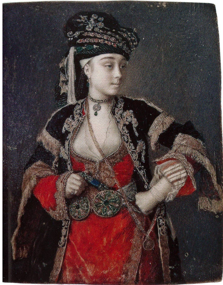
Fig. 10 Dame en costume turc, de Liotard. Gouache sur ivoire, 96 × 79 mm. Collection privée allemande.

n'en reparlera pas. Dans un autoportrait singulier en miniature de 1734 (fig. 14), 32 le jeune Serre se présente assis dans son atelier, élégamment vêtu en rouge, entouré de livres devant un rideau, en train de peindre ce même autoportrait.