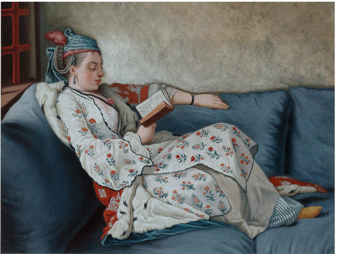
Fig. 5 Dame assise sur un sofa, de Liotard. Huile sur toile, 46.5 × 57.3 cm. Collection privée.