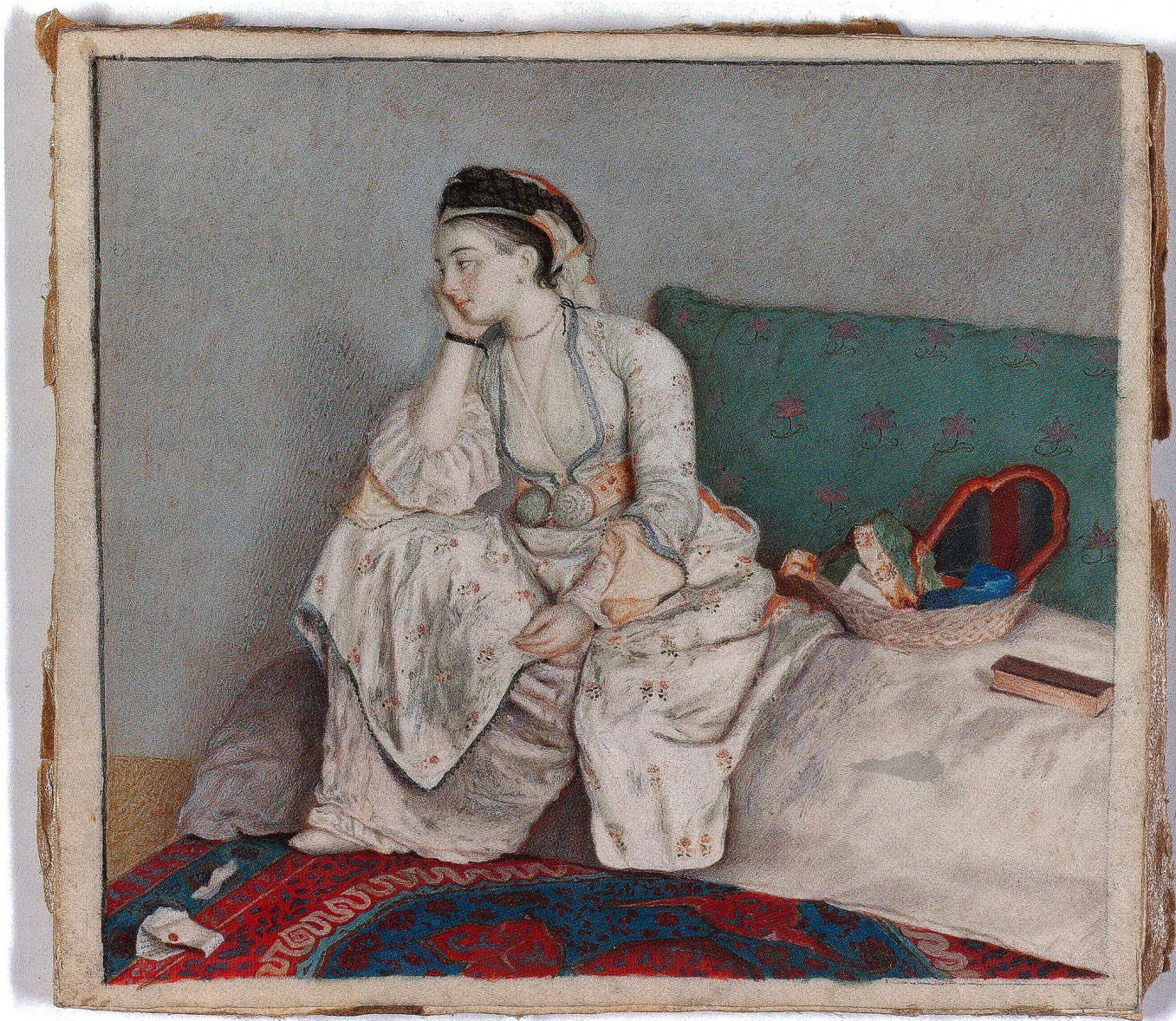
Fig. 4 Dame lisant sur un sofa, de Liotard. Gouache sur parchemin, 88 × 97 mm. Collection privée.

Le sujet dont il existe le plus grand nombre de versions est le couple impérial François-Etienne et Marie-Thérèse. Une paire inédite, correspondant exactement à celle de Weimar, a été retrouvée au Kunsthistorisches Museum de Vienne, un endroit évident parmi tous, quoique cette paire restât inconnue, reléguée au dépôt et jamais exposée. Sa qualité rend la distinction entre original et copie d'atelier pratiquement impossible sans une juxtaposition sur place. Il faut à ce propos tenir à l'esprit que selon la biographie de Liotard rédigée par son fils, la plupart des versions d'atelier des portraits de la famille impériale furent de Kobler, Liotard « n'en ayant fait au plus qu'une dizaine. »