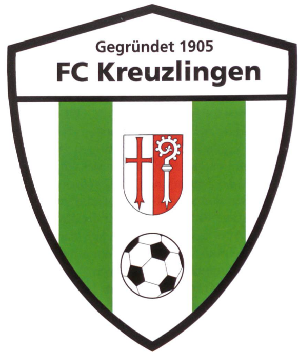
Abb. 11 Logo des Fussballklubs FC Kreuzlingen 1905.

klösterliche Institution, repräsentiert durch den Abt, der die Scheibe zu einem Zeitpunkt gestiftet hatte, als die Eigentumsrechte des Klosters an der Kirche noch nicht geklärt waren. 47 Der Tondo manifestiert hier nicht primär persönliche, sondern vor allem klösterliche Ansprüche.