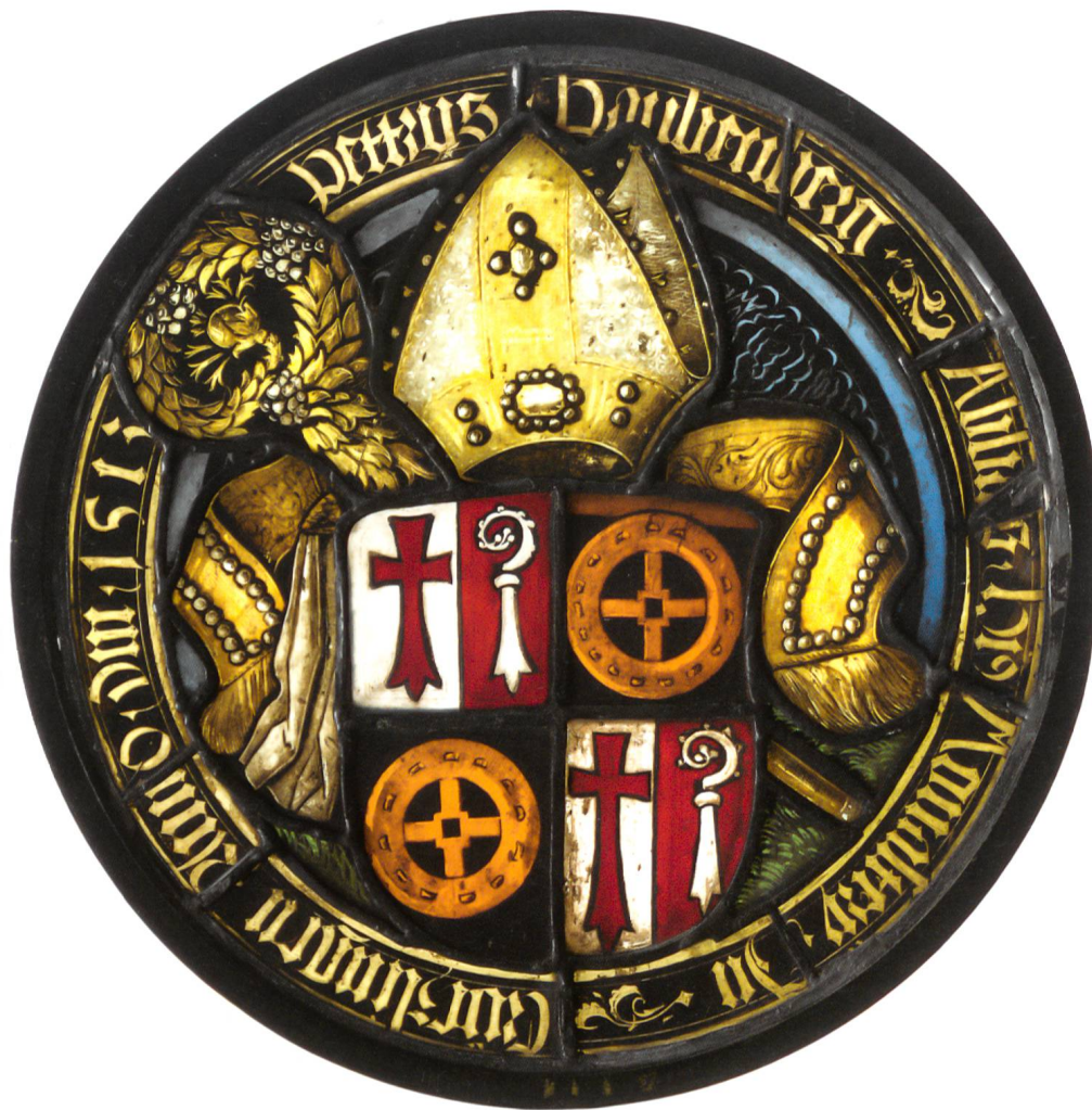
Abb. 10 Wappenscheibe mit viergeteiltem Schild mit den Wappen des Kreuzlinger Abts Peter von Babenberg und des Chorherrenstifts aus der Kirche von Aawangen TG, 1513. Schweizerisches Nationalmuseum, Inv. Nr. IN 6921.

che Geschenk. Nicht mehr zu klären ist, ob die explizite Aussage in der Konstanzer Handschrift, der Kreuzlinger Abt habe zuvor weder eine Mitra gebraucht noch besessen, der Korrektheit des Chronisten oder der gelebten Realität des Stifts entsprochen hat. Denn bereits von 1394 ist ein Siegel von Abt Erhard Dominik Lind überliefert, auf dem dieser unter einem Baldachin thronend mit Mitra abgebildet ist (Abb. 7). 38 Ob das eigentliche Geschenk des Papstes die nachträgliche Legitimierung einer bereits bestehenden Praxis war, muss offenbleiben.