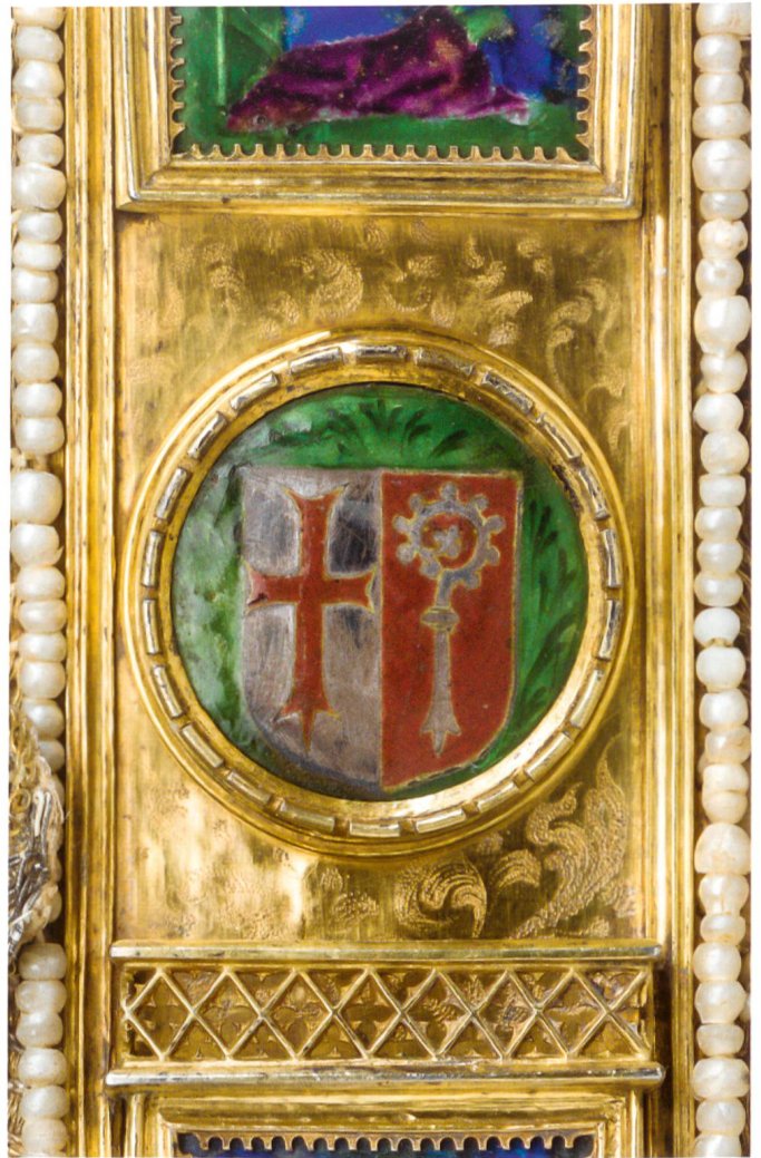
Abb. 9 Mitra aus dem Kloster Kreuzlingen, Wappen des Chorherrenstifts auf dem vorderen Titulus, Bodenseegebiet, Mitte 15. Jahrhundert. Transluzides Tiefschnittemail. Frauenfeld, Historisches Museum Thurgau, Inv. Nr. T 83.

Nachdem Konstanz während des Konzils einen kulturellen und wirtschaftlichen Aufschwung erlebt hatte, folgten für Kommune und Klöster in der zweiten Hälfte des 15. Jahrhunderts wirtschaftlich schwierige und politisch instabile Zeiten. Vor diesem Hintergrund wird die Zunahme neuer Ausgaben der Chronik zwischen 1460 und 1470 als Akt des kollektiven Erinnerns an die Blütezeit der Stadt gedeutet. 33 Dabei kommt glanzvollen Episoden, die in der Stadt gegenwärtig blieben, wie der Auszeichnung des Kreuzlinger Abtes, ein wichtige Rolle