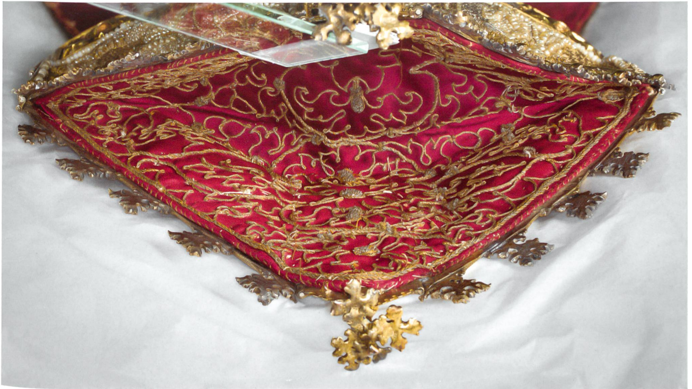
Abb. 4 Mitra aus dem Kloster Kreuzlingen, Mittelteil zwischen den Hörnern mit ornamentaler Stickerei und mit angelegten Kordeeln aus Goldfäden sowie Kantillen aus Gold- und Silberdrähten. Frauenfeld, Historisches Museum Thurgau, Inv. Nr. T 83.