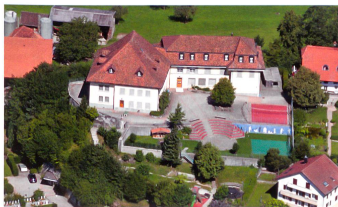
Fig.10 Château Diesbach de Steinbrugg à Heitenried. Héberge actuellement l'école primaire.

correspondante le connaît très probablement, « c'est le comte de Diesbach, colonel et maréchal de camp et cordon rouge. Il a dans cette campagne son château sur une élévation de rochers, au pied desquels est le village peuplé de paysans, la plupart fort riches. Derrière le château, nous avons de fort belles promenades de plain-pied avec un vaste bois des plus agréables pour la fraîcheur dans la saison où nous sommes. » La société se compose de cinq personnes, « et je mène une vie douce et tranquille, beaucoup de promenades et de jeux, avec fort bonne chère moyennant un excellent cuisinier élevé à Paris. » Reynold a l'intention de rester jusqu'à l'automne et de se retirer ensuite dans une autre maison de campagne dont le mérite est « d'être moins voisine des montagnes. »