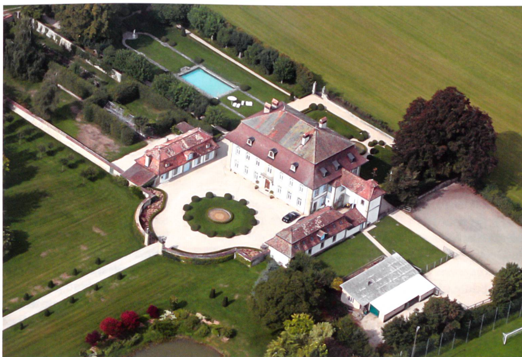
Fig.4 Château de Forel à Middel.

pondent à l'idéal du domaine de campagne aristocrate, avec élégante cage d'escalier, salon, boudoirs, chambres à coucher, ainsi que jardin et parc. 15 Dans la catégorie des maisons de maître imposantes, avec grange et ferme, on compte également la maison de campagne du conseiller François-Jacques Chollet (1693–1743), construite au milieu du XVIII e siècle à Grolley. 16 D'autres châteaux sont construits en 1769 à Seedorf (fig.6) pour Nicolas-Joseph Emmanuel Vonderweid (1720–1795), ainsi qu'en 1770 pour la branche de Fégely, dans le village voisin de