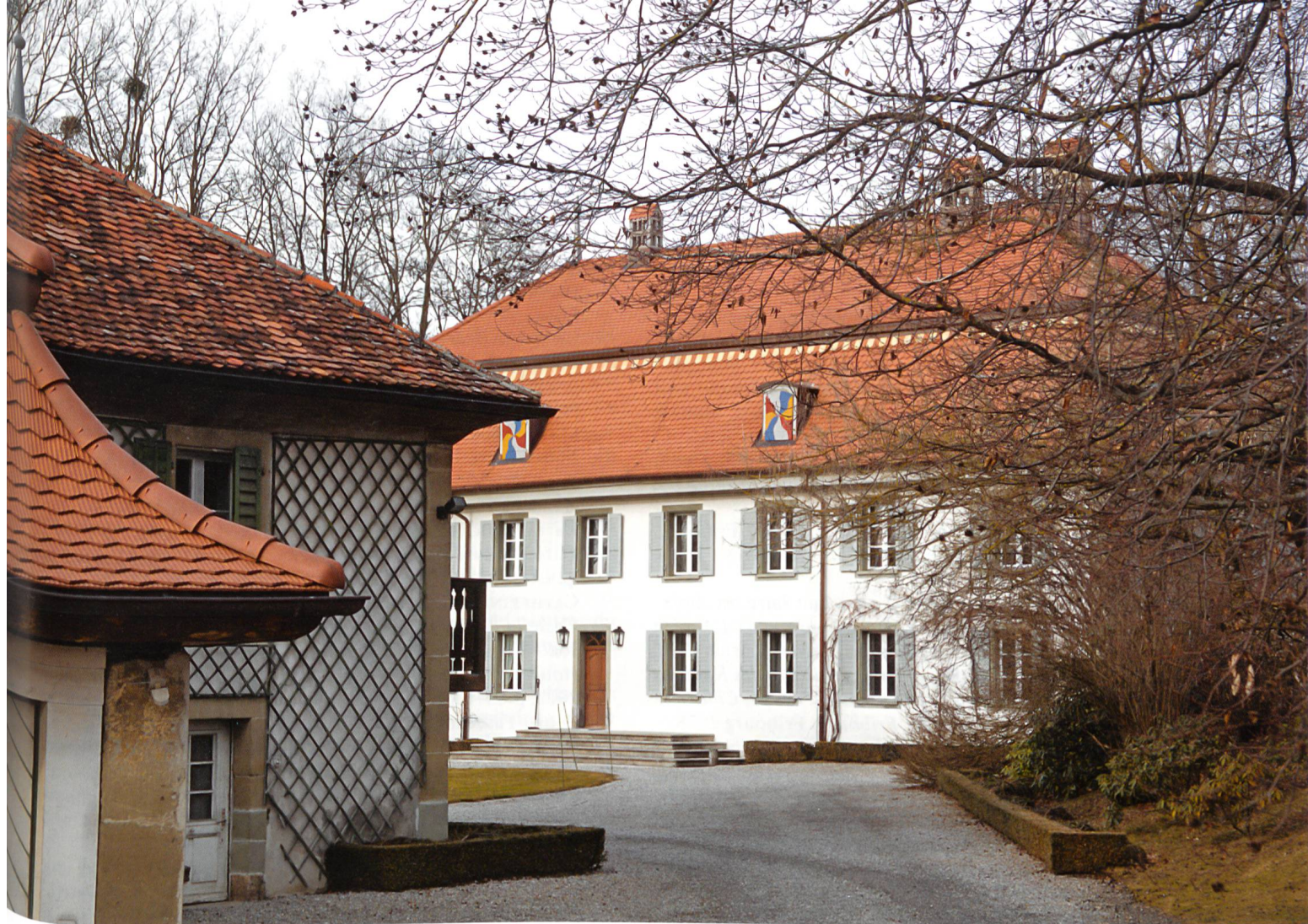
Fig. 12 Manoir de Boccard à Jetschwil, près de Düdingen.