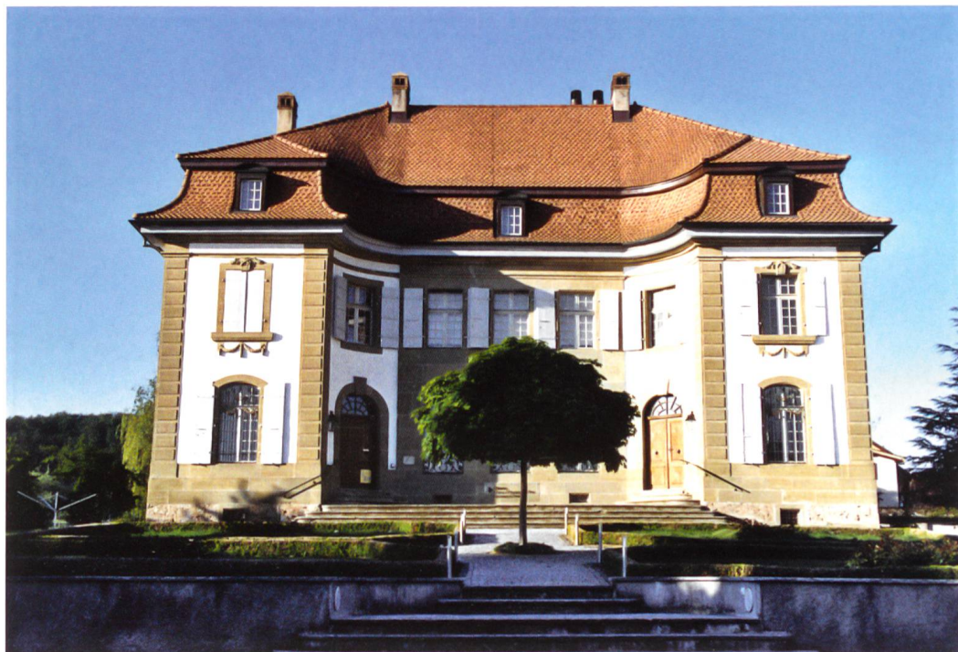
Fig.7 Château de Prez-vers-Noréaz.

plus régulièrement habités que ceux qui en sont éloignés. Ces derniers servent principalement pour les jours de fête et pour les mois de l'été. Comme en témoignent les correspondances, des officiers de retour, des membres de certaines familles, ainsi que des conseillers qui ont perdu tout intérêt à la politique passent toute l'année à la campagne. Vu l'étendue du territoire fribourgeois, un va-et-vient régulier n'est pas impossible ; des familles riches comme les Diesbach ou les Castella possèdent des voitures, se déplacent à cheval pour les distances plus longues, ou encore utilisent des chaises. D'autres louent des litières de cas en cas, parfois pour des raisons de santé ou pour le transport des bagages. 20 Tous ne possèdent pas leur propre cheval, mais il arrive qu'un cheval soit mis à disposition en vertu d'un office. Sinon, on emprunte le cheval d'un voisin ou encore on va tout simplement à pied. 21