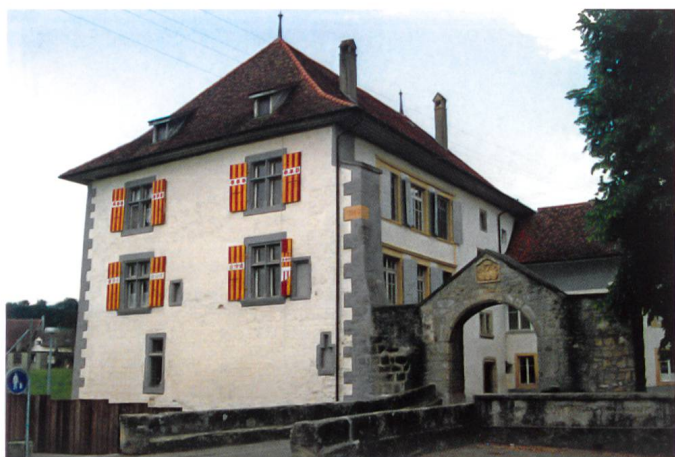
Fig. 11 Château de Reyff à Cugy. Héberge actuellement l'école primaire.