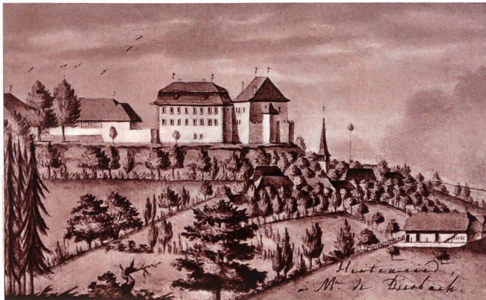
HEITENRIED, nach einem Aquarell von 1798, in Privatbesitz

surtout à des nobles, puisqu'il mentionne des représentants des familles d'Affry, de Boccard, de Diesbach et de Maillardoz. Néanmoins, il ne décline pas leurs invitations, même durant les mois d'été.