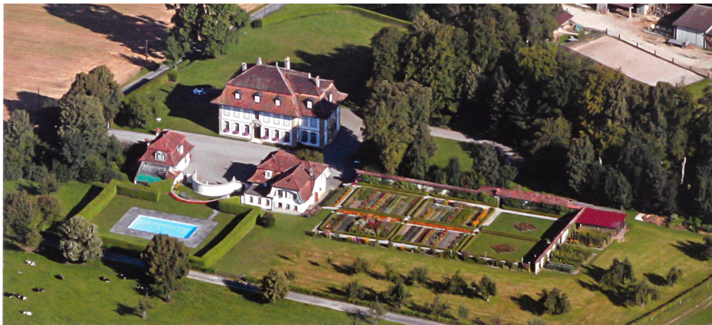
Fig. 5 Manoir de Vogelshaus, près de Bösingen.