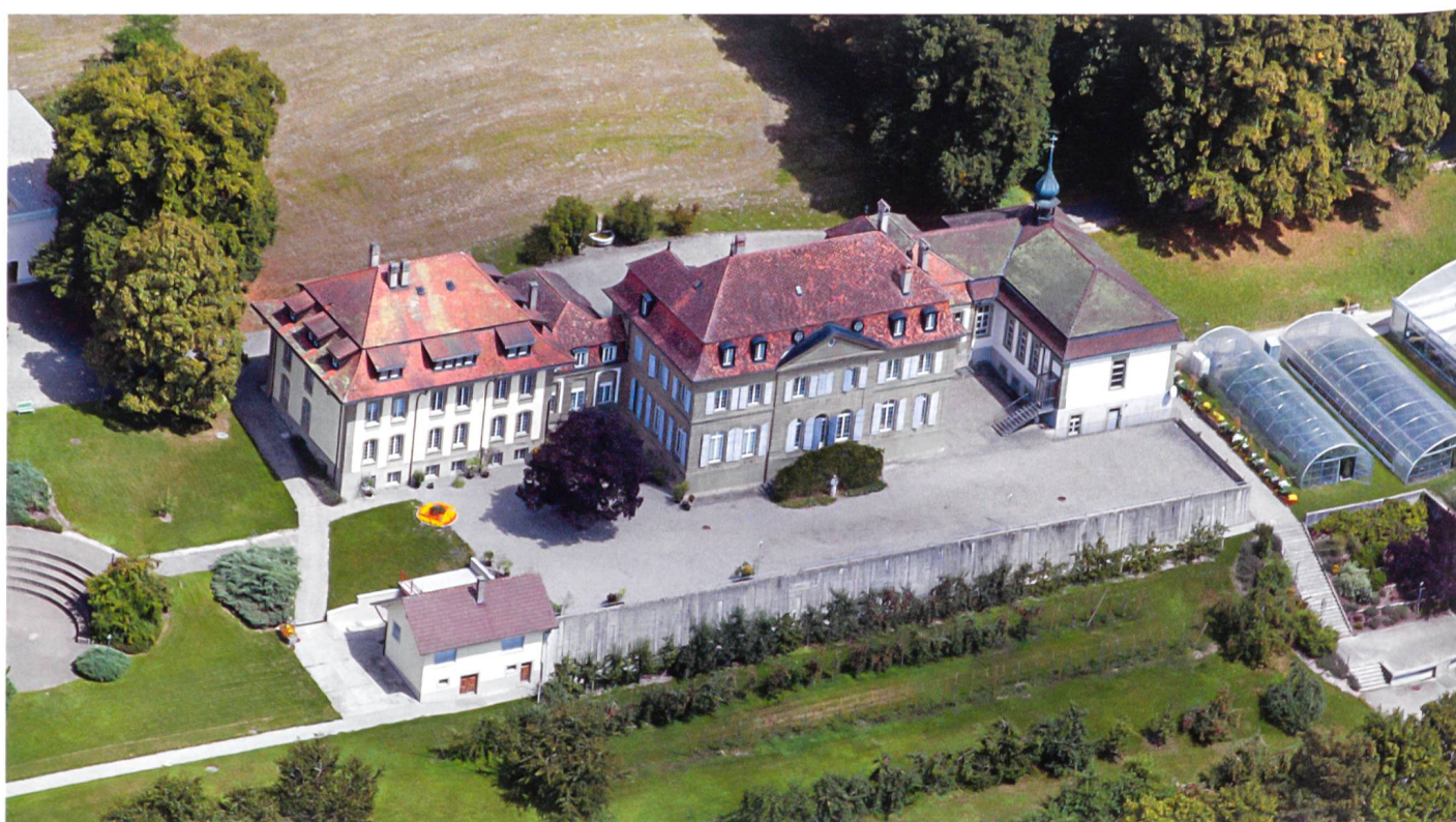
Fig. 6 Château von der Weid à Seedorf.

Prez-vers-Noréaz (fig. 7). 17 Par ailleurs, des domaines existants sont réaménagés, à l'instar du château de Jetschwil, près de Guin, habité au milieu du siècle par le maréchal de camp François-Philippe de Bocard (1696–1782) et son frère Joseph-Hubert (1697–1758), futur évêque de Lausanne. De même, le château des Castella de Delley, construit dans la Broye en 1706, est prolongé dans la seconde moitié du XVIII e siècle par des ailes latérales et doté d'un ensemble de jardins de style nouveau. 18