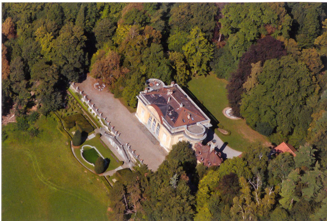
Fig.2 Château de la Poya, dans la périphérie de la ville de Fribourg.

Abordons maintenant les domaines à la campagne. Selon le Service des biens culturels de l'Etat de Fribourg, environ 220 domaines sont considérés comme des « châteaux », dont 34 seulement sont issus de châtelainies médiévales. 10 L'éventail va de la simple campagne meublée modestement, 11 à la maison de maître dotée d'une grange et d'une ferme, 12 jusqu'au vrai château. D'après l'inventaire des biens culturels immobiliers, le XVIII e siècle fribourgeois est marqué par une importante activité de construction, c'est pourquoi on ne donnera ici que quelques exemples. Le château de La Poya (fig.2), construit entre 1698 et 1701 dans les environs de la ville, est précoce et unique en Suisse, selon Hermann