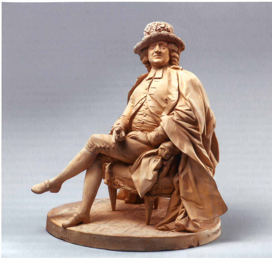
Fig. 9 Portrait de Wolfgang Charles de Gingins, signé Valentin Sonnenschein, daté de 1787. Terre cuite, 38 × 33 × 35 cm. Château de La Sarraz.

regimentsfähig . 42 Au XVIII e siècle, ce processus atteint son apogée. En 1747, les membres du patriciat ne peuvent plus s'engager dans des sociétés commerciales et doivent donc pouvoir se consacrer exclusivement au service de l'Etat. 43 En 1761, ils s'autoproclament nobles, 44 avant de s'arroger le droit de porter la particule en 1783. 45