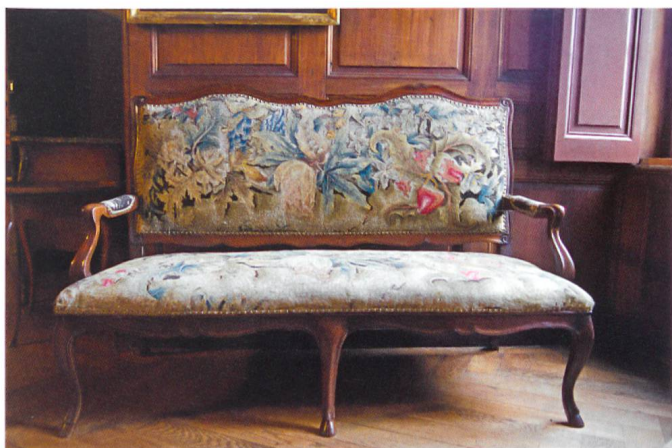
Fig. 4 Canapé, attribué à l'atelier de Mathäus Funk, vers 1750. Noyer et tapisserie de laine, 105 × 135 × 72 cm. Château de La Sarraz.