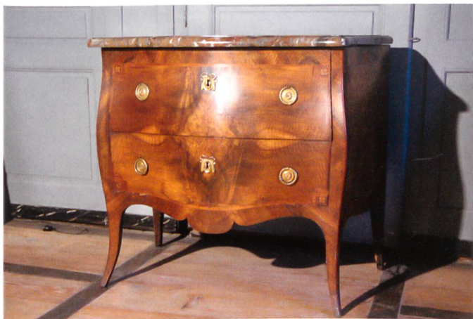
Fig. 6 Commode, attribuée à l'atelier de Johannes Äbersold, vers 1775–1785. Noyer, acajou, prunier, buis, laiton doré, marbre de Roche, 83 × 102 × 54 cm. Château de La Sarraz.