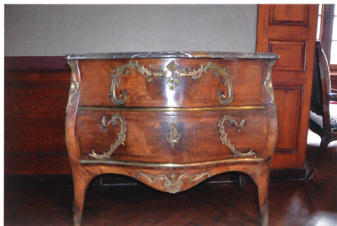
Fig. 5 Commode, attribuée à l'atelier de Mathäus Funk, vers 1750–1760. Noyer, laiton doré, marbre de Roche, 87 × 98 × 61 cm. Château de La Sarraz.