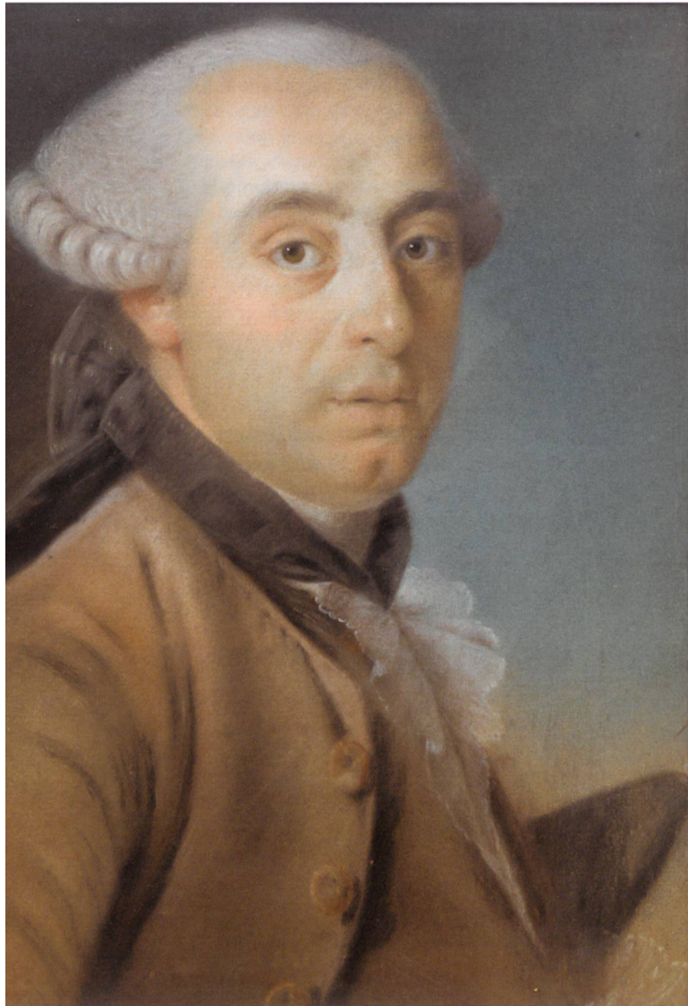
Fig. 2 Portrait d'Amédée Philippe de Gingins, signé Wille, daté de 1757. Pastel sur papier, 45 × 35 cm. Château de La Sarraz.

Grâce à un important fonds documentaire conservé aux Archives cantonales vaudoises, 3 comportant entre autres plus d'une dizaine de livres de raison, 4 il est possible de suivre les commandes mobilières de la famille de Gingins au siècle des Lumières. Ces données ne forment pas qu'une liste d'achats; elles fournissent de précieuses informations relatives à l'organisation spatiale du commerce des meubles ainsi qu'au goût, à la sensibilité et au type de dépenses d'un lignage appartenant au patriciat bernois. Au carrefour de l'histoire de la culture matérielle et des arts décoratifs, cette contribution propose d'étudier la valeur économique, sociale et symbolique qu'Amédée Philippe (1731–1783) et Wolfgang Charles de Gingins (1728–1811) attribuent à leur patrimoine mobilier. 5