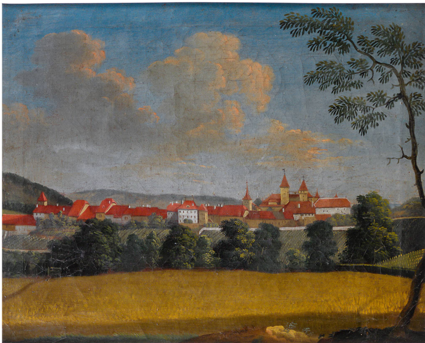
Fig. 1 Vue de La Sarraz depuis le sud, anonyme, XVIII e siècle. Huile sur toile, 36.5 × 43 cm. Château de La Sarraz.

celui pour qui l'on édifie et sur la destination de chaque pièce ». 2 Le mobilier prend ainsi place et sens dans un environnement social et esthétique hiérarchisé. Il en respecte les contraintes et en décline les nuances, pour répondre aux envies de luxe, de confort et de représentation des élites patriciennes – les seules, à l'échelle régionale, à disposer des moyens pour mettre ces désirs en œuvre.