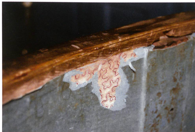
Fig. 7 Détail de l'intérieur d'un tiroir de la commode. Papier vermiculé sous papier bleu. Château de La Sarraz.

placages, ils emploient des essences indigènes, en particulier le noyer, le cerisier, le prunier, le buis, et les associent parfois à des bois exotiques, tels que le palissandre, le bois de rose ou l'acajou. En somme, ces ébénistes polyvalents dirigent des ateliers capables de fournir tous les meubles ou équipements nécessaires à l'aménagement de décors d'apparat.