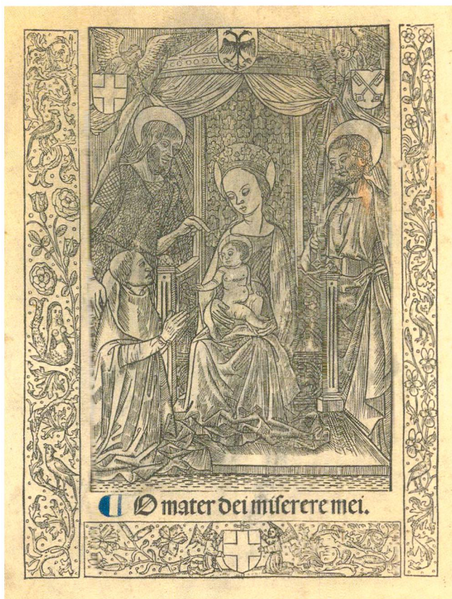
Abb. 8 Maria mit Kind, den Heiligen Johannes dem Täufer und Petrus sowie dem Stifter, aus: Genfer Missale ( Missale secundum usum Gebennensem ), 1491. Bibliothèque de Genève, Bd. 44.

grünen Stoffbahnen handelt es sich offenbar nicht um Teile eines Baldachins, sondern um einen parallel zur Bildfläche verlaufenden Vorhang, der sich auf die Heilige Familie öffnet. Scheint es, als würde er in geschlossenem Zustand vor der Figurengruppe niederfallen, verläuft er im unteren Teil der Komposition, wie vor allem auf der rechten Seite deutlich wird, hinter ihr. Offensichtlich ist dem Maler die Komposition des Bildes wichtiger als die Logik des dargestellten Raums.