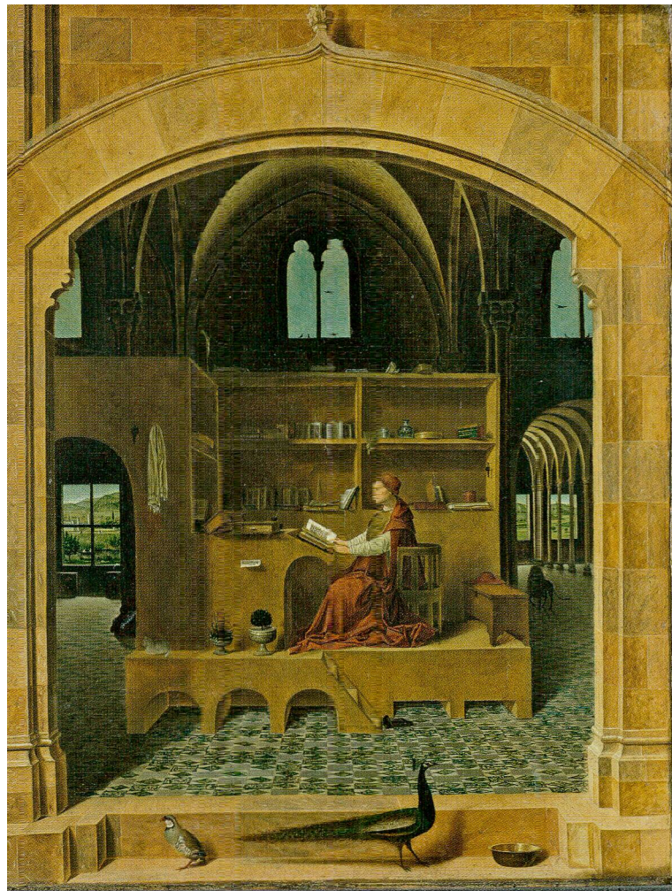
Abb.6 Der heilige Hieronymus im Gehäus, Antonello da Messina, um 1475. National Gallery, London.

Vizepräsident des Komitees und Gründungsdirektor des Schweizerischen Landesmuseums. 55 Ausserdem werden an der Ausstellung massgebliche Werke des Malers unter seinem Namen präsentiert: der sogenannte Bugnon-Altar und die Enthauptung Johannes des Täufers. 56 Offenbar versuchen die Schweizer Kunsthistoriker und Museumsleute in Genf jedoch nicht, das Täfelchen zu erwerben: allem Anschein nach schickt man es am Ende der Ausstellung nach London zurück. 57 In Freiburg ist man sich der Entdeckung jedoch sehr wohl bewusst: 1898 wird das Werk in einem Faszikel des Tafelwerks Fribourg artistique à travers les âges abgebildet und von Pater Joachim Joseph Berthier kommentiert; über ein Jahrhundert bleibt die damals publizierte Schwarz-Weiss-Fotografie die einzige bekannte Reproduktion des Gemäldes. 58 Die schweizerische Kunsthistoriografie nimmt die kleine Tafel unverzüglich ins Œuvre von Fries auf; bereits Josef Zemp, von 1898 bis 1904 Ordinarius für Kunstgeschichte an der Universität Freiburg i. Ü., erwähnt sie in seinem Artikel zu Fries im Schweizer Künstler-Lexikon. 59