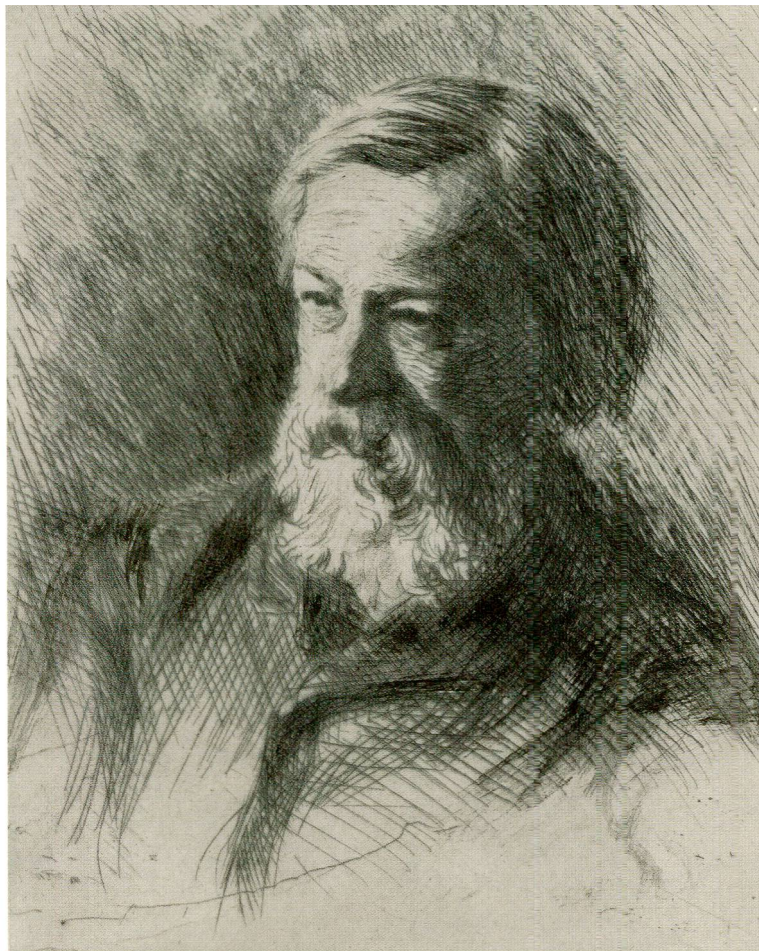
Abb.5 Bildnis Sir John Charles Robinson, G. Robinson, 1880/90er Jahre. Radierung. National Portrait Gallery, London.

Hieronymus im Gehäus», bis dahin van Eyck zugewiesen, plötzlich als Werk Antonellos aufgeführt (Abb.6). 50 Dies gibt möglicherweise den Ausschlag, auch die «Maria mit Kind und heiligem Joseph» van Eyck ab- und Antonello zuzuschreiben: mit dem «Heiligen Hieronymus» verbindet sie die minutiös feingliedrige Darstellung von Personen in einem vornehmen Raum mit rückwärtigen Fenstern, durch die der Blick in eine Landschaft schweift.