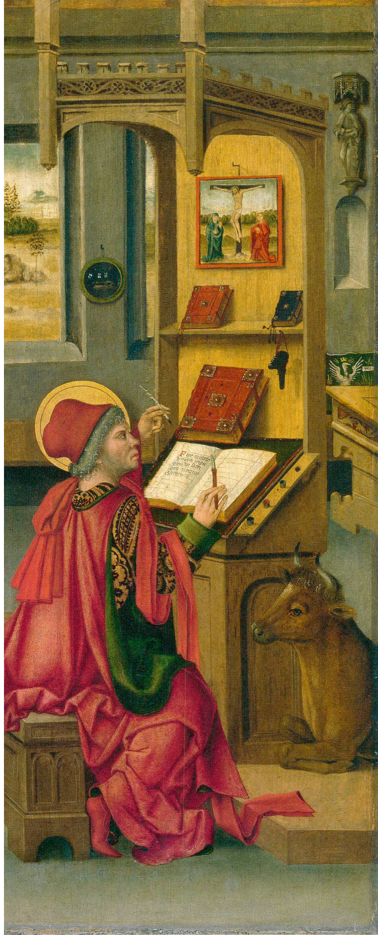
Abb. 9 Der Evangelist Lukas, Gabriel Mälesskircher, zwischen 1474 und 1479. Museo Thyssen-Bornemisza, Madrid.

Das doppelte Rundbogenfenster 91 in der Rückwand, durch das der Blick auf die Landschaft fällt, wird in der Mitte von einem Säulchen gestützt; Basis und Kapitell weisen goldene Wulstprofile auf; der rote Schaft glänzt, ja scheint transluzid zu sein. Möglicherweise soll diese rot-goldene Säule, die ganz ähnlich auch in der «Ausgussung des Heiligen Geistes» zu sehen ist, 92 mehr als nur Palastarchitektur evozieren; Fries könnte damit auf das aus Edelsteinen gebaute Himmlische Jerusalem (Offenbarung 21,10–21) anspielen.