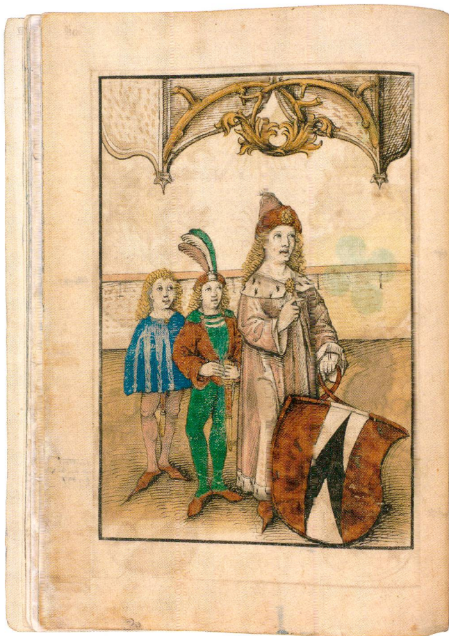
Abb.10 Rudolf von Erlach mit zwei seiner Söhne, Burkhart und Johann, Diebold Schilling, aus: Spiezer Chronik . Bern, Burgerbibliothek, Mss.h.h.I.16, S.30.

Kunstmarkt, der sich auf deutschem und schweizerischem Gebiet etwas später als in Italien und in den Niederlanden entwickelte, hatte eine geografisch weiträumige Verbreitung von Werken zur Folge und ging mit einem sich individualisierenden Gebrauch gemalter und geschnitzter Bilder einher. Dabei spielten offensichtlich nicht nur das Frömmigkeitsbedürfnis eine Rolle, sondern ganz entschieden bereits auch der Wille der Eliten, sich durch den Besitz kostbarer Kunst von ungebildeteren Schichten abzuheben. Leuchtende Farben mit emailhafter Oberfläche, raffinierte Kompositionen und eine minutiöse Ausführung trugen zur Attraktivität solcher Pretiosen bei. 102