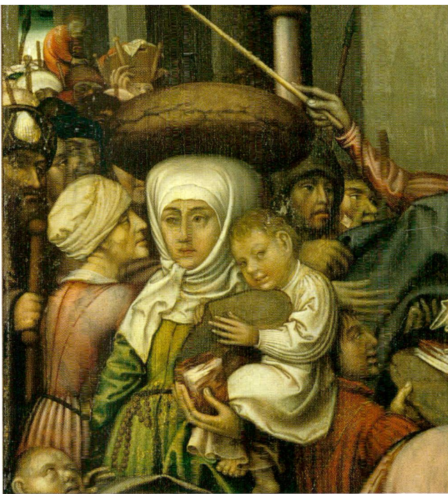
Abb.2 Die Werke der Barmherzigkeit, Bugnon-Altar, Aussenseite des linken Flügels, Hans Fries, um 1505. Depositum der Gottfried Keiler-Stiftung im Museum für Kunst und Geschichte Freiburg i. Ü.

der Tschechischen Republik. Zählt man sie nach in sich geschlossenen Darstellungen, kommt man auf 27 Gemälde inklusive einer Wandmalerei, vier Zeichnungen, einen Holzschnitt und die Fassung einer Skulptur. 15 Ein Drittel dieser Werke wird im Museum für Kunst und Geschichte Freiburg aufbewahrt und vollumfänglich präsentiert, darunter auch das wiedergefundene Täfelchen. 16 Was diesem in den letzten zwei Jahrhunderten widerfahren ist, gleicht einem Abenteuerroman.