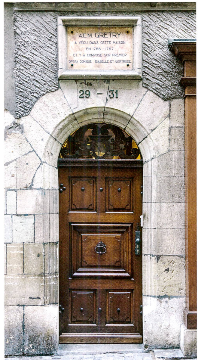
Fig. 1 Demeure de Grétry, Grand'Rue 29 à Genève : « A. E. M. Grétry a vécu dans cette maison en 1766–1767 et y a composé son premier opéra comique Isabelle et Gertrude ».

superficiel, a retenu l'attention du gentilhomme protestant et ce que ces écrits révèlent de leur auteur.