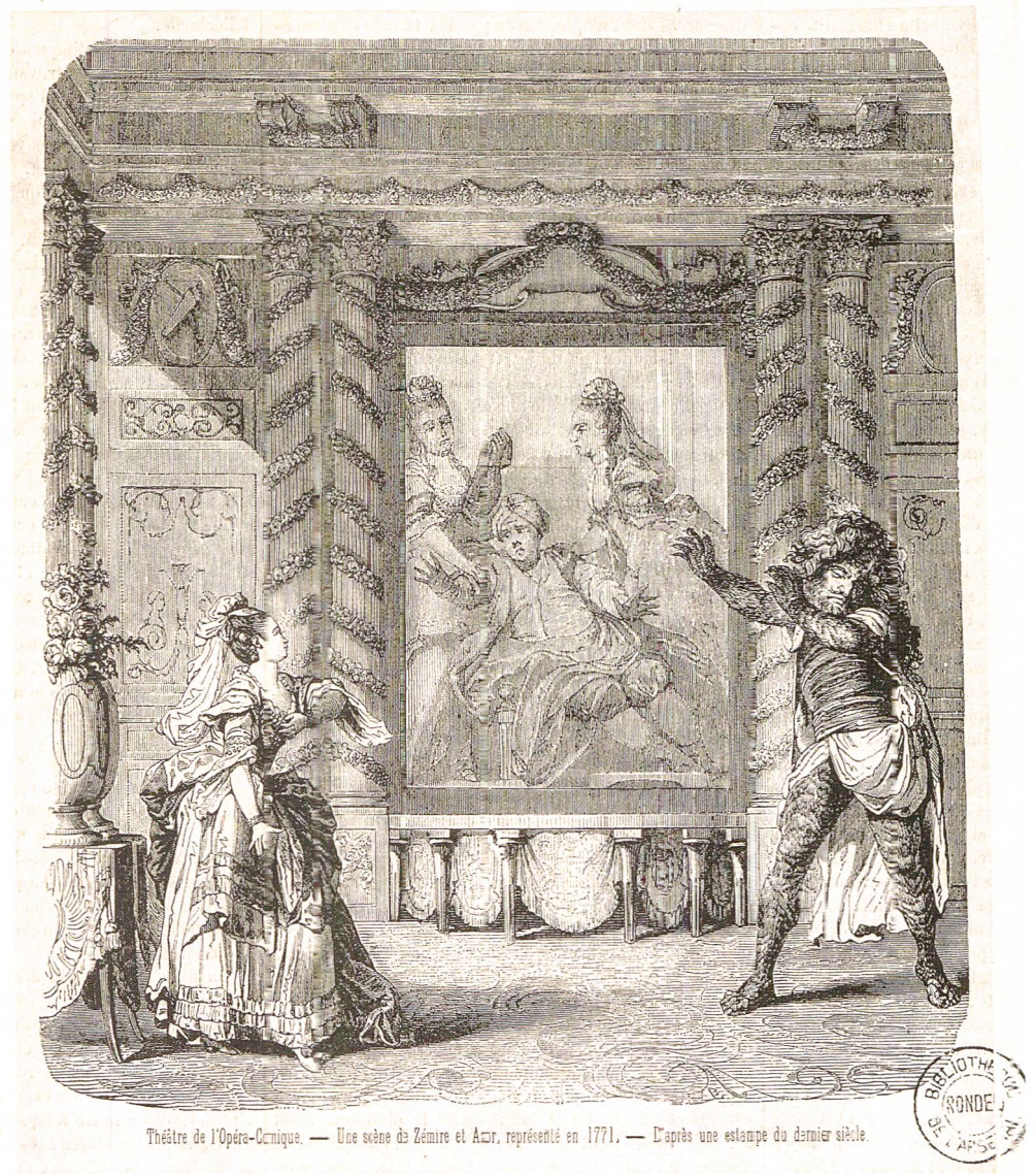
Théâtre de l'Opéra-Comique. — Une scène de Zémire et Azor , représenté en 1771. — D'après une estampe du dernier siècle.

Le 24 juin, la première pièce est Les Deux Chasseurs et la Laitière (1763) d'Anseume et Duni: « première pièce, médiocre et médiocrement rendue. » 29 Malgré cette mauvaise impression due peut-être à une interprétation mal adaptée à ce genre ancien de comique bouffon, l'œuvre sera choisie par les proches du baron et jouée à Prangins le 17 janvier 1786. La suite du spectacle est plus satisfaisante: « seconde pièce charmante et fort bien jouée. » 30 Il s'agit de Zémire et Azor de Marmontel et Grétry (fig. 3). Surpris par l'orage, Sander et Ali se réfugient dans un palais. En y cueillant une rose, Sander provoque la colère d'Azor, seigneur des lieux transformé en monstre. Pour sauver son père, Zémire se constitue prisonnière; elle sera séduite par la bonté d'Azor et le sort sera rompu. Le chroniqueur Bachaumont rapporte que la pièce avait obtenu un succès prodigieux à Fontainebleau en novembre 1772, éblouissante « par l'ap-