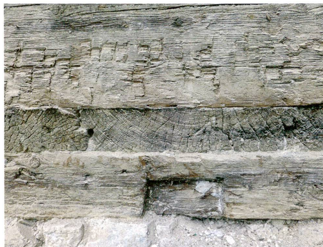
Abb.8 Schwyz, Gütschweg 11. Das Detail der die Fassade durchstossenden Bodenbohle über dem gemauerten Sockel zeigt die handwerkliche Qualität der Zimmerleute in der Zeit um 1300.

Bewohnerinnen und Bewohner sowie zu deren Lebensumständen um 1300 dar – einer Zeit, die in der öffentlichen Wahrnehmung als Gründungszeit der Schweizerischen Eidgenossenschaft gilt.