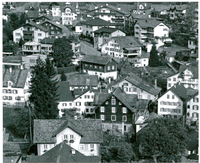
Abb.1 Das Dorfbachquartier von Schwyz in einer Luftaufnahme um 1990. Die Bebauung ist geprägt von klaren, schlichten Baukörpern mit Giebedächern.

bebetrieb begann, endete mit der Entdeckung eines mittelalterlichen Bauensembles am Schwyzer Dorfbach. Dadurch scheint nun der Nachweis erbracht, dass das Dorfbachquartier neben dem herrschaftlichen Zentrum um den Hauptplatz mit Pfarrkirche, Rathaus und Archivturm bereits um 1300 einen Siedlungs- und Entwicklungsschwerpunkt im mittelalterlichen Schwyz bildete. 3