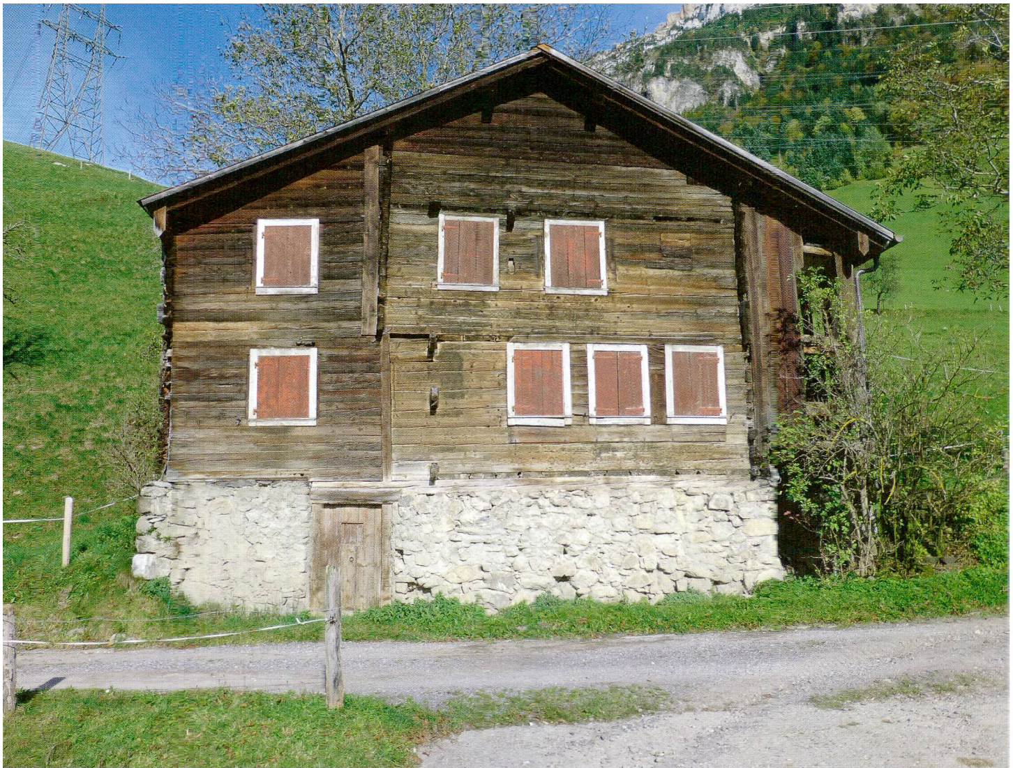
Abb. 4 Morschach, Haus Tannen. Der im Kern 1341 datierte Bau zeigt beispielhaft die charakteristischen Merkmale der mittelalterlichen Bauten in Schwyz.

Sie wurden handwerklich präzise gesetzt und mit Dübeln zusammengefügt. Während sie im Eckverband regelmässig verkämmt sind, treten bei den Innenwänden Einzelvorstösse aus der Aussenwand. Diese Konstruktion ist bis ins 16. Jahrhundert in unterschiedlicher Ausprägung bezüglich Anzahl und Form üblich. 20 Elemente der mittelalterlichen Grundstruktur mit gemauertem Sockel, Stube und Nebenstube auf der talseitigen Giebelfassade wie auch die seitlichen Lauben blieben dagegen für den ländlichen Holzbau in unserem Gebiet über Jahrhunderte hinweg prägend.