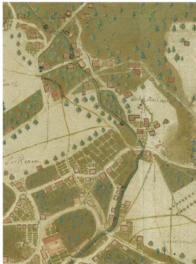
Abb.2 «Grund-Riss von dem Hauptflecken Schwytz», Original von Jost Rudolf Nideröst von 1746, überliefert in der Kopie von Plazidus Hediger von 1784. Ausschnitt Dorfbachquartier mit dem Grundriss des Kloster St. Peter am Bach am unteren Bildrand.

Erstaunlich ist daher an sich weniger die Erkenntnis, dass der Blockbau im Mittelalter etabliert war, sondern vielmehr die Tatsache, dass diese Bauten in Schwyz die Jahrhunderte bis heute überdauert haben. Dies dürfte