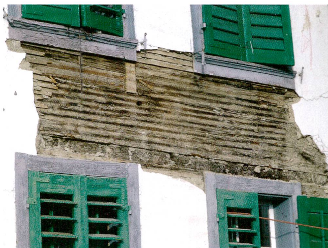
Abb.7 Schwyz, Gütschweg 11. Der punktuell entfernte biedermeierliche Verputz lässt den mittelalterlichen Blockbau von 1311 hervortreten.