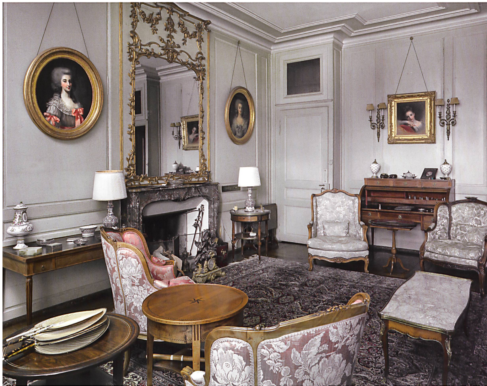
Hauteville, château. Vue du salon d'hiver, 2015. Musée national suisse, Dig. 26443.