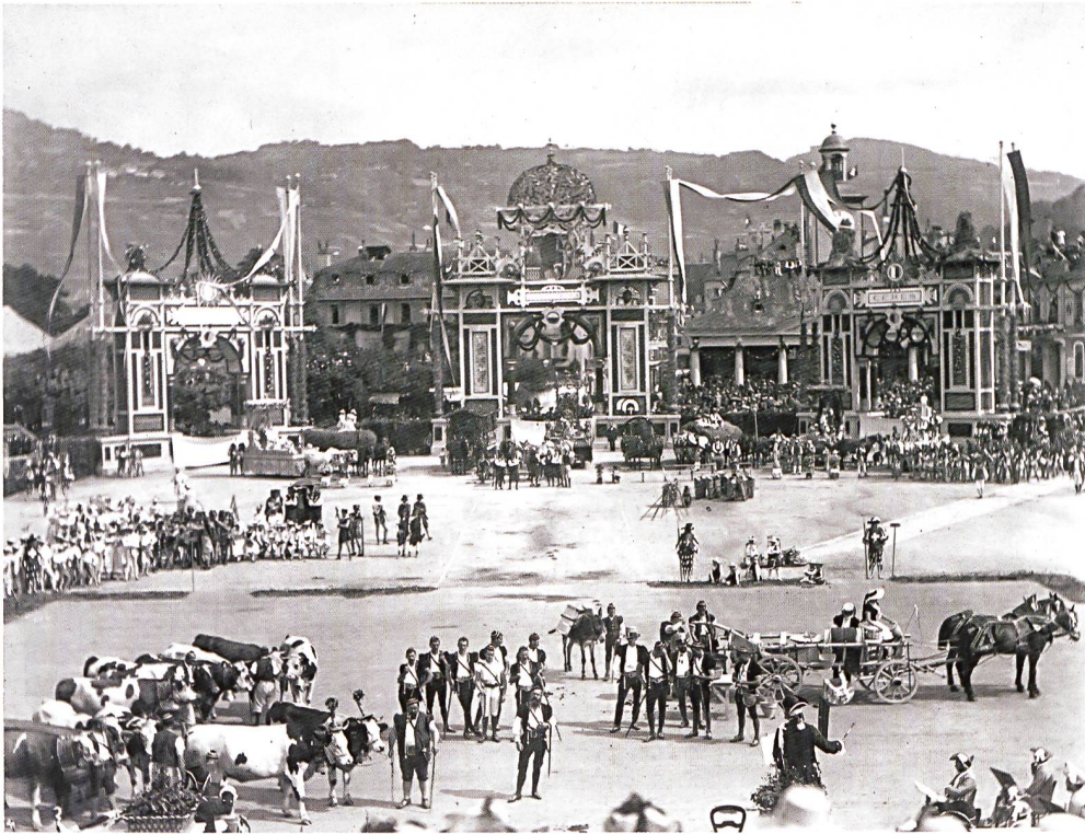
Fig.10 Les armaillis et Placide Currat chantant le ranz des vaches. Photographie par Fischer Frères & Rebmann, tirée de l'album Souvenir de la Fête des Vignerons célébrée à Vevey 5-10 août 1889 . Confrérie des Vignerons, Vevey.

Musée de la Confrérie des Vignerons, Vevey par SABINE CARRUZZO