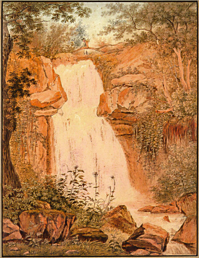
Fig.11 La cascatelle d'Hauteville , par Théophile Steinlen, début du XIX e siècle. Aquarelle sur papier, 26 × 20 cm. Le Musée en possédait déjà le dessin préparatoire. Musée historique de Vevey.

Musée historique de Vevey par FRANÇOISE LAMBERT