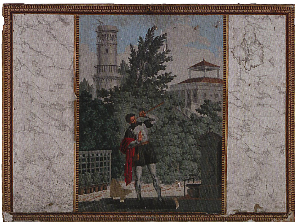
Fig.1 Trois papiers peints montés en écran de cheminée ont été trouvés dans les combles du château d'Hauteville. L'un d'eux illustre la fable de La Fontaine L'astrologue qui se laisse tomber dans un puits . Il peut être attribué à la manufacture Jean Zuber et C ie à Rixheim (F) et fait partie du décor à fables de 1809. Musée national suisse, LM 171405.

(Christies, 30 septembre–1 er octobre 2014) et au château d'Hauteville (Hôtel des Ventes de Genève, 11–12 septembre 2015). Les objets sont regroupés par institution. Sans autre indication, le numéro de lot mentionné renvoie à la vente au château d'Hauteville.