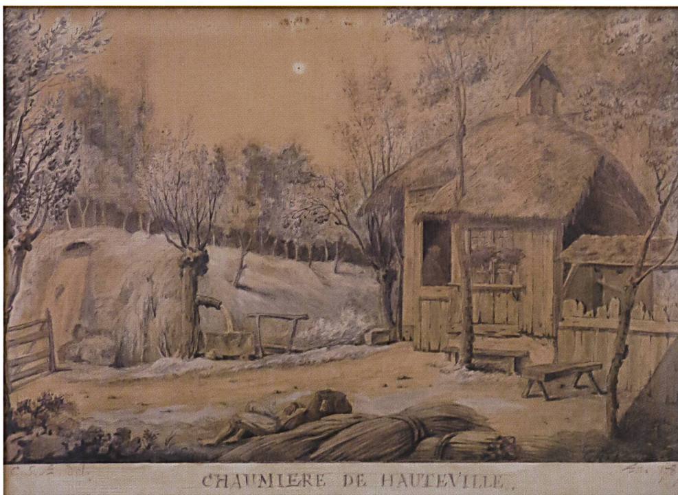
Fig.9 Ce tableau figure à la page 185 du livre Le château d'Hauteville et baronnie de St-Légier et la Chiésaz , édition SPES SA, Lausanne, avril 1932. Ce livre a été tiré à 250 exemplaires. Les archives de Saint-Légier – La Chiésaz possèdent le numéro 17. Archives de Saint-Légier – La Chiésaz.

Archives de la commune de Saint-Légier – La Chiésaz par GIANNI GHIRINGHELLI