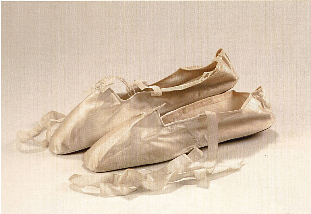
Fig.12 Chaussons pour homme en satin de soie duchesse écriu signés « M. Schenck dit l'Allemand et Mlle d'Orléans », 1820–1840. Musée suisse de la mode.

Musée suisse de la mode, Yverdon-les-Bains par ANNA-LINA CORDA