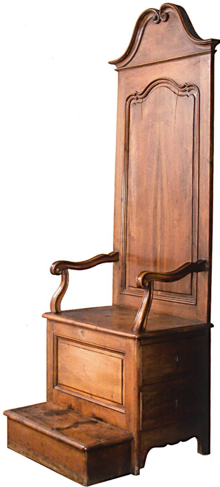
Fig. 4 Siège de justice, fauteuil d'apparat en noyer, vers 1740. Musée cantonal d'archéologie et d'histoire, 2016.

Musée cantonal d'archéologie et d'histoire, Lausanne par CLAIRE HUGUENIN ET DENIS DECAUSAZ