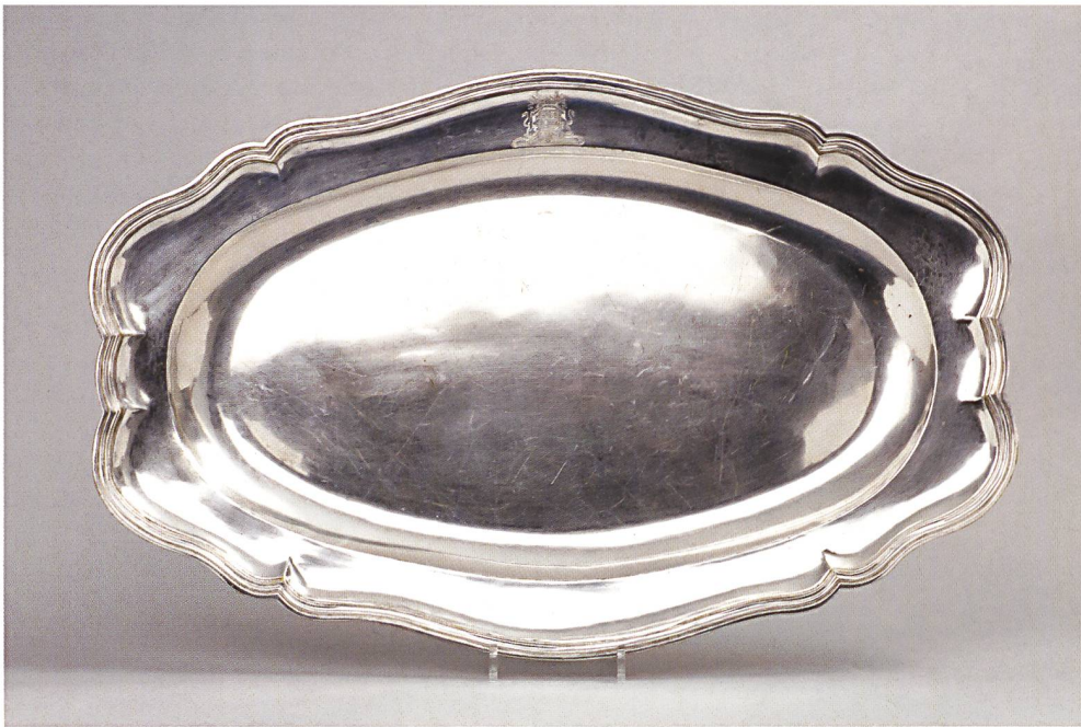
Fig. 8 Orfèvre anonyme, Lyon, Genève ou Lausanne (?), grand plat de service, modèle dit « strasbourgeois », gravé aux armes Cannac, vers 1770. Château de Nyon, 2015.