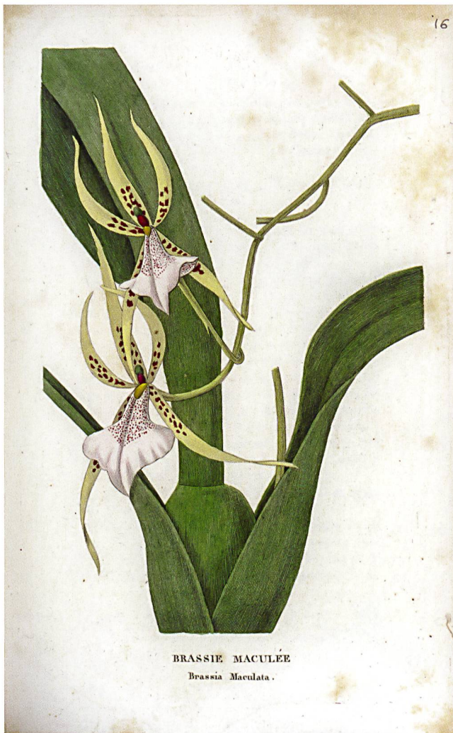
Fig.5 La brassie maculée, une orchidée exotique illustrée dans CELS et al. , Annales de Flore et de Pomone ou Journal des Jardins et des champs , vol. 1, 1832. Musée et Jardins botaniques cantonaux.

Musée et Jardins botaniques cantonaux, Lausanne par JOËLLE MAGNIN-GONZE