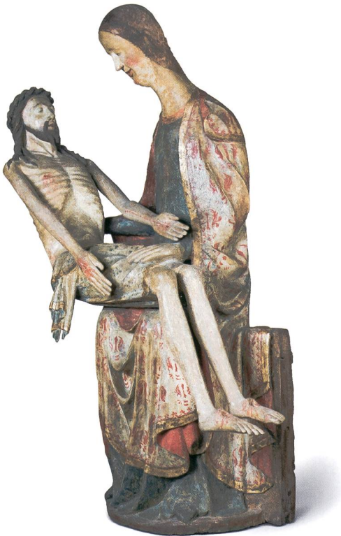
Abb. 4 Vesperbild, Dreiviertelansicht von rechts, um 1340. Sammlung Emil Bührle, Zürich.