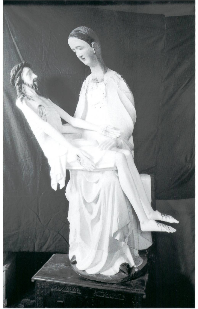
Abb. 11 Vesperbild, um 1340, Zustand um 1931. Sammlung Emil Bührle, Zürich.

Die zahlreichen Veränderungen, die das Vesperbild im Laufe der Jahrhunderte erfahren hat, lassen sich anhand von älteren Fotos, Werkzeugspuren und einer Inschrift in den wichtigsten Zügen rekonstruieren. 46 Um die Figur zu bekleiden, hat man – wohl im Barock – den geschnitzten