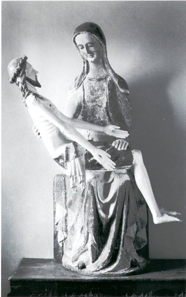
Abb. 12 Vesperbild, um 1340, Zustand kurz vor 1939. Sammlung Emil Bührle, Zürich.

liess jedoch die erneuerten Ohren stehen. Auch die Fassung von 1924 blieb vorerst unangetastet. In diesem Zustand publizierte er das Vesperbild 1931 erstmals im Anzeiger für Schweizerische Altertumskunde (Abb. 11). 47 In den darauffolgenden Jahren liess Reiners offensichtlich die barocken Ohren abnehmen, Kopf, Schultern und Brustpartie der Maria überarbeiten und die moderne Fassung teilweise entfernen. In diesem Zustand bot er die Figur 1936 dem Bernischen Historischen Museum und dem Schweizerischen Nationalmuseum in Zürich zum Kauf an, wie eine Fotografie zeigt, die er dem Nationalmuseum zur Beurteilung der Skulptur zukommen liess. 48 Kurz darauf scheint Reiners die Marienfigur mit einem neuen Kopftuch versehen zu haben, denn die 1939 erschienene Publikation seiner Frau Elisabeth Reiners-Ernst zeigt die Pietà mit ergänztem Kopftuch, dessen Form von Letzterer übrigens kritisiert wird (Abb. 12). 49