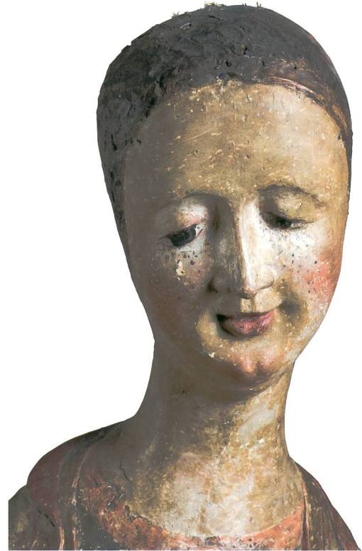
Abb. 5 Vesperbild, Gesicht Mariens, um 1340. Sammlung Emil Bührle, Zürich.