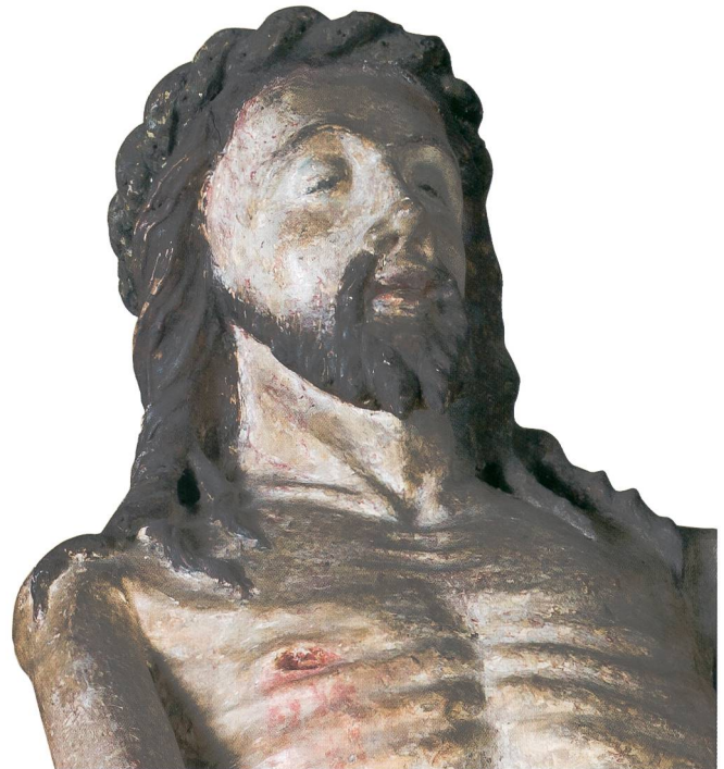
Abb. 6 Vesperbild, Gesicht Christi, um 1340. Sammlung Emil Bührle, Zürich.