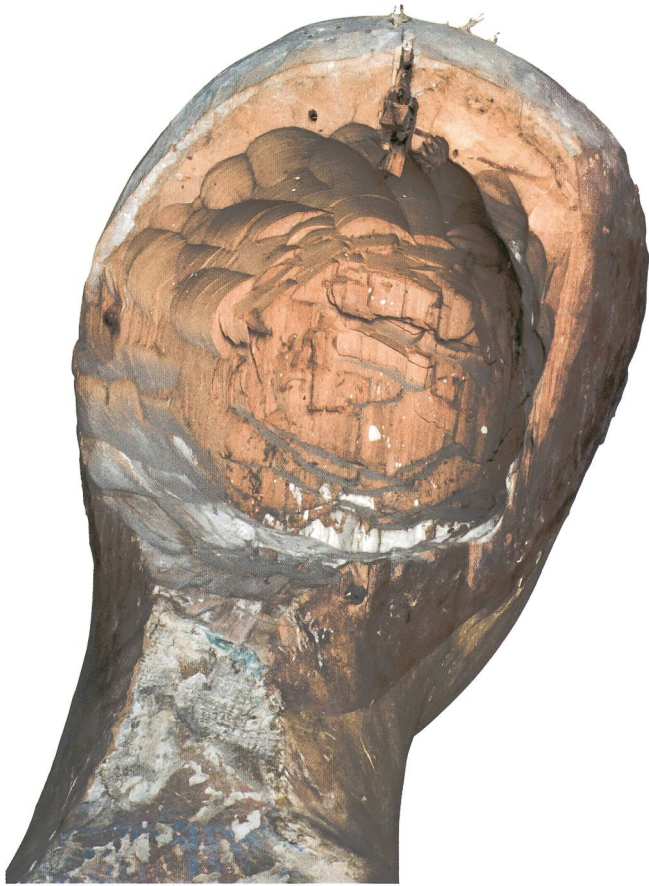
Abb. 8 Vesperbild, rückseitige Höhlung des Kopfes Mariens, um 1340. Sammlung Emil Bührle, Zürich.

einem Schrein zu stehen, beliess man die Höhlung in der Regel offen, bei freier Aufstellung, zum Beispiel als Einzelbildwerk auf einem frei stehenden Altar, wurde sie hingegen meist mit einem Brett verschlossen. Nebst einteiligen kamen in seltenen Fällen auch mehrteilige Höhlungen vor, bei denen einzelne Körperteile gesondert ausgehöhlt wurden. Zu diesen gehören separate Kopfhöhlungen – von der Forschung als Spechtlöcher bezeichnet –, die seit dem ausgehenden 15. Jahrhundert vor allem in der ulmischen und fränkischen Skulptur eine gewisse Verbreitung fanden. 40 Die Kopfhöhlung der Muttergottes unseres Vesperbildes ist jedoch sowohl aufgrund ihrer frühen Datierung wie auch ihrer Grösse ein ausgesprochen seltener Fall. Zu den raren Beispielen des 14. Jahrhunderts gehört das etwa gleichzeitig entstandene Vesperbild in Leuk, 41 dessen Kopfhöhlung wie diejenige der Bührle-Pietà wesentlich grösser ist als die Spechtlöcher des 15. und 16. Jahrhunderts. Es stellt sich deshalb die Frage, ob diese grosszügigen Kopfhöhlungen einst Reliquiendepositorien waren. Als solches interpretierten Heribert Reiners und Elisabeth Reiners-Ernst bei der Bührle-Pietà eine damals offenkundig noch sichtbare quadratische Öffnung von 7 cm Seitenlänge am Hinterkopf der Maria, die mit einem von Leinwand überzogenen Deckel verschlossen