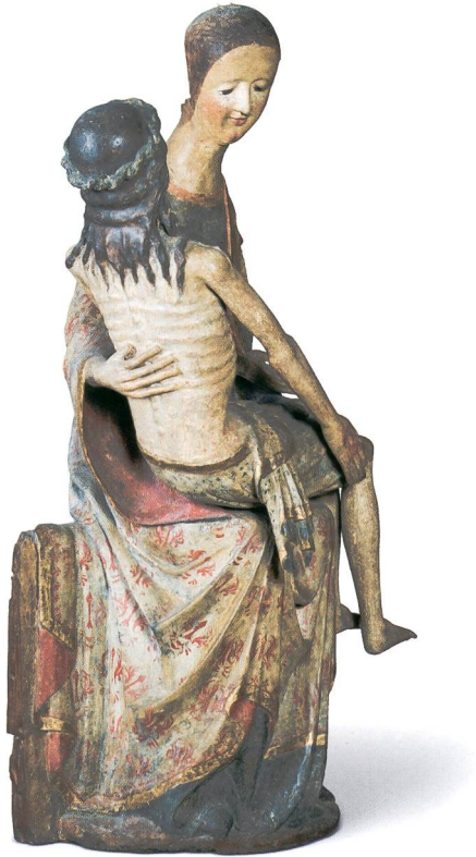
Abb. 3 Vesperbild, Dreiviertelansicht von links, um 1340. Sammlung Emil Bührle, Zürich.