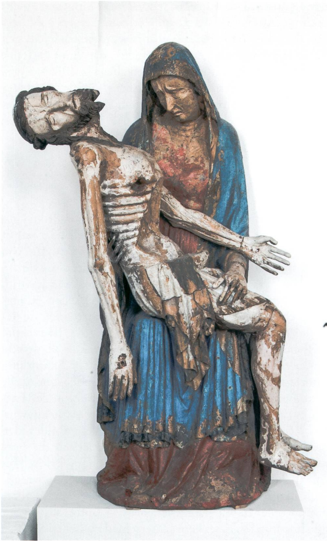
Abb. 13 Vesperbild, um 1320/40. Salmdorf, ehem. Wallfahrtskirche Mariä Himmelfahrt.

dieser Gruppe einen Einzelfall dar. Kein treffendes Vergleichsmerkmal ist zudem die Zweiteiligkeit der Figur mit sitzender Muttergottes und abnehmbarem Christuskorpus, die Michler bei einigen Vesperbildern der Gruppe festgestellt hat und für die er einen spezifischen liturgischen Gebrauch in der Karwoche vermutete. Denn die Skulptur der Sammlung Bührle ist nicht aus zwei, sondern technisch bedingt aus einem guten Dutzend Einzelteilen zusammengesetzt, und die Christusfigur ist nicht im eigentlichen Sinne abnehmbar.