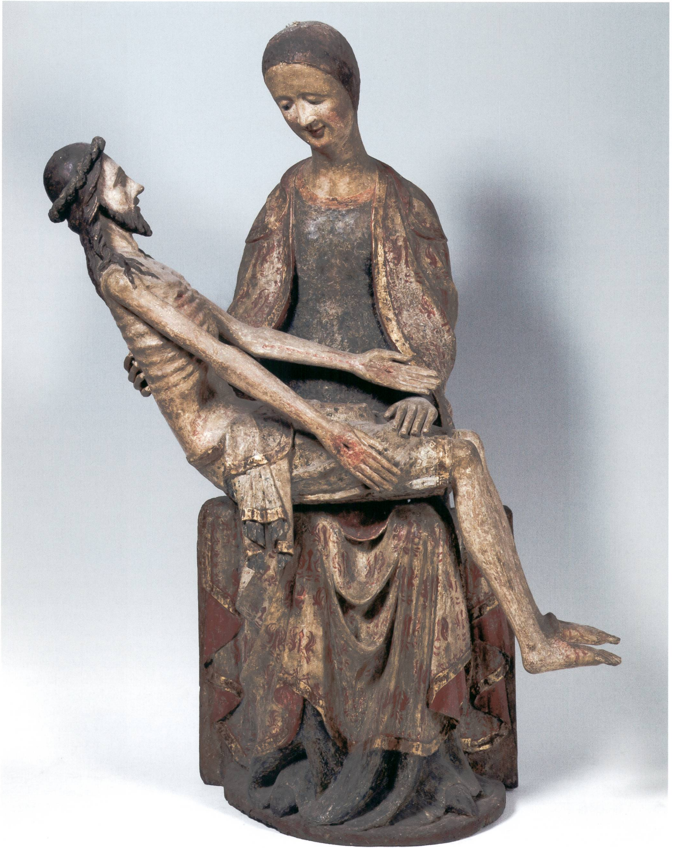
Abb. 1 Vesperbild, um 1340, aktueller Zustand. Sammlung Emil Bührle, Zürich.