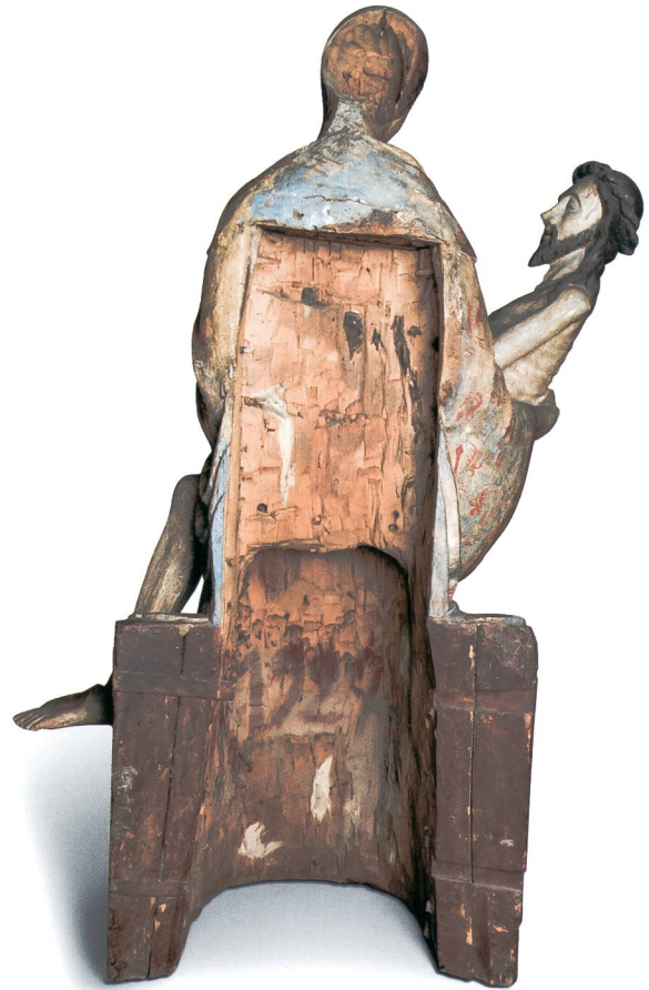
Abb. 7 Vesperbild, Rückseite mit separater Höhlung von Rumpf und Kopf Mariens, um 1340. Sammlung Emil Bührle, Zürich.

Das Zusammensetzen einer Figur aus mehreren einzeln geschnitzten Teilen ist für Skulpturen des 13. und 14. Jahrhunderts nicht unüblich. Für die grossformatigen Vesperbilder ist es geradezu die Regel, denn es war schwierig und unökonomisch, Werke dieser Grössenordnung, die sich überdies aus einer vertikal und einer horizontal gelagerten Figur zusammensetzten, aus einem einzigen Werkblock zu fertigen. Selten sind für diese Zeit hingegen die mithilfe von Dübeln angesetzten Holzpartien, durch die der Werkblock vor dem Schnitzen vergrössert wurde. Dieses als Werkblockerweiterung bezeichnete Phänomen ist typisch für eine Reihe von Skulpturen aus der Werkstatt Niklaus Gerhaerts aus den 1460er Jahren, wobei auch bei diesen Beispielen die Erweiterungen während der Ausarbeitung oft so weit abgeschnitzt wurden, dass nur ein dünner «Holzfladen» und/oder ein respektive mehrere Dübel übrig blieben. 38