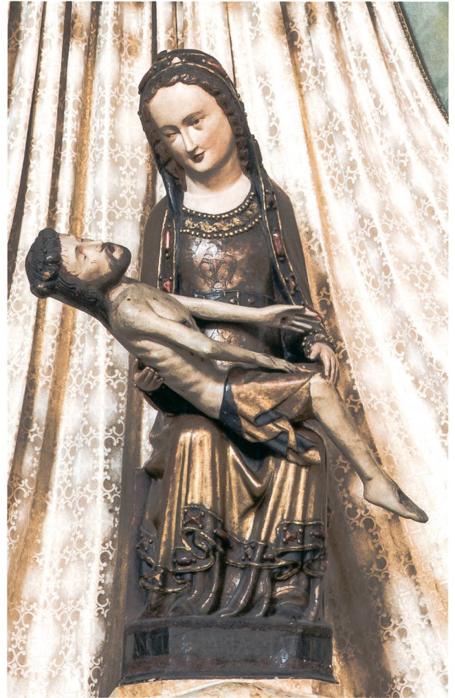
Abb. 14 Vesperbild, um 1330. Bamberg, Pfarrkirche St. Martin.

Über diese allgemeine Einordnung hinaus lässt sich unser Vesperbild allerdings nicht mit anderen Bildwerken seiner Zeit in Verbindung bringen. Stilistisch bleibt es letztlich ein Einzelgänger. 61 Auch wenn aufgrund seiner Provenienz eine Herkunft aus einer Freiburger oder Berner Werkstatt zu vermuten ist, kann es mit keinem anderen Werk direkt verglichen werden. Dies mag zum einen an der Überlieferung liegen, denn aus dem reformierten