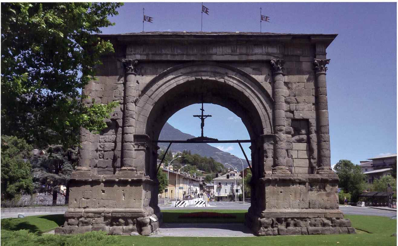
Fig. 3 L'arco costruito ad Aosta in seguito alla vittoria dei Romani sui Salassi nel 25 a.C.

Per lungo tempo, in realtà, le Alpi non esistono. Non esistono intanto nella storiografia greca se non come elementi ideali di un ambiente mitico nel quale foreste, acque, cime rappresentano l'alterità, il selvaggio, il liminare, e nutrono un immaginario fatto di imprese eroiche, di lotte contro gli elementi primordiali della natura, di iperboli. 16 Non a caso Eracle è un personaggio centrale per comprendere l'idea greca delle Alpi. 17 L'eroe si colloca al centro di un sistema di miti e di narrazioni che hanno origine nella cultura micenea e giungono fino all'età romana, con sopravvivenze nella mitologia del cristianesimo. Eracle fu un eroe 'etnico', nel senso che era presente in quasi tutte le comunità antiche, anche se sfuggente a un collegamento troppo stretto con una cultura in particolare; fu una figura di mediazione, o di sintesi, fra opposti archetipici quali umano/divino, natura/cultura e caccia/agricoltura; le sue avventure rimandano ai lati opposti dell'ecumene e li contengono tutti. Naturalmente, ci fu anche un Eracle alpino, ed è questa l'ipostasi che qui interessa: per ottemperare alla richiesta di Euristeo di sottrarre i buoi al mostro Gerione, Eracle attraversò il Mediterraneo, penetrò in Iberia, oltrepassò i Pirenei, scese in Gallia e superò le Alpi diretto verso l'Italia con la mandria rubata. La Via Eraclea prevedeva quindi una tappa sulle Alpi e la consegna della civiltà e dell'agricoltura ai montanari (anche se non si può