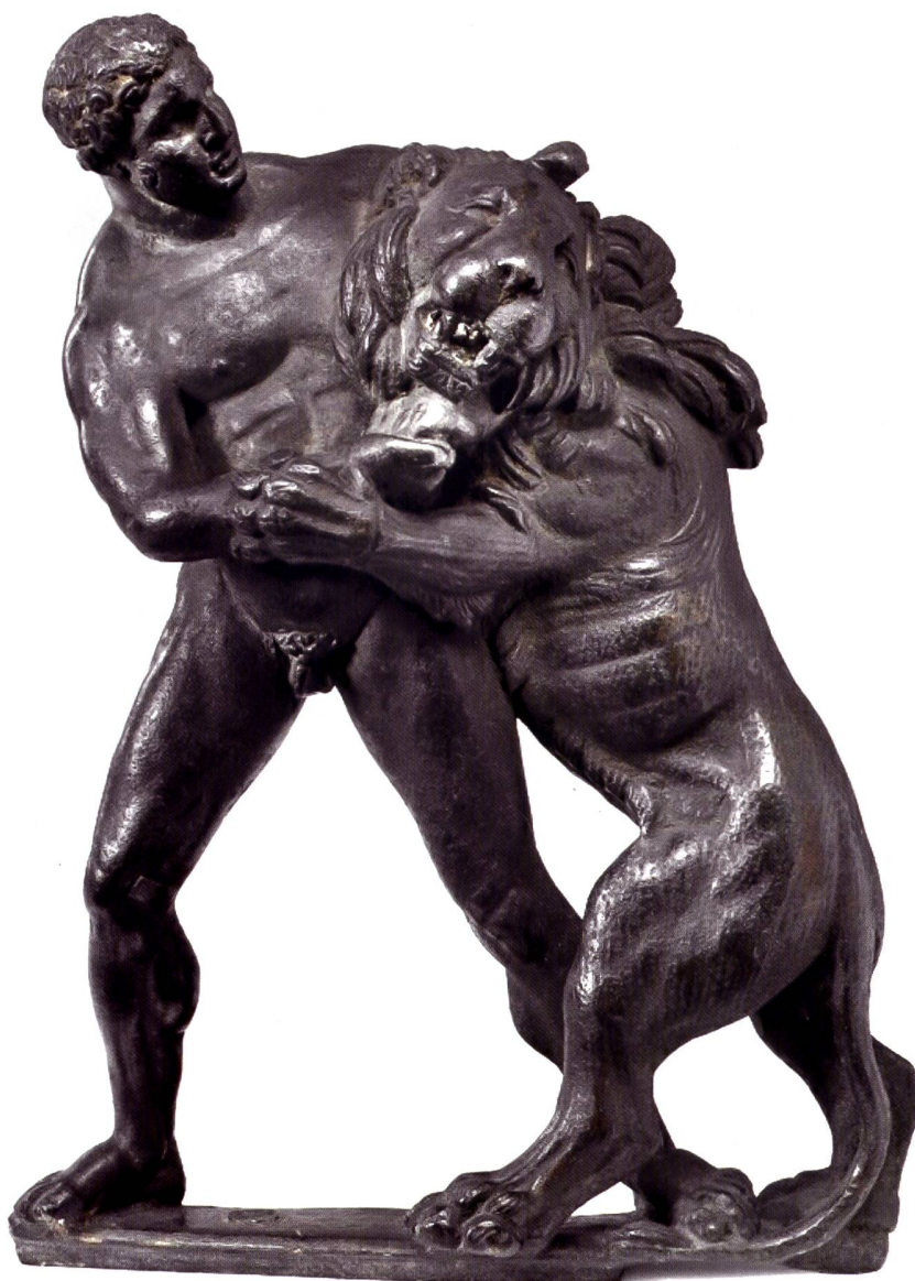
Fig. 4 Ercole che lotta col leone. Bronzo, 22,5 × 16 × 8 cm, di età romana, trovato ad Avenches (VD).

escludere una più semplice via costiera attraverso Monaco e la Liguria di Ponente, ma le varianti del mito sono numerose). Ovunque Eracle era venerato come ipostasi protettrice dei transiti e degli empori, ma anche come guerriero capace di vincere le forze naturali e come guaritore grazie alle acque termali; nelle Alpi era anche nume tutelare delle greggi e della transumanza e godeva quindi di particolare favore. Chiaramente, le Alpi in tutto questo sono poco più che uno scenario che fa da sfondo alle imprese dell'eroe; la narrazione si nutre di miti e rivela un'assoluta ignoranza dei luoghi (Fig. 4). 18