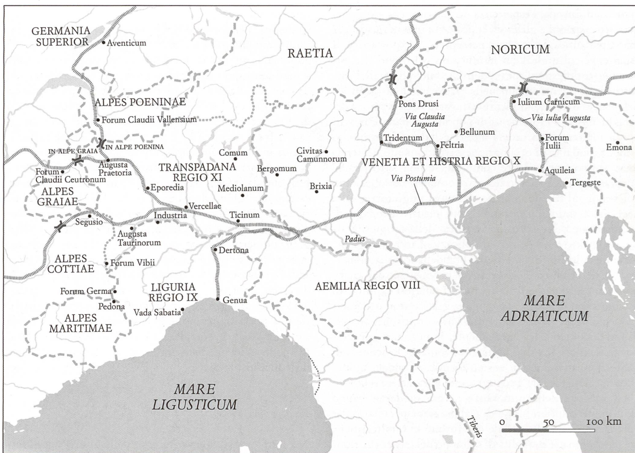
Fig. 1 Le province alpine.

Nel caso di descrizioni più accurate e informate, è sembrato utile ragionare sul modello di riferimento. 11 Infatti sappiamo che la descrizione alpina di Strabone (60 a.C. circa–23/24 d.C.), ad esempio, è probabilmente mutuata su quella di altre grandi catene montuose che scandivano