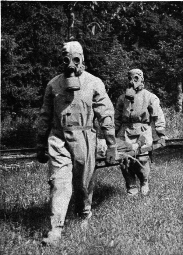
Rettungsmannschaft in Schutzanzügen gegen Hautgifte.

und Projektionen begleiteten Vortrag über «Luftgefahr und Luftschutz» hat er die ihm übertragene Aufgabe in sehr geschickter Weise angepackt und durchgeführt.