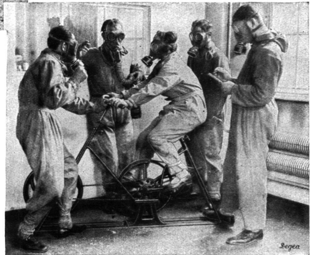
Leistungsübungen am Tretrad

Nachdem man den Reizgasraum wieder verlassen hat, darf man weder eng zusammen stehen bleiben, noch sofort die Maske abnehmen, denn der in die Kleidung eingedrungene Giftstoff verflüchtigt sich und würde in den ersten Minuten unangenehme Wirkungen ausüben. Man muss vielmehr auseinander treten, die Kleider ausklopfen und kann erst nach einiger Zeit die Geräte abnehmen.