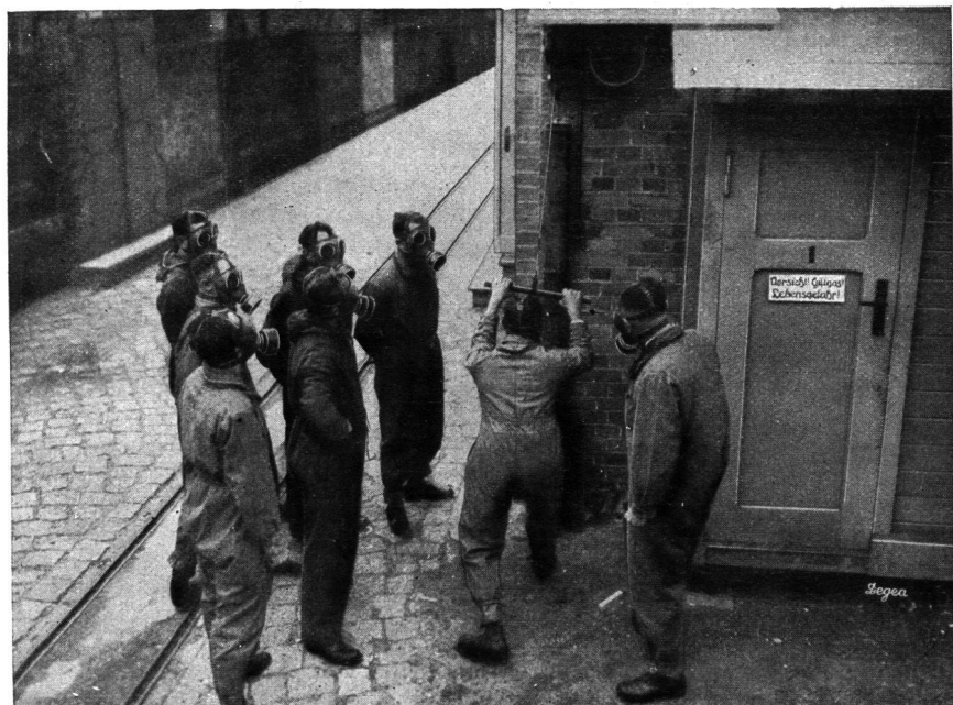
Leistungsübungen an der Schlagmaschine

Das Sprechen unter der Maske stellt eine weitere Dichtheitsprobe dar. Durch die Bewegung des Unterkiefers wird die Maske mitbewegt und eine bis anhin verborgen gebliebene Undichtheit würde sich verraten. Gern wird an Stelle des Sprechens gesungen, weil dabei der Mund meist weiter geöffnet wird als beim Sprechen.