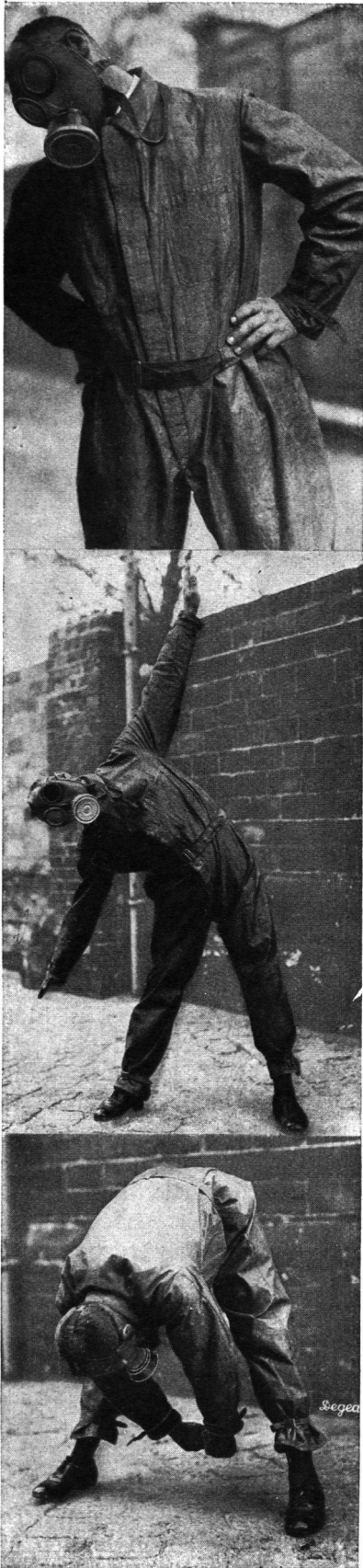
Kopfbeugen und Atemübungen unter der Gas- maske

Vorsicht geboten; denn wenn jemand sich überschätzt, kann er über den zu Ueberspringenden hinweggreifen und dadurch zu Fall kommen. Man wird daher die Uebungen auf gutem Weichboden, Gras- oder Sandboden abhalten, um Verletzungen zu vermeiden. Schliesslich gehören in diese Gruppe Uebungen an den Arbeitsmessgeräten, wie sie besonders bei den Feuerwehren und Grubenrettungsstellen in Benutzung sind. Eine einfache Messmaschine kann man sich leicht selbst herstellen. Ein Gewicht wird an einem Stahldraht über eine Rolle gezogen. Aus der Hubhöhe und dem Gewicht lässt sich die Arbeitsleistung dann leicht errechnen. Es ist klar, dass durch einen solchen Apparat nur die nutzbare Arbeit gemessen wird.