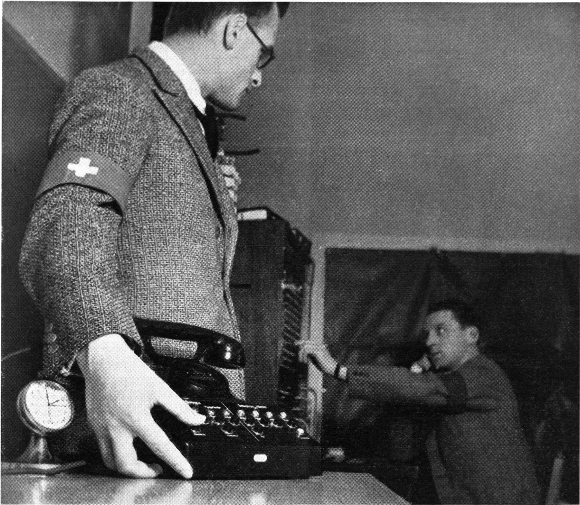
Die Alarmstation: Um den „Fliegeralarm“ für eine ganze Stadt auszulösen, genügt der Druck auf einen kleinen Knopf und augenblicklich heulen die elektrisch ferngesteuerten Sirenen auf.