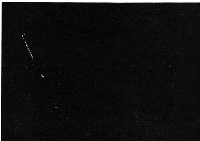
Abb. 3 ist während der Verdunkelung aufgenommen worden. Die Photozeitaufnahme zeigt nur in der Hauptstrasse einige Lichter behelfsmässig abgedunkelter Automobile und Fahrzeuge, die infolge der längern Belichtung der Photoplatte als Lichtstreifen erscheinen.

Die Gegenüberstellung dieser drei Aufnahmen ist sehr instruktiv und zeigt deutlich die Zweckmässigkeit der Verdunkelung einer Gegend.