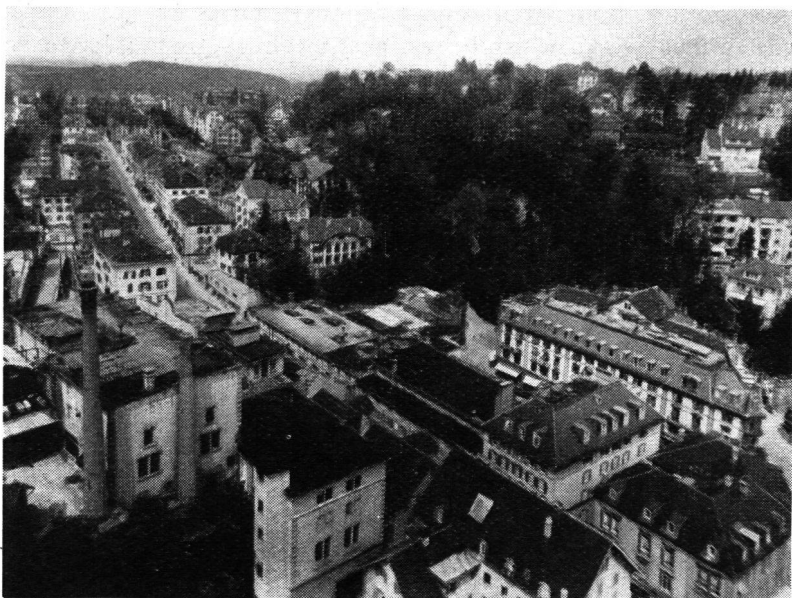
Abb. 1 zeigt den Stadtteil bei Tagesbeleuchtung.

Die abgebildeten drei Photoreproduktionen einer schweizerischen Stadt wurden zu verschiedenen Zeiten vom gleichen Standorte aus aufgenommen.