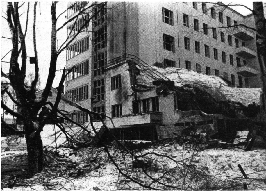
Abb. 5. Mikkeli, Militärhospital zerstört am 5. März 1940.