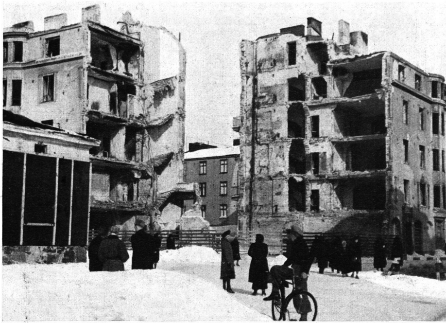
Abb. 4. Volltreffer auf Wohnhaus in Helsingfors am 30. November 1939.