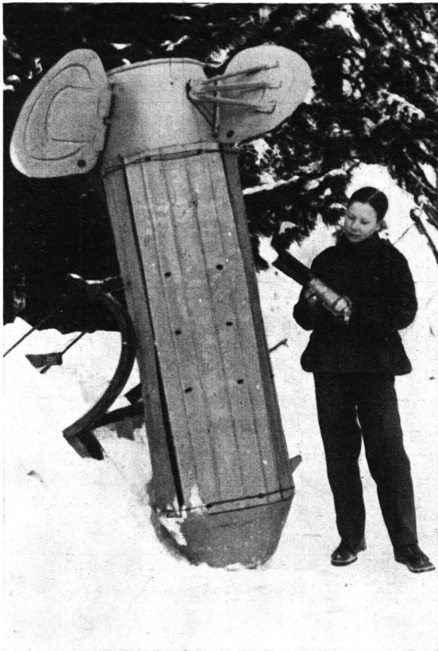
Abb. 2 Bombenstreuvorrichtung, kleine Brandbombe

lang, 20 m breit, Bombenladung 700 kg, Aktionsradius 1000 km, Besatzung 3 Mann, Bewaffnung 3 Maschinengewehre (Abb. 3).