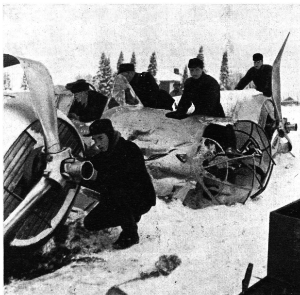
Abb. 2 Russische zweimotorige Bomber. SB 2.

Ein beschämendes Kapitel russischer Kriegführung bildet die Missachtung des Roten Kreuzes durch russische Flieger. Abb. 5 zeigt ein modernes Krankenhaus in einer Provinzhauptstadt. Am 5. März 1940 bombardierten 40 russische Flieger aus grosser Höhe dieses Gebäude, das deutlich mit rotem Kreuz versehen war, und fügten ihm schweren Schaden zu. Die Patienten hatten sich