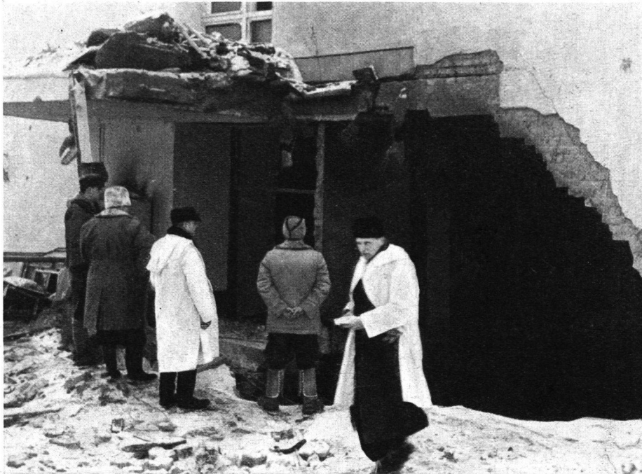
Abb. 6. Mikkelä, 9. März 1940, Militärhospital, Volltreffer in Schutzraum.