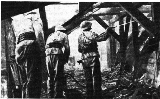
Abb. 4. Zens.-Nr. IV T. 787

Zum Schluss der Abräumdienst. Aller Brandschutt muss weg, sonst bleibt die Gefahr, dass das Feuer über kurz oder lang in den heissen Schutthaufen wieder ausbricht. Was an keiner trockenen Übung gemacht werden kann, was keine Theorie anschaulich macht, hier erlebt es jeder: Stundenlang, fünf- bis zehnmal länger als durch die