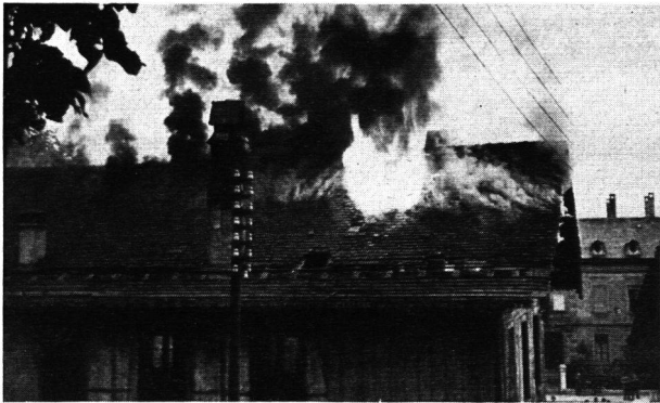
Abb. 1. Zens.-Nr. IV T. 784

Jeder Luftschutzoffizier, der die Instruktion der Hausfeuerwehr besorgt, fragt sich unwillkürlich, wenn er im Theoriesaal oder im Privathaus eine Schar Hausfeuerwehrlaute um sich versammelt sieht, ob es wohl tatsächlich möglich ist, dass