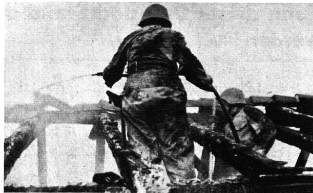
Abb. 5. Zens.-Nr. IV T. 788

eigentliche Löschaktion wird die Mannschaft im Ernstfall durch den Abräumdienst intensiv in Anspruch genommen. Riesige Massen Brandschutt müssen fortgeschaufelt und fortgetragen werden. Auch hier kann in den Hausfeuerwehrkursen nicht eindrücklich genug auf die Wichtigkeit der Mitarbeit der Zivilbevölkerung bei Brandfällen hingewiesen werden, genau wie beim Wassernachschub.