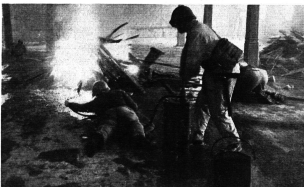
Abb. 2. Zens.-Nr. IV T. 785

Die zwei ersten Tage wurden durch Uebungen im Kreislaufgerät und in der Bekämpfung von Zimmerbränden ausgefüllt. Jeder Teilnehmer konnte am eigenen Leib die Zweckmässigkeit all der so oft gehörten und in der Theorie weitergegebenen Löschregeln erfahren: Angriff von unten nach oben; kriechend vorrücken (Abb. 2); Wasserstrahl möglichst nahe in die brennende Materie, nicht einfach ins Feuer richten; für Rauchabzug sorgen; Deckung beziehen (Abb. 3) etc.