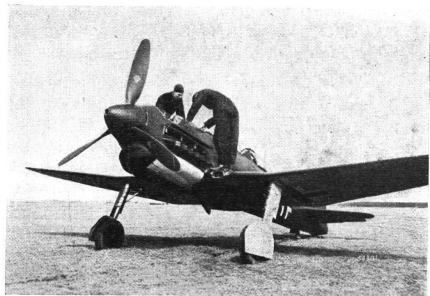
Der phantastisch schnelle Nachtjäger He 113 wird startbereit gemacht.

Der Nachtjäger He 113 ist ein freitragender Tiefdecker, eine Flugzeugbauart, die in den letzten Jahren bei allen Luftwaffen dominierend wurde. Er ist in der sogenannten Ganzmetallbauweise ausgeführt. Der bekannte, trapezförmigen Umriss aufweisende Knickflügel, welcher eine gute Sicht für den Piloten nach vorne gewährleistet, ist mit Dural-Glattblech beplankt. Infolge sorgfältiger aerodynamischer Durchbildung und Feinheiten der Fabrikation wie Versenknetzung, Vermeidung überlappter Blechstösse usw., weist der Flügel eine vollkommen glatte Oberfläche auf, was für ein solches Hochgeschwindigkeitsflugzeug erste Bedingung ist. Zwischen den Querrudern und dem Dural-Schalenrumpf sind Landeklappen eingebaut, die auf hydraulische Weise betätigt werden und den Zweck haben, die hohe Geschwindigkeit des Flugzeuges auf ein für die Landung