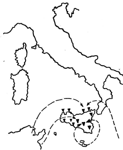
a) Ausschaltung der Luftverteidigung über Sizilien

Noch vor Abschluss des tunesischen Feldzuges hatte Luftmarschall Sir Arthur Tedder einen Angriffsplan für die Zeit vom 18. Mai bis zum 9. Juli vorbereitet. Die erste vorbereitende Phase umfasste