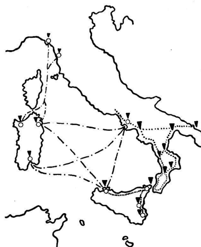
b) Schwächung der Verbindungen nach Sizilien

die Zeit vom 18. Mai bis zum 12. Juni: Erste Aufgabe war die Ausschaltung der Luftverteidigung über Sizilien — am 18. Mai wurde eine vierzehntägige Angriffsfolge auf die Luftstützpunkte der Achse im sizilianischen Raum ausgelöst; zweite Aufgabe war die Schwächung der Verbindungen zwischen Sizilien und Italien, zwischen Italien und Sardinien und zwischen Sizilien und Sardinien — zwanzig Angriffstage wurden ihrer Lösung gewidmet; dritte Aufgabe endlich war die Schwächung der Eisenbahnverbindungen an die Verbindungshäfen in Ostsizilien und Süditalien. Während der zweiten Phase, die vom 13. Juni bis zum 9. Juli dauerte, spielte dann die eigentliche Luftoffensive: Zunächst wurde — vom 13. bis 21. Juni — durch Zerstörung der Nachschubhäfen an