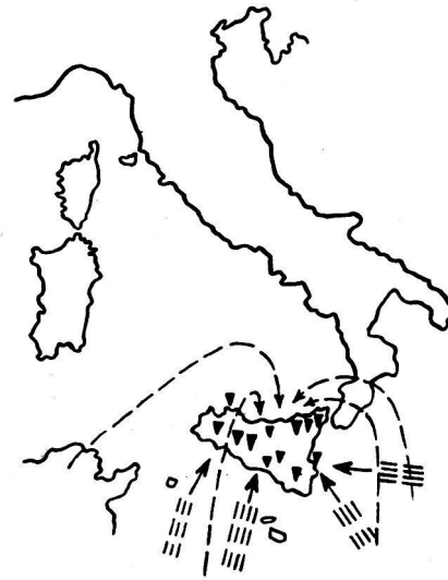
d) Ausschaltung der gesamten Verteidigungsorganisation