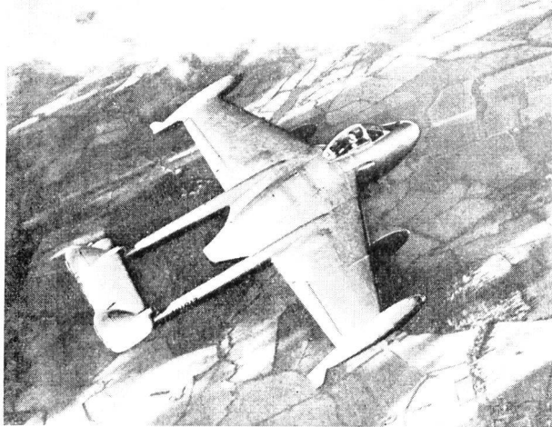
VENOM-Düsenjäger im Steigflug

Seine Bordwaffenausrüstung besteht aus vier 20-mm-Kanonen sowie Bomben und Kampfraketen. — An den Flügelenden können Zusatztanks, sog. Flügelspitzen-Reichweitenbehälter angebracht werden (auf dem Bilde ersichtlich).