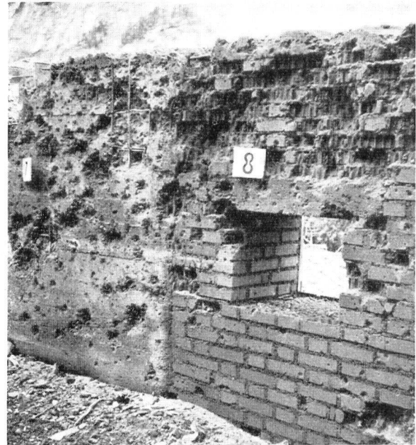
Splitterwirkung auf armierte Betonwand (links) und auf Backsteinmauer (rechts). Die nur 17,5 cm dicke Eisenbetonwand wurde durchschlagen, die Backsteinmauer erhielt Einschläge bis zu Tiefen von 19 cm.

sandsteine und den Beton ein, etwas mehr in den gewöhnlichen, etwas weniger in den armierten und mit Zement höher dosierten.