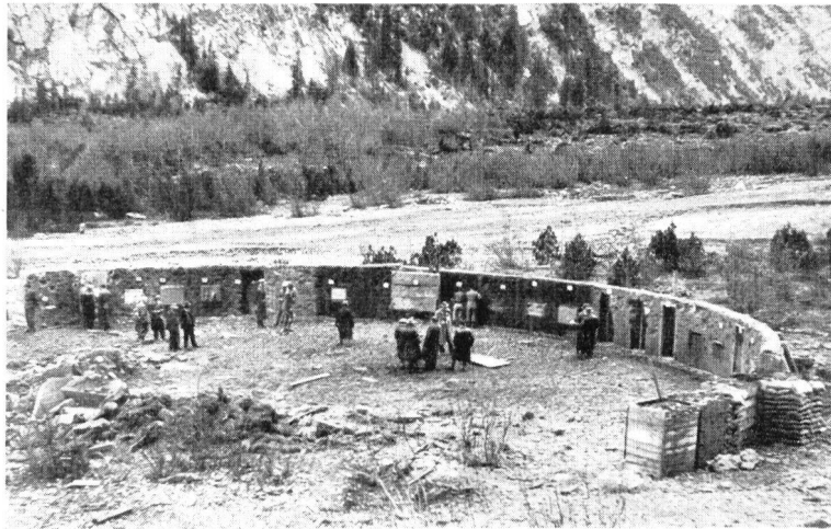
Die Versuchsanlage nach der ersten Sprengung einer 500-kg-Bombe.

Die Kriegstechnische Abteilung lieferte die Sprengladungen und Bomben und übernahm die Sprengleitung. Sie sorgte in Zusammenarbeit mit der Abteilung für Genie und Festungswesen, bzw. der FW Kp. 16,