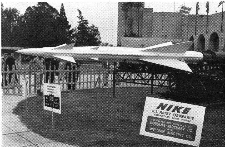
Im Kolosseum von Los Angeles (wo 1932 die olympischen Spiele stattfanden) führen Mannschaften der 47. Fliegerabwehrbrigade die Douglas-«Nike» der amerikanischen Öffentlichkeit vor. Der mittlere Durchmesser des Geschosses beträgt 30 cm und die Länge etwa 6 m.

Erfreulicherweise dürfen wir heute die Feststellung machen, dass auch unsere schweizerische Privatindustrie — die Werkzeugmaschinenfabrik Oerlikon (Bührle & Co.), Zürich-Oerlikon — seit einiger Zeit damit beschäftigt ist, eine ferngelenkte Flab-Flüssigkeitsrakete gegen hochfliegende Flugzeuge zu entwickeln. Die Oerlikon-Flab-Rakete erreicht eine Flugeschwindigkeit von 750 m pro Sekunde und eine Steighöhe von 20 000 Metern. Auch diese Rakete arbeitet nach dem sogenannten Leitstrahlverfahren. Dabei sendet ein Doppelstrahl-Funkmeßsender durch ein in der Nähe stehendes Funkmess- oder optisches Richtgerät, über eine äusserst präzise Fernsteuerung einen unter 60 Grad geöffneten Grobstrahl, und einen eng-