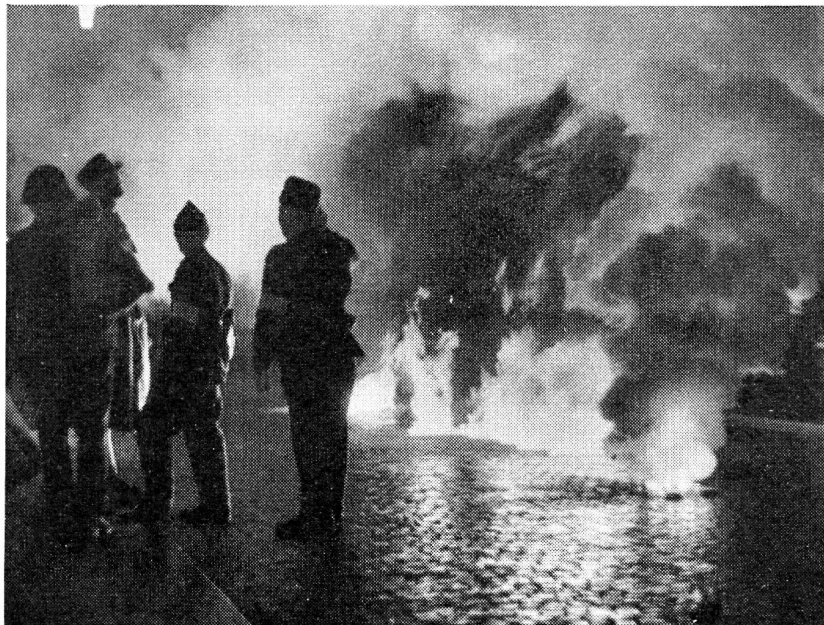
Dieses Bild vermittelt einen Eindruck der Schadenmarkierung. Sie wirkt hier zu Beginn ganz realistisch, hält aber aus Sparsamkeitsgründen zu wenig lang an, um den realistischen Eindruck für die eingesetzten Mannschaften zu erhalten oder noch zu steigern.

Umfang und Oertlichkeiten der Uebung machen konnte, war gut. Es spricht für die Gleichgültigkeit und das mangelnde Interesse, das diesem wichtigen Zweig unserer Landesverteidigung entgegengebracht wird, dass die eingeladenen Photoagenturen, die sonst