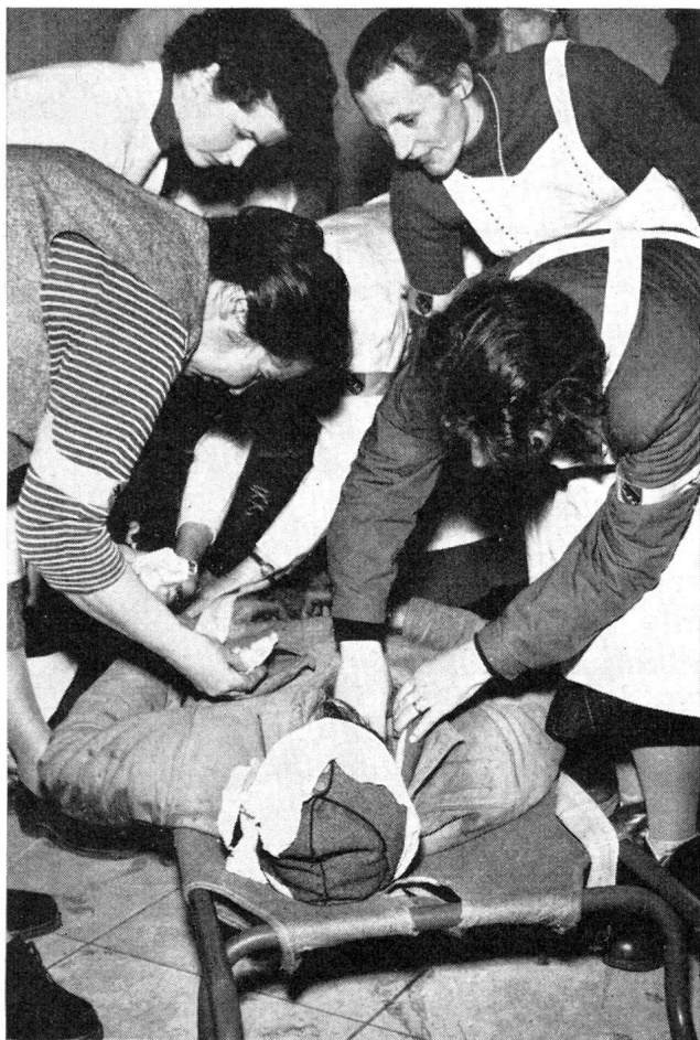
Wertvolle Hilfe der Frauen im Zivilschutz

der Eindämmung des Feuers. Der Kommandant der Ls. Kp. 1/14 ist sich klar, dass sein Primäreinsatzraum schwer in Mitleidenschaft gezogen wurde. Er setzt seine Kompagnie in Marsch und schickt eine Aufklärungspatrouille voraus. Der Ortschef setzt die Kriegsfuerwehr — in der Uebung der Ortsfeuerwehr — auf verschiedenen Richtungen am Brandzentrum an, während die Betriebsorganisationen an den betreffenden Einsatzorten des Feuers Herr zu werden versuchen. Die übrigen Kompagnien des Luftschutz-Bataillons werden auf dringende Hilferufe hin an anderen Punkten der Stadt eingesetzt, wo sie die Kriegsfuerwehren unterstützen oder ablösen.