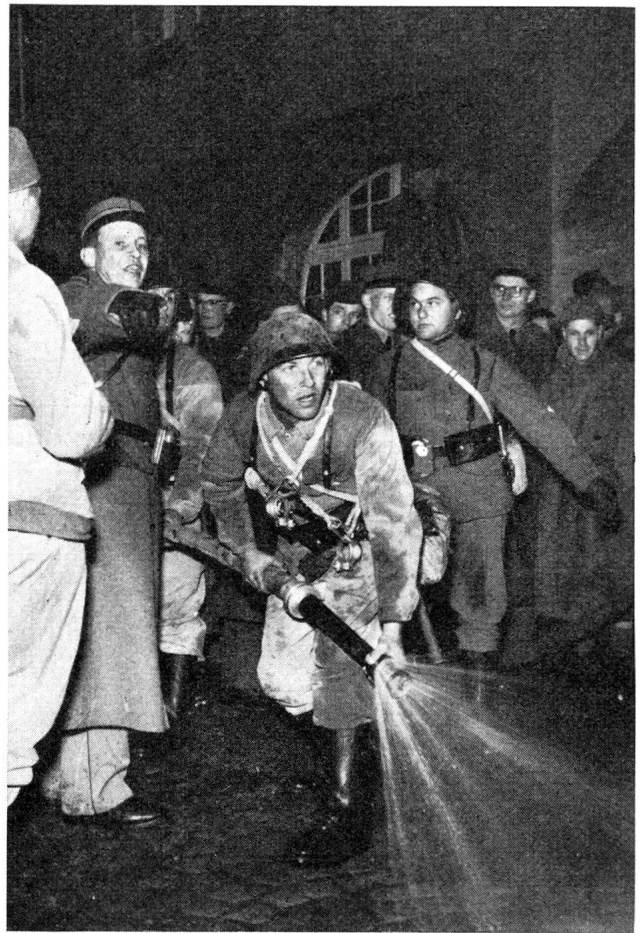
Armeeluftschutz an der Arbeit

Wir haben uns mit vielen anderen «Schlachtenbummlern» auf dem Schlosshügel postiert, um von erhöhter Warte aus die erste Phase dieser an ernste Kriegszeiten mahnenden Uebung verfolgen zu können. Und schon heulen die Sirenen in die dunkle Winternacht hinaus, zum Zeichen, dass Gefahr im Anzug ist. Nur wenige Minuten nach dem Alarm flammen und blitzen an verschiedenen Punkten der Stadt Petarden und Raketen auf: die ersten Bombeneinschläge. Der Angriff dauert fünf Minuten. Der Warndienst meldet: «Keine Gefahr mehr aus der Luft.» Auf Grund der Lagebeurteilung befiehlt der Ortschef Endalarm. Im Felsenkeller, dem Koordinationszentrum, herrscht Hochbetrieb. Läufer rapportieren über die durch Bomben angerichteten Schäden, die mit Funk und Draht verbundenen Aussen- und Beobachtungsposten geben ihre Meldungen durch, und auf den grossen Stadtplänen werden die Schäden markiert. Nach und nach ergibt sich folgendes Bild der Zerstörung: Die Altstadt wurde schwer getroffen. Einige Gassen sind vollständig verschüttet. Eine Brücke ist zerstört. Ganze Strassenzüge sind schwer beschädigt und zurzeit nicht passierbar. Gas-, Wasser- und Elektrizitätswerke haben Schaden genommen, zahlreiche Leitungen sind geplatzt. Verschiedene öffentliche und private Gebäude stehen in Flammen. Der Bahnhof ist schwer beschädigt.