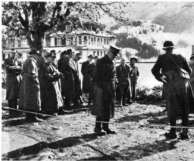
Mit einer österreichischen Studiendelegation